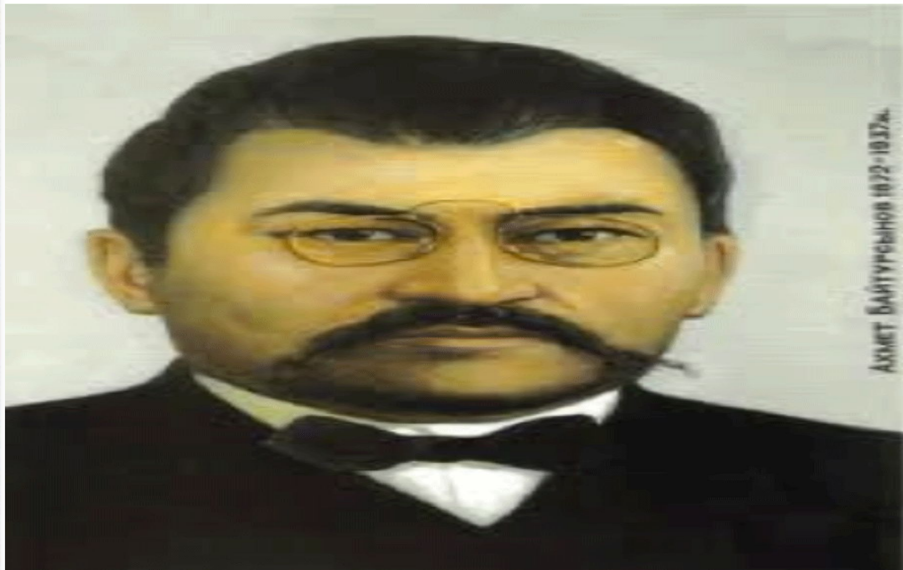
АХМЕТ БАЙТУРСЫНОВ 1872-1937ж.