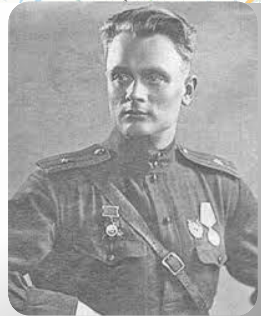
Александр Викторович Герман (1915-1943).