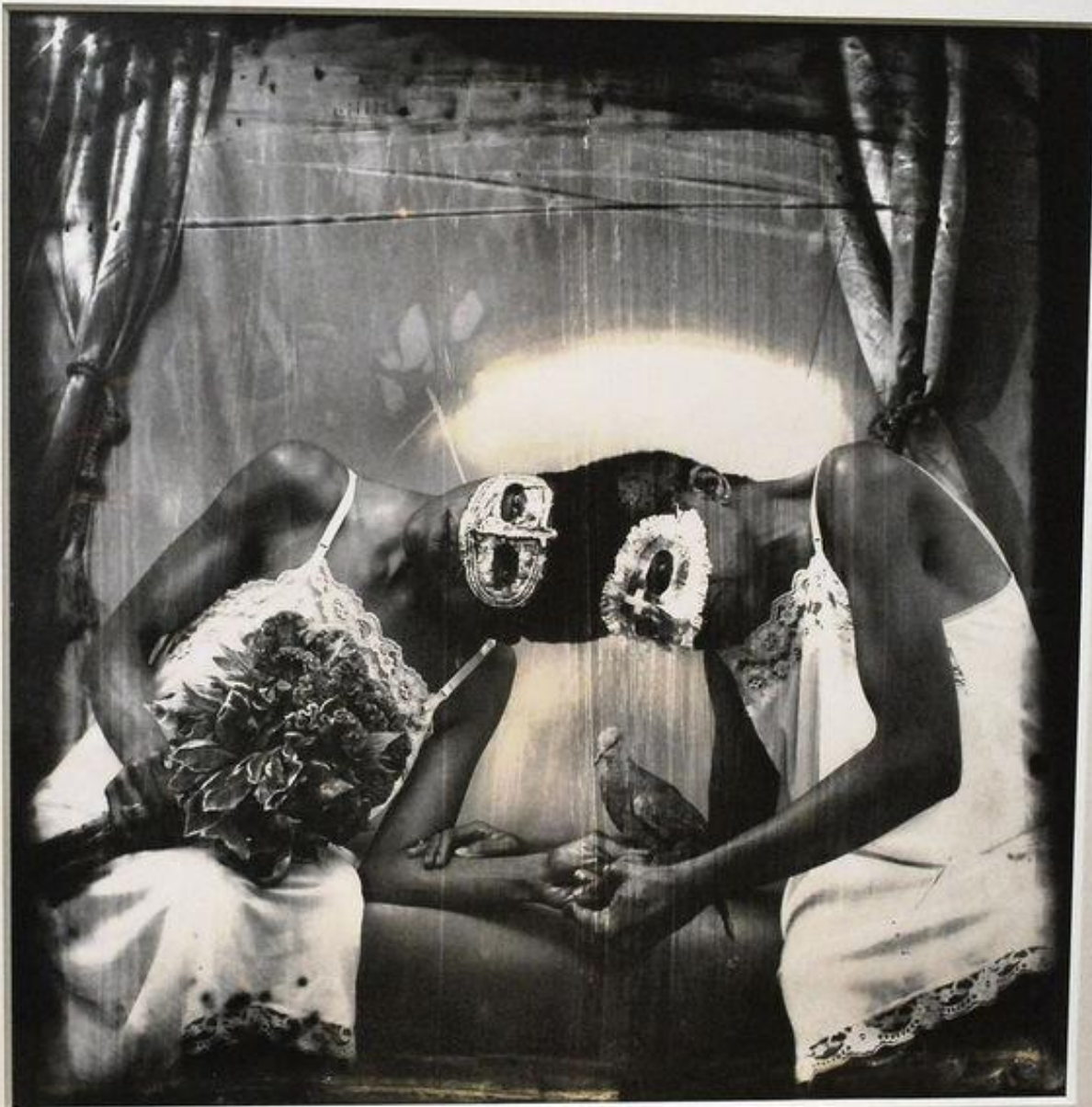
Сиамские близнецы, 1988