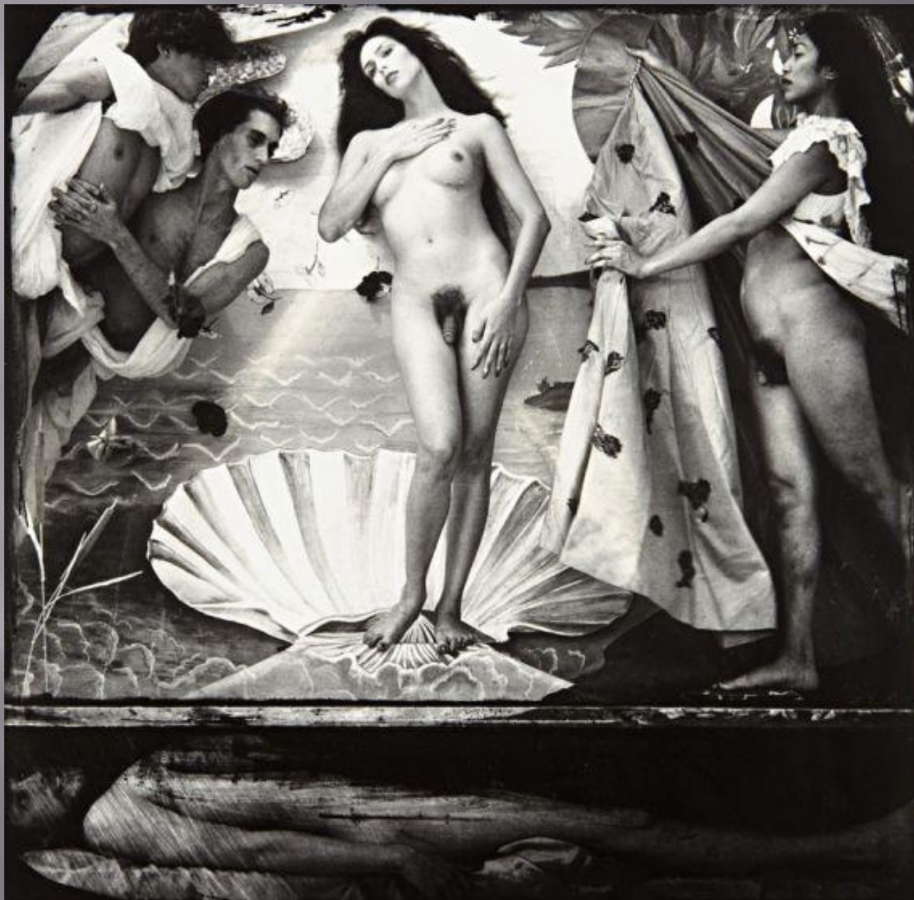
А-ля Рождение Венеры