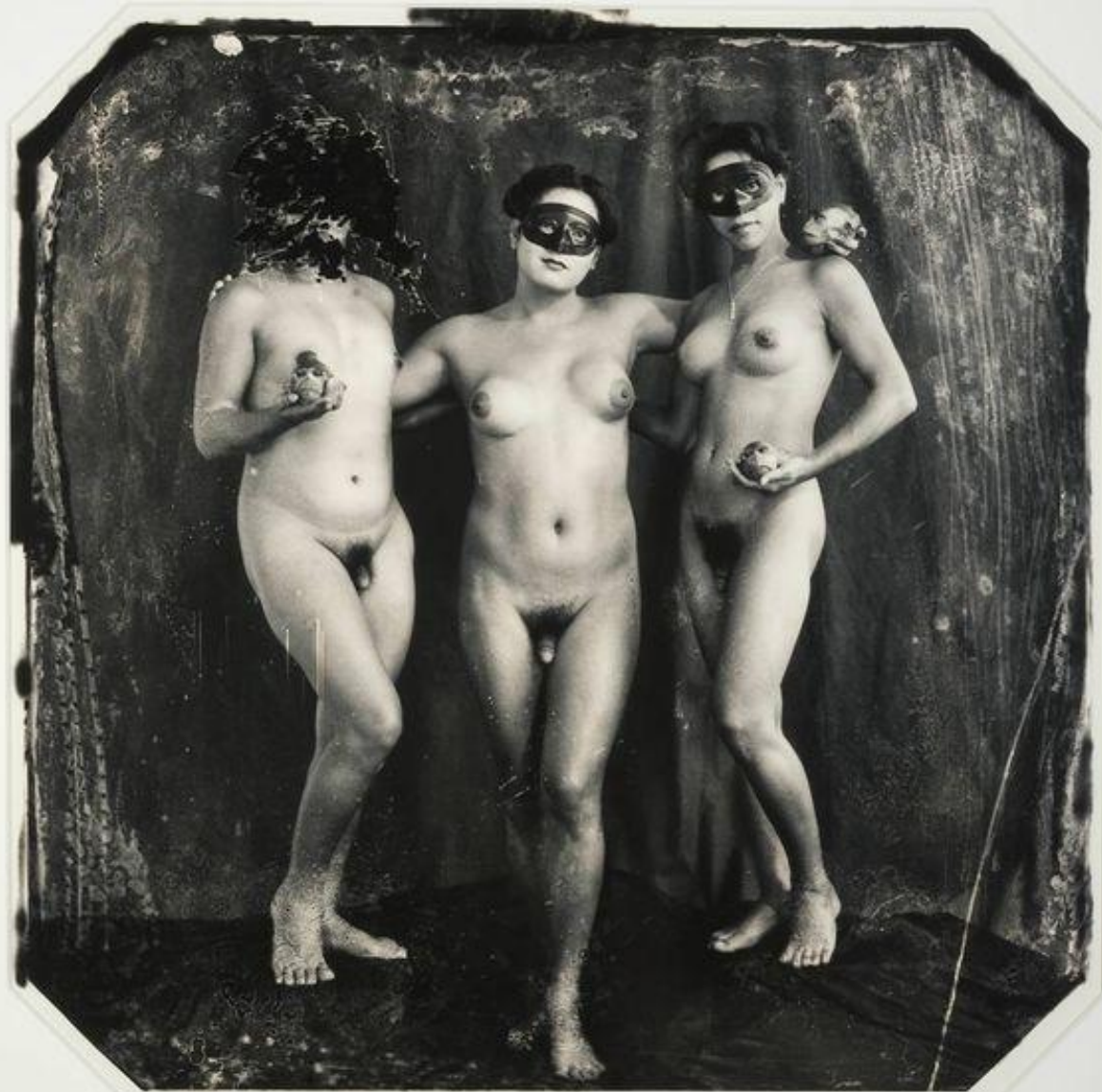
Три грации, 1988