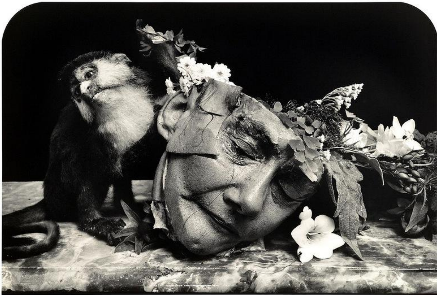
Натюрморт с обезьяной