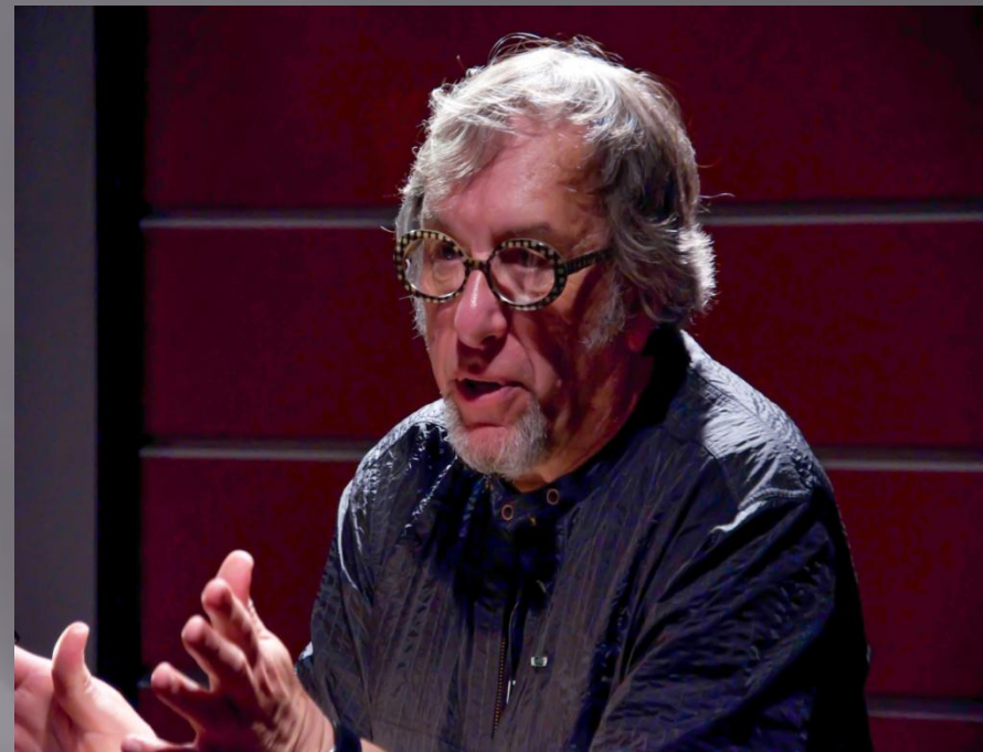
Джоэль-Питер УИТКИН (Joel-Peter Witkin) (р. 1939, Нью-Йорк)