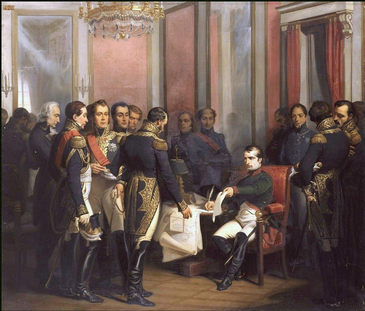
«Отречение Наполеона» Франсуа Бушо