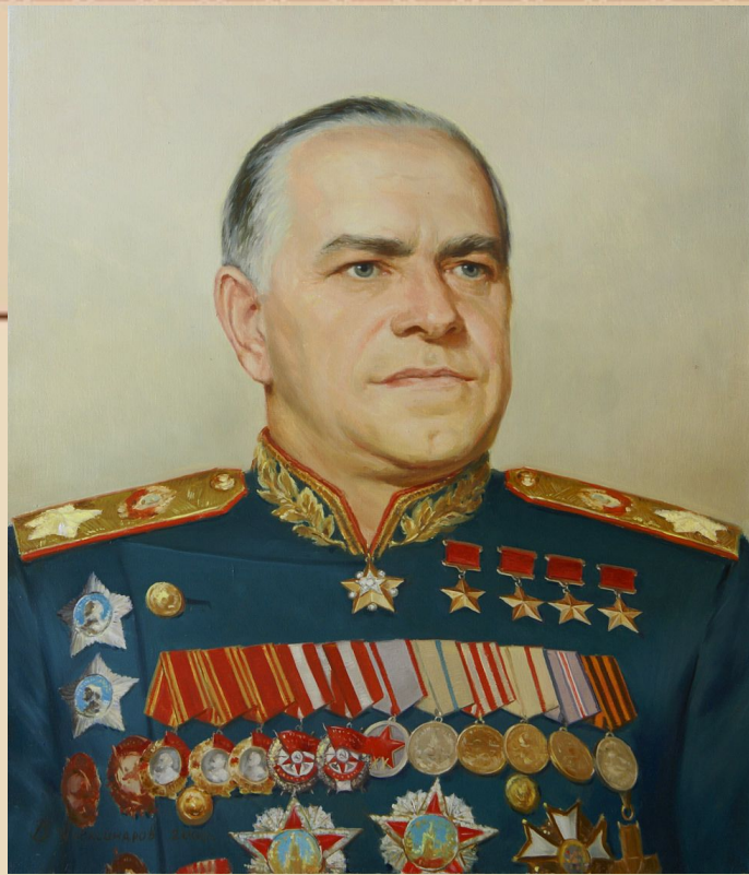
Жуков Георгий Константинович