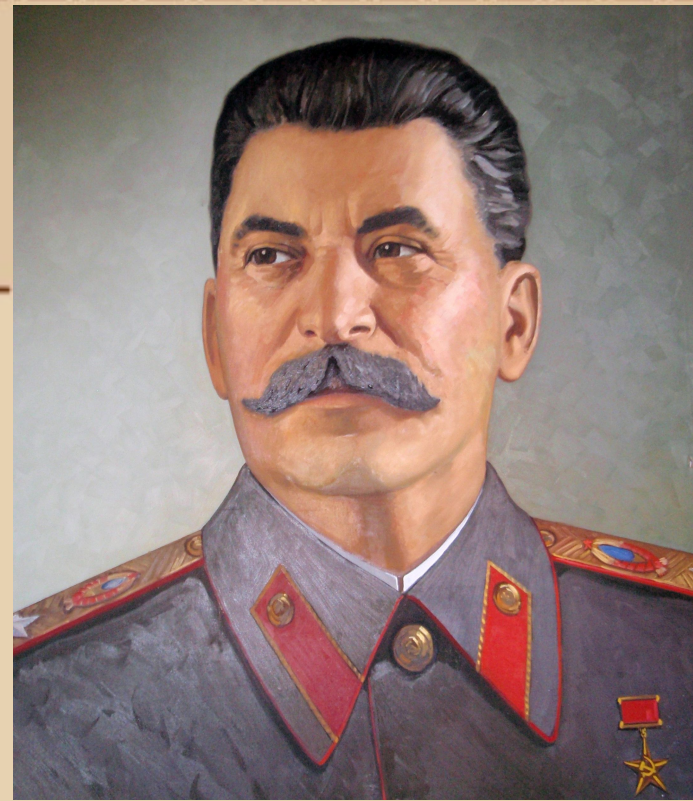
Сталин Иосиф Виссарионович