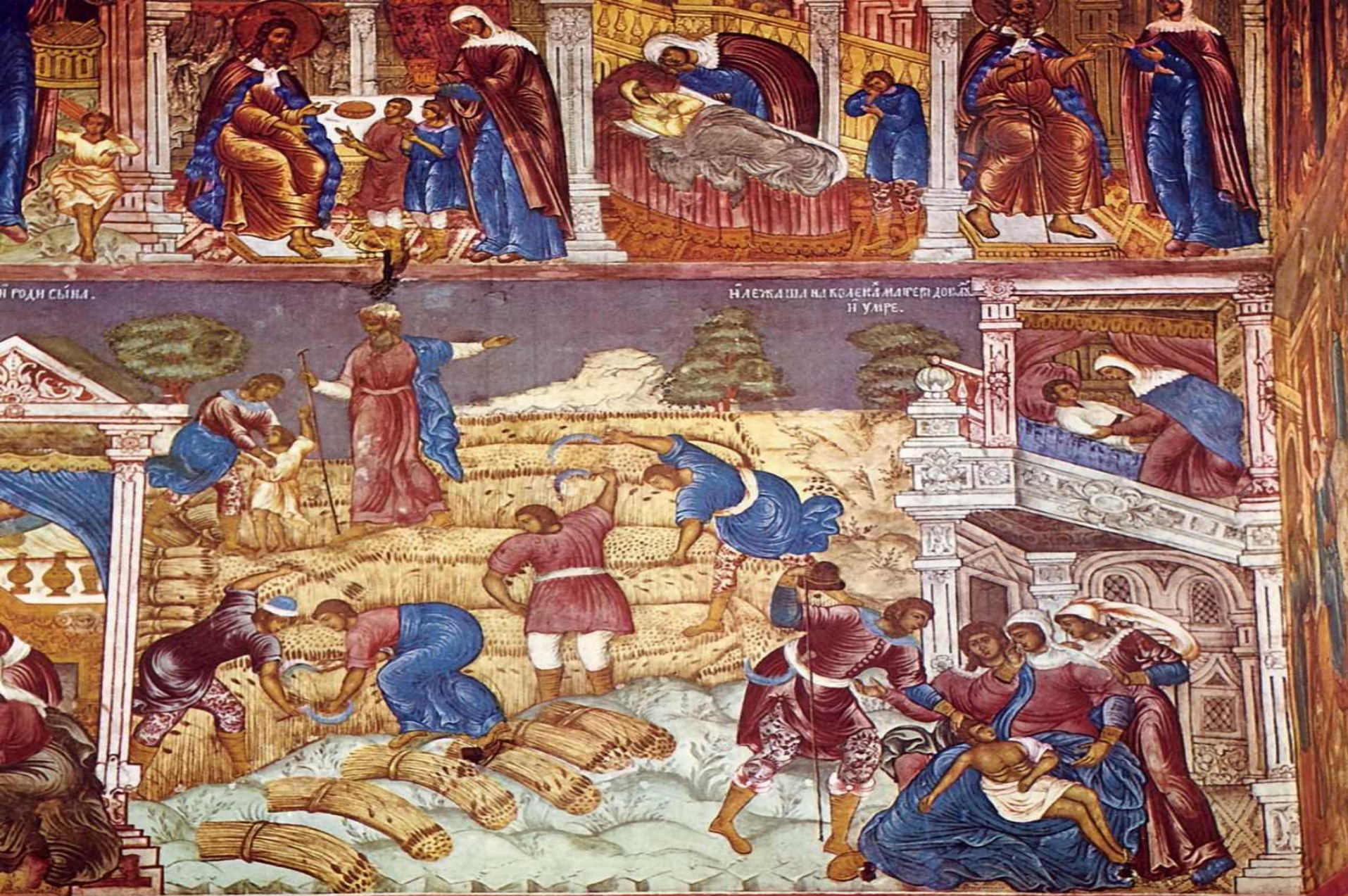
Ярославль. Ц Ільи Пророка. Фреска Житие Ильи Пророка и Житие Елисея. ЖАТВА (художники - Гурий Никитин и Сила Савин) 1680-81