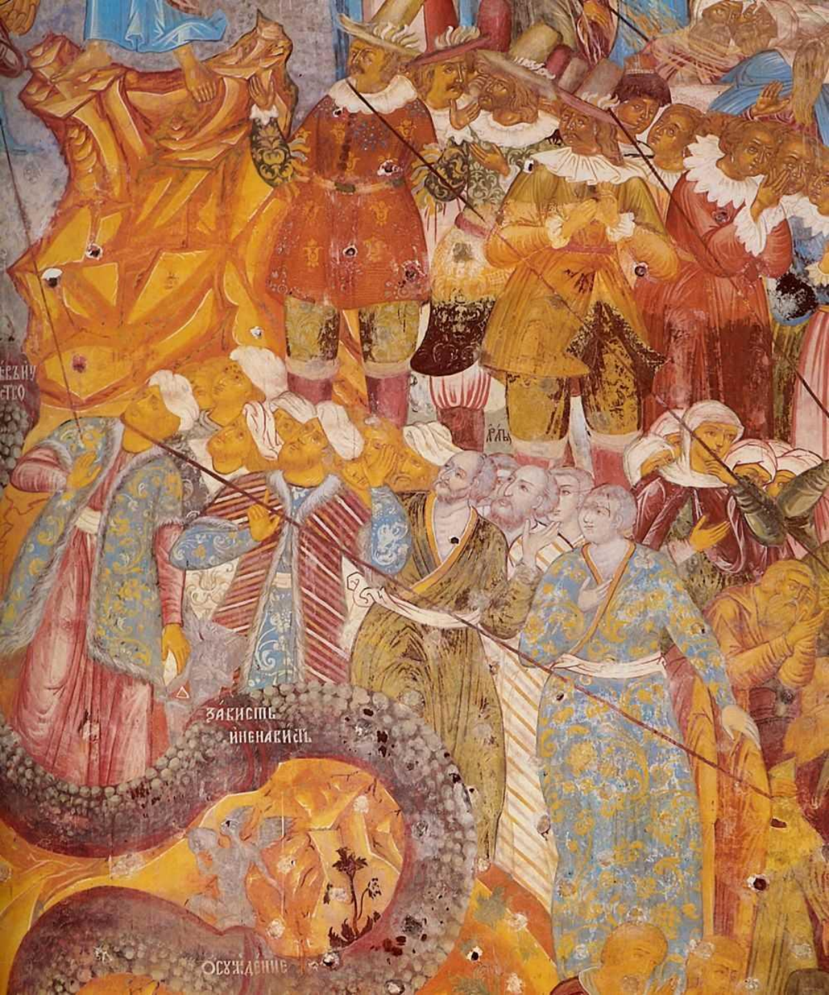
Ростов Великий. Ц Спаса Преображения на снях. Фреска «Страшный суд» (Иноверцы) 1675