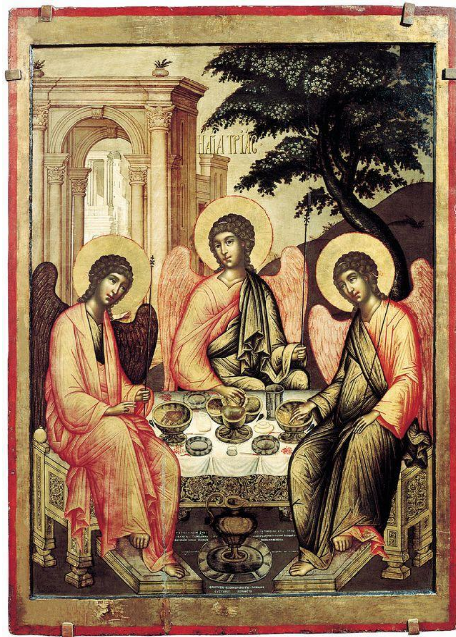
Симон Ушаков Святая Троица 1671 ГРМ