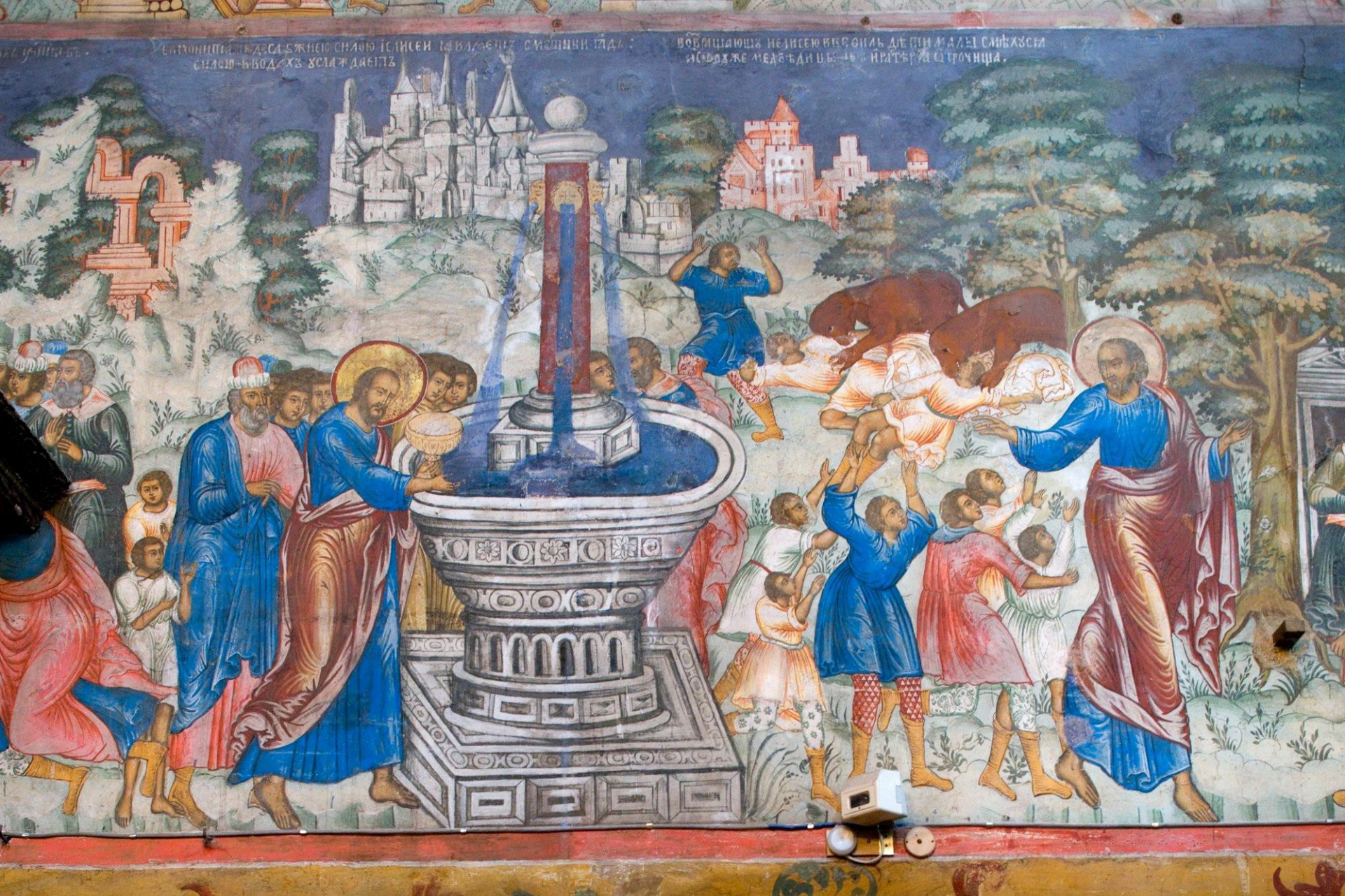
Ярославль. Ц Ильи Пророка. Фреска «Житие Елисея».