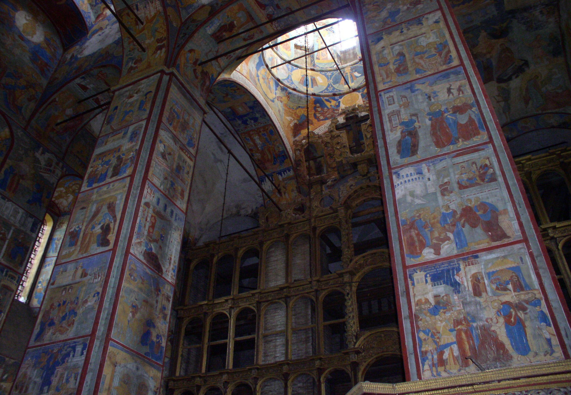
Ярославль. Ц Ильи Пророка. Интерьер