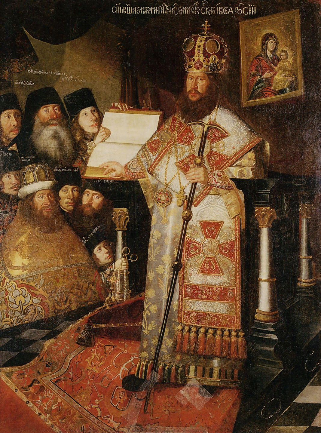
Парсуна Патриарх Никон с братией Воскресенского Новоиерусалимского монастыря 1660-65 М Новый Иеруалим Холст, масло