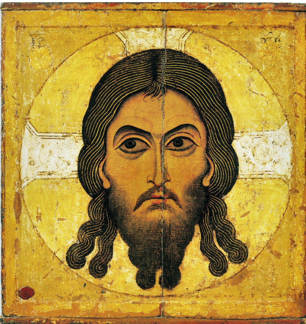
Неизвестный мастер Спас Нерукотворный 1150-1200 ГТГ