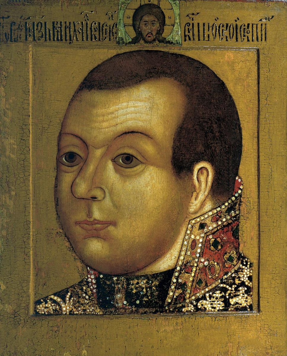
Парсуна Михаил Скопин-Шуйский