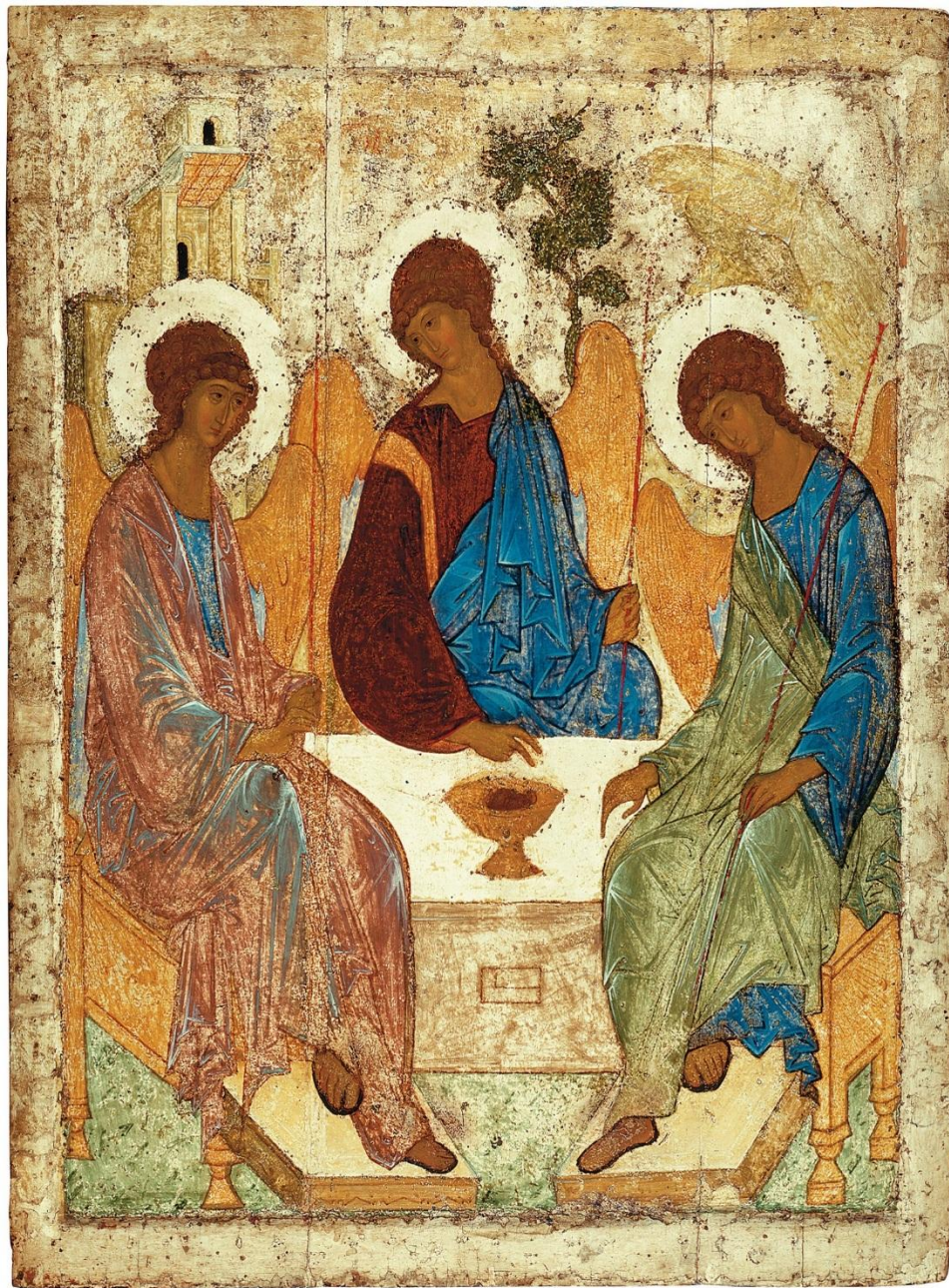
Андрей Рублев Святая Троица 1425 ГТГ