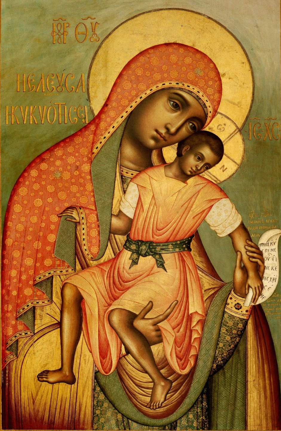
Ушаков Богоматерь Кикская 1668 ГТГ