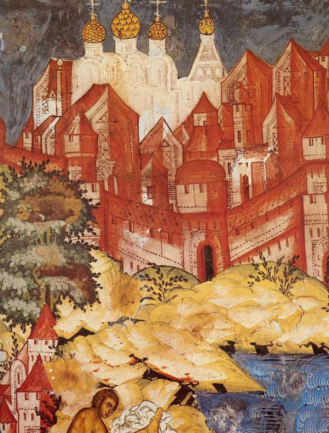
Ярославль. Ц Ильи Пророка. Фреска «Чудо Ильи Пророка в Нижнем Новгороде»