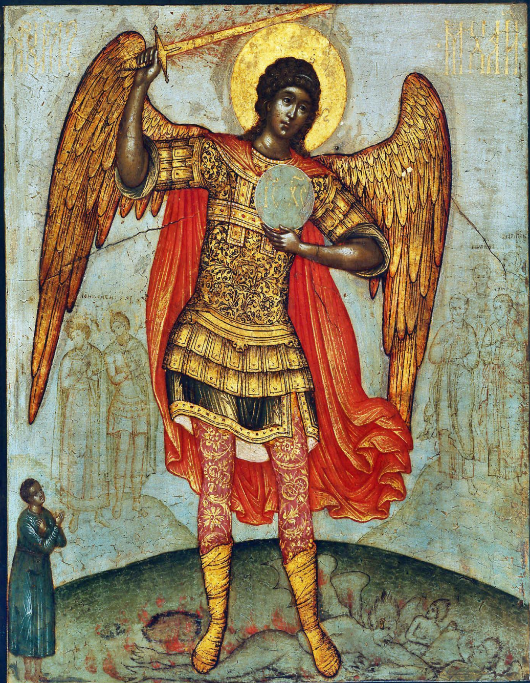
Ушаков Архангел Михаил попирающий дьявола 1676 ГТГ