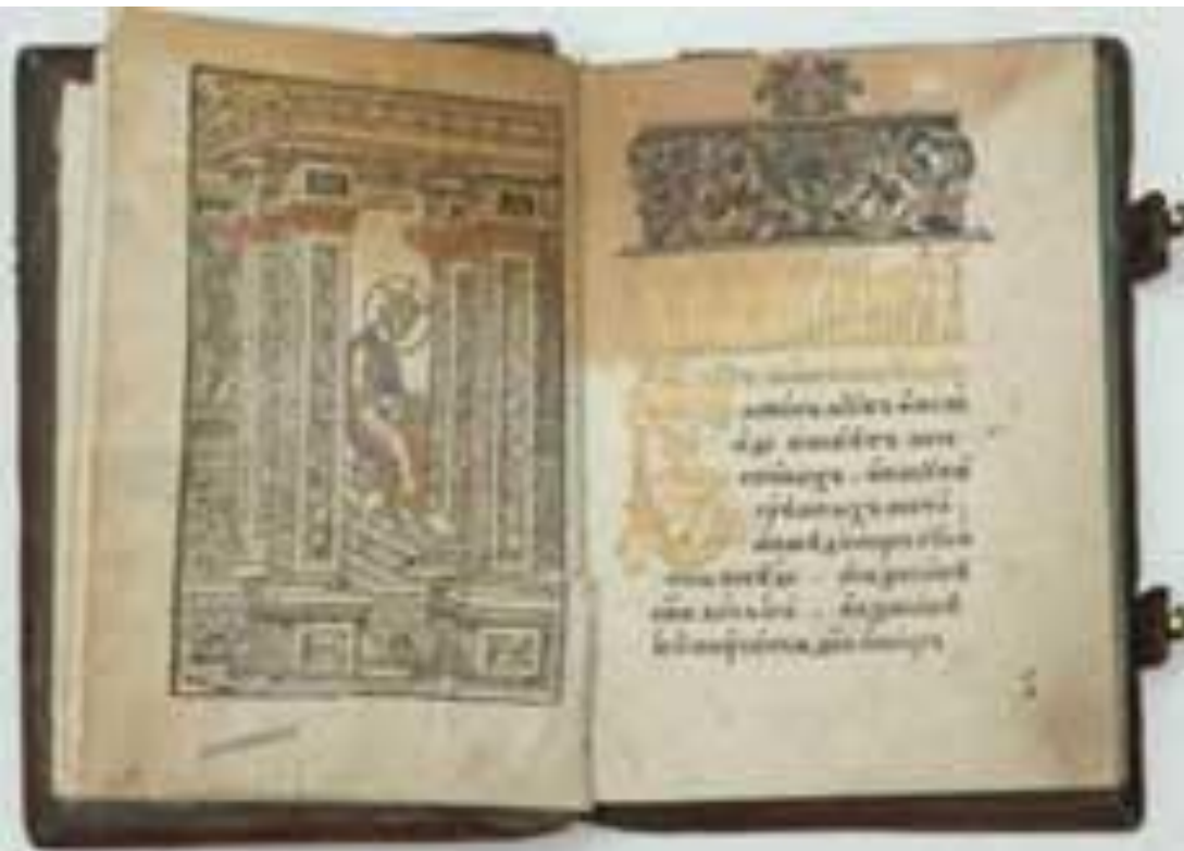
Псалтырь. Москва, 1568 г. Издание Невежи Тимофеева и Никифора Тарасиева.

После отъезда Ивана Федорова книгопечатание в Москве продолжалось.