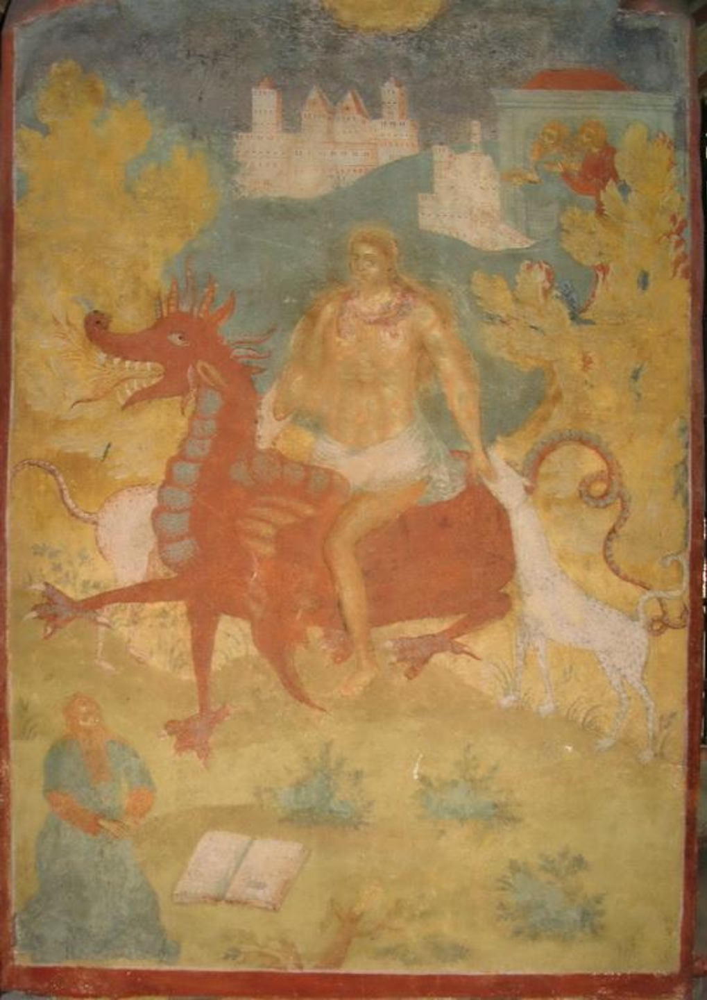
Ярославль. Ц Усекновения главы Иоанна Предтечи в Толчкове. Фреска «Видения Иоанна Богослова»