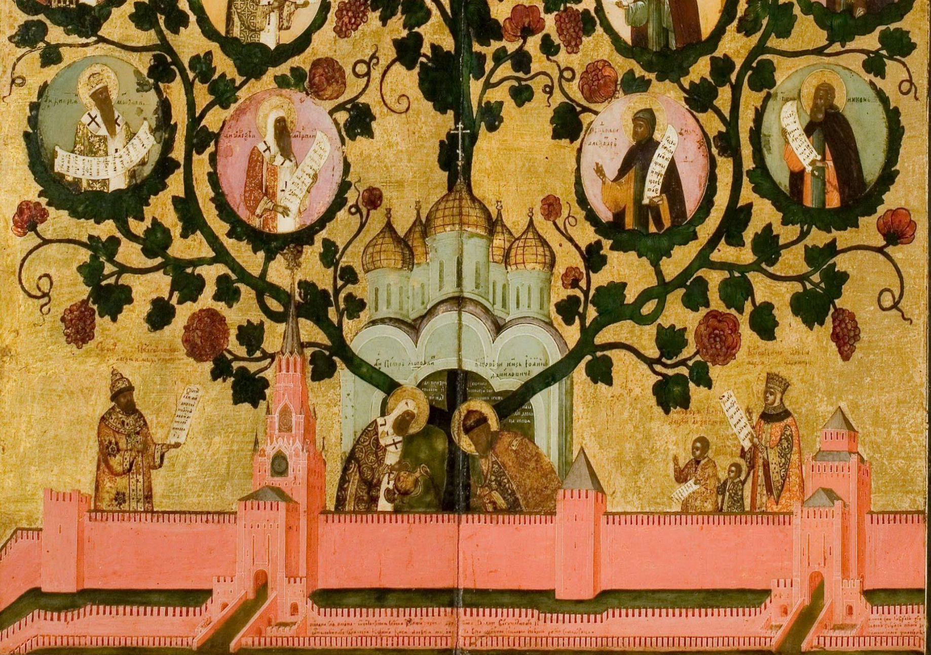
Ушаков «Насаждение древа Государства Российского» (Похвала Богоматери Владимирской) 1668 ГТГ