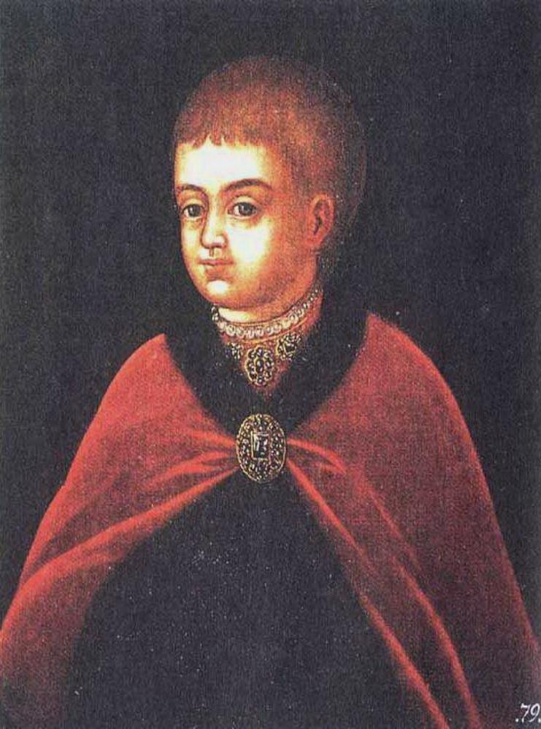
Парсуна Молодой Петр I