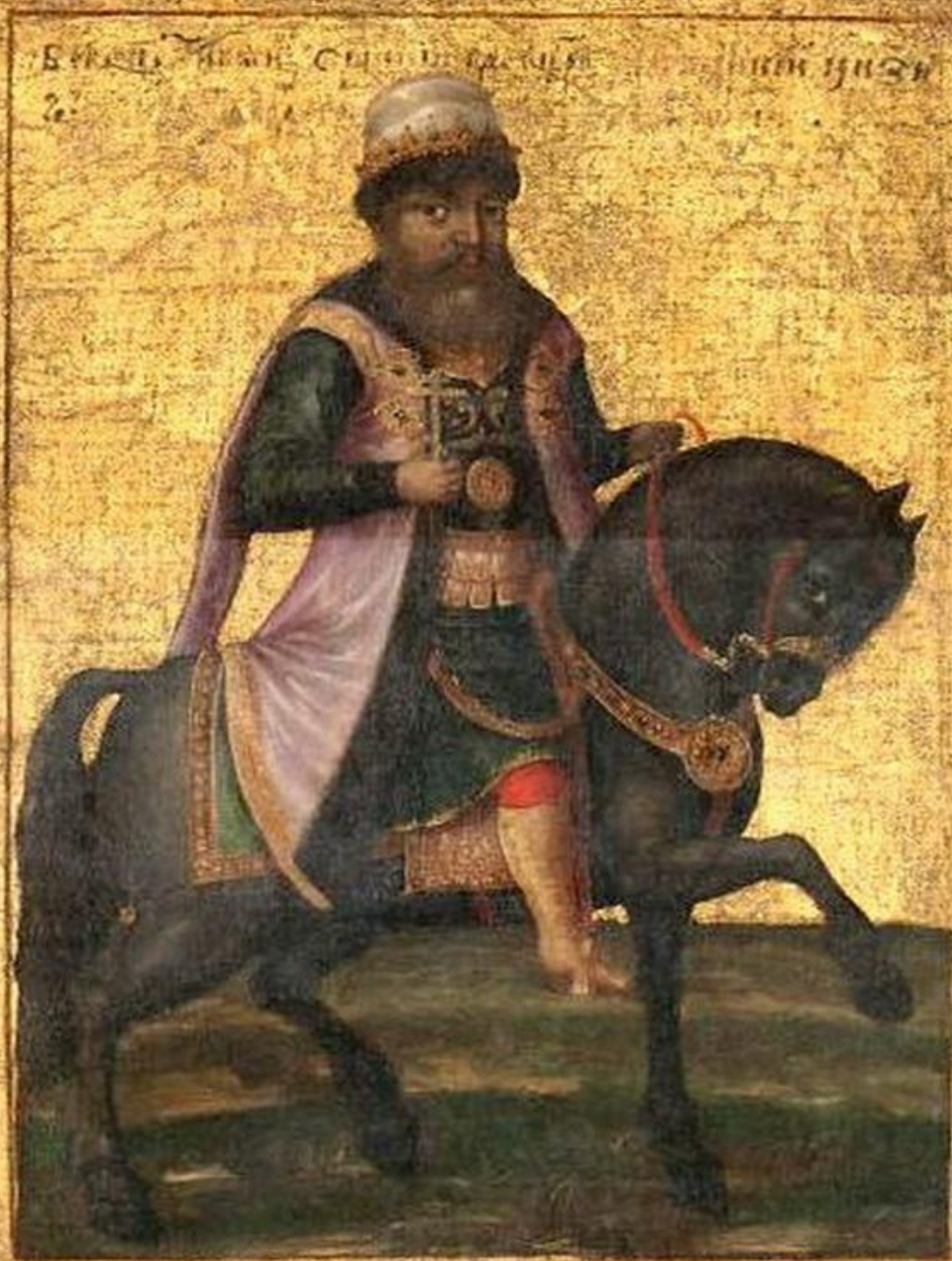
Парсуна Михаил Федорович Романов на лошади 1670-е Оружейная палата