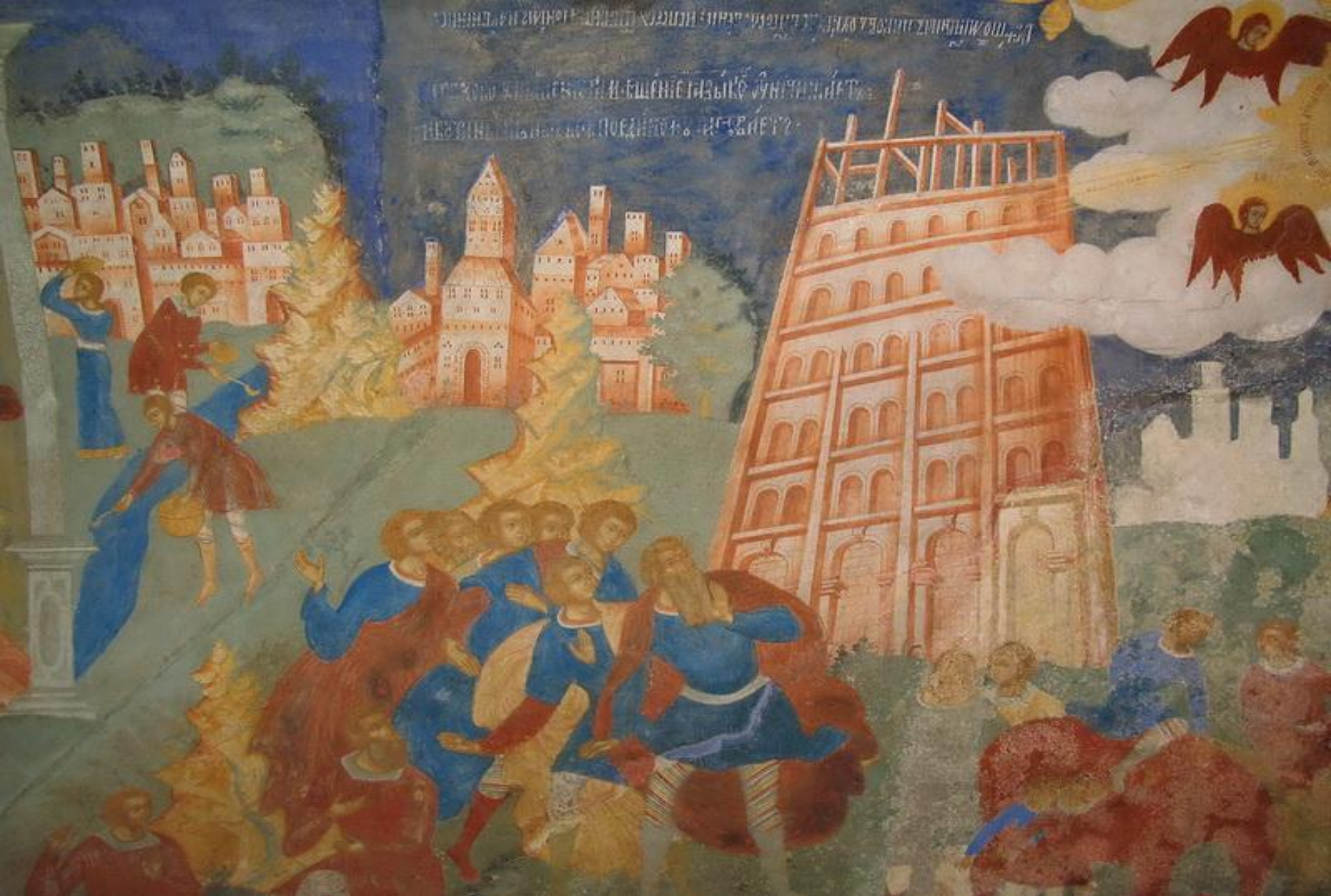
Ярославль. Ц Усекновения главы Иоанна Предтечи в Толчкове. Фреска «Вавилонская башня»