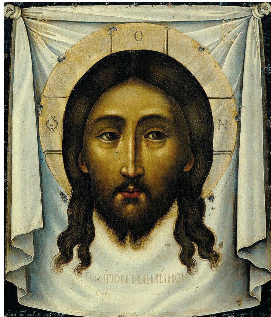
Симон Ушаков Спас Нерукотворный 1658 ГТГ