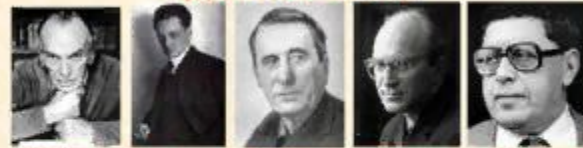
Константин Паустовский, Юрий Тынянов, Вячеслав Кондратьев, Юрий Казаков, Юрий Трифонов

• Прозаики: Константин Паустовский, Юрий Тынянов, Вячеслав Кондратьев, Эммануил Казакевич, Юрий Казаков, Юрий Трифонов.