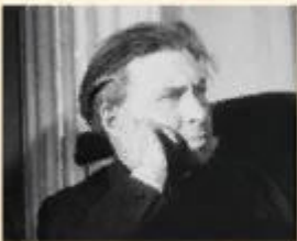
Илья Григорьевич Эренбург

• Именно в «Знамени» была напечатана повесть Ильи Эренбурга «Оттепель», давшая название целой эпохе.