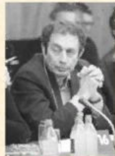
Григорий Явковлевич Бакланов

• Во время Перестройки «Знамя» стало одним из самых популярных литературных журналов. Сергей Чупринин писал: • «... в журнал пришёл новый главный редактор Григорий Бакланов — писатель фронтového поколения, который сделал журнал таким, какой он сейчас. Тогда журнал стал, как тогда выражались, «флагом перестройки»».