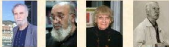
Владимир Маканин Евгений Попов Людмила Петрушевская Михаил Кураев