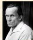
Андрей Платонов Михаил Булгаков Евгений Замятин Варлам Шаламов