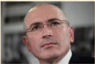
Михаил Ходорковский на первой пресс-конференции после освобождения из заключения, 22 декабря 2013, Берлин