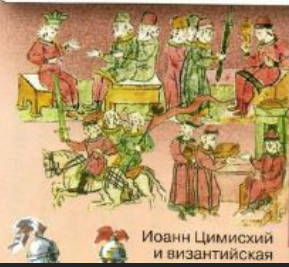
Миниатюра. Дары греков князю Святославу

Набеги кочевников во второй половине X в. печенегов торков половцев