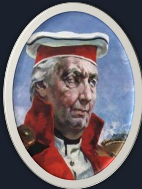
Ларион Матвеевич Голенищев - Кутузов