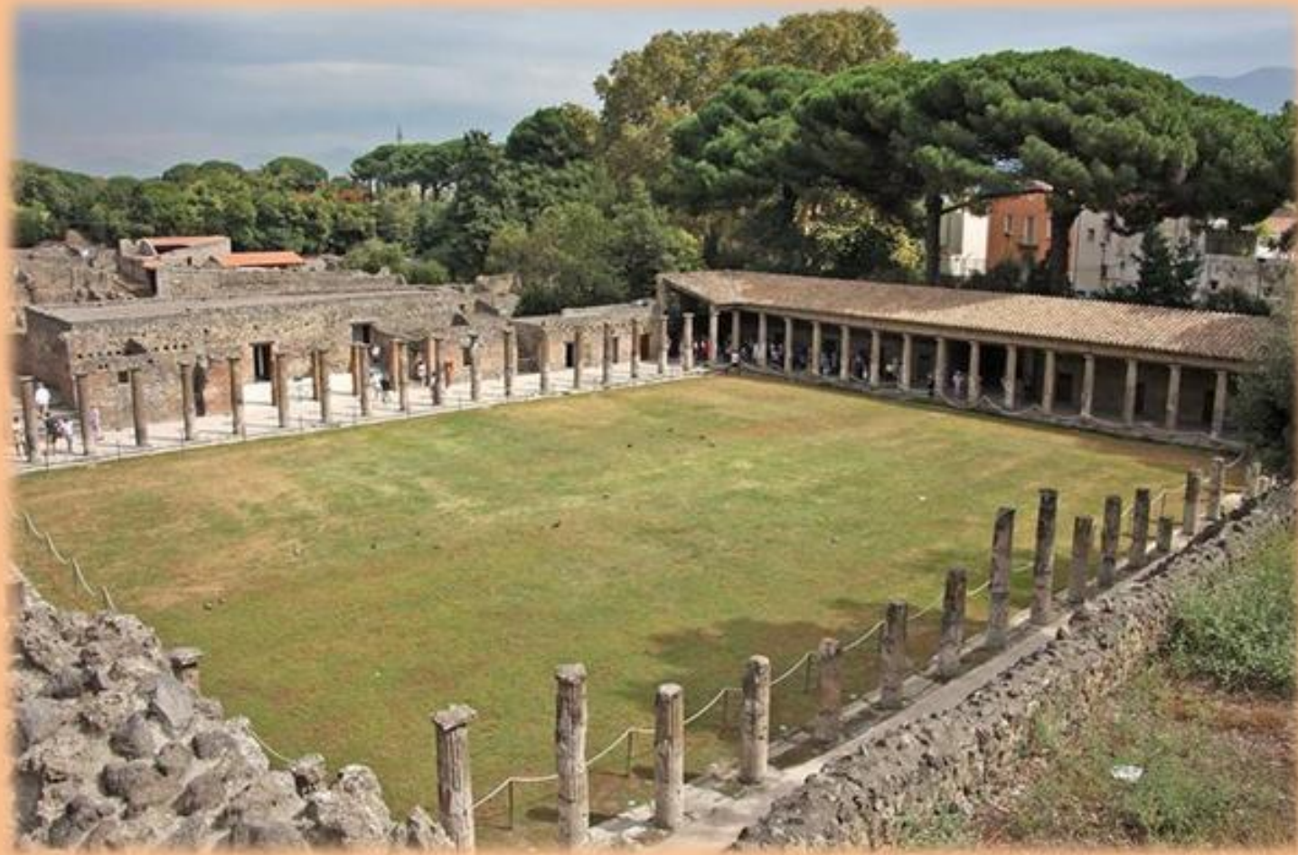
Палестра в г. Помпеи

ПАЛЕСТРА – школа, где занимались гимнастикой: борьбой, бегом, прыжками, метанием копья и диска.