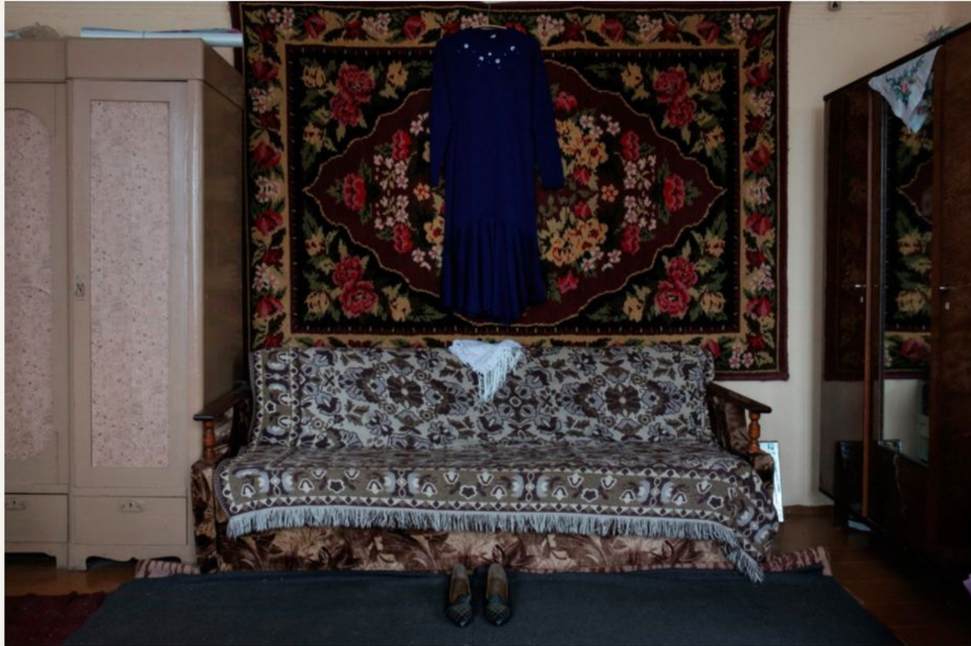
Похоронное платье и туфли Веры