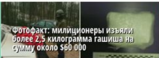
Фотофакт: милиционеры изъяли более 2,5 килограмма гашиша на сумму около $60 000