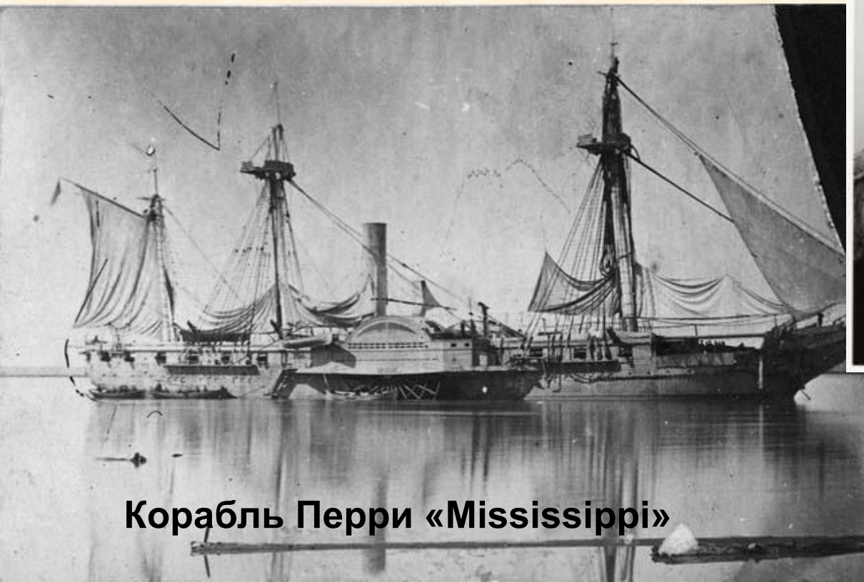
Корабль Перри «Mississippi»

«Пароходы Нарушили безмятежный сон Тихого океана, Всего четыре корабля достаточно, Чтоб мы не спали ночью»