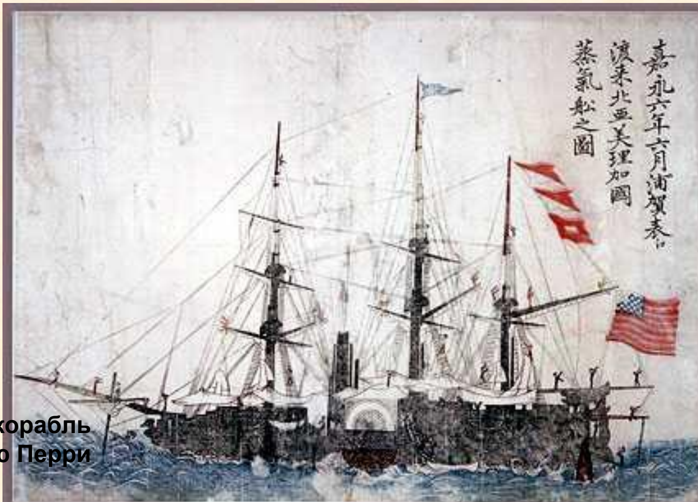
«Черный» корабль Мэтью Перри