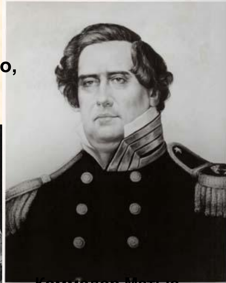
Коммодор Мэтью Кэлбрейт Перри (1794-1858)