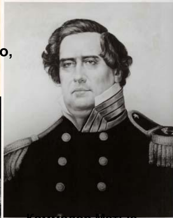
Коммодор Мэтью Кэлбрейт Перри (1794-1858)