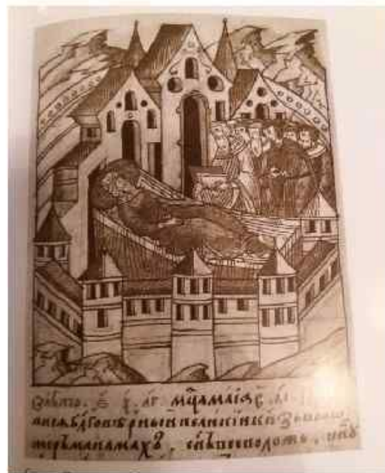
Смерть Владимира Мономаха. Миниатюра Лицевого летописного свода.