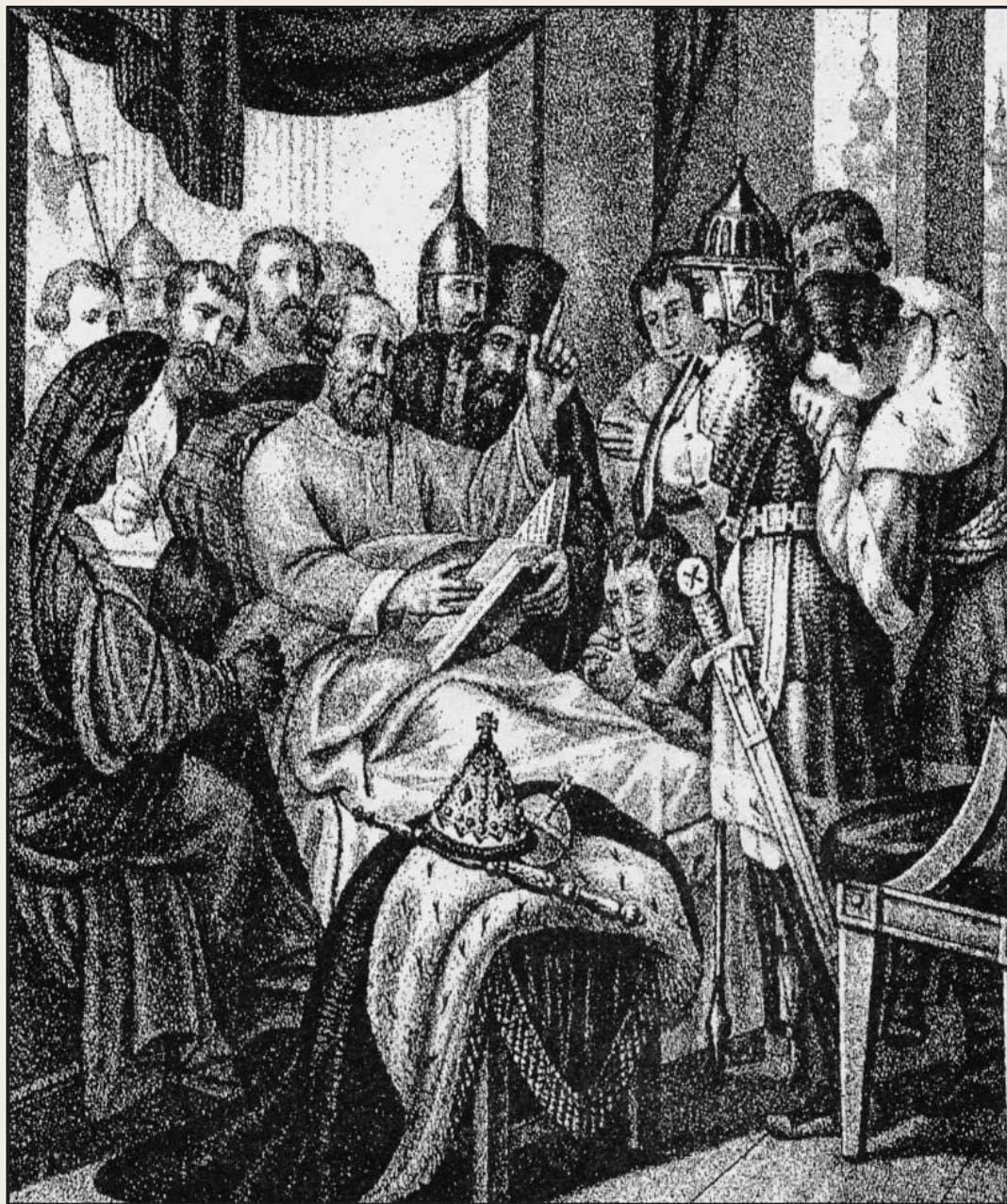
Завешание Владимира Мономаха. Гравюра