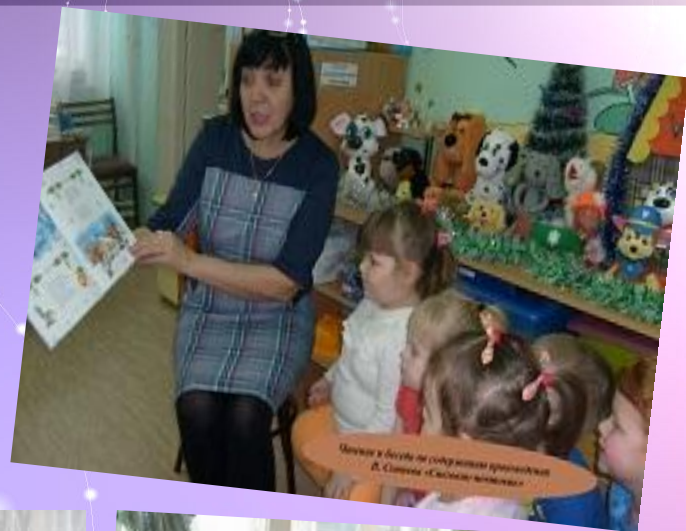
Чтение в группе на тему «Новый год» в МБОУ «Средняя школа №1»