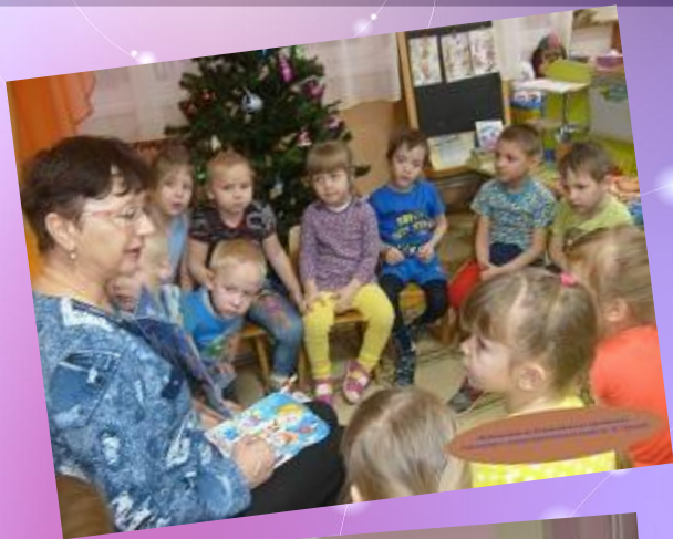
Чтение в группе на тему «Новый год»