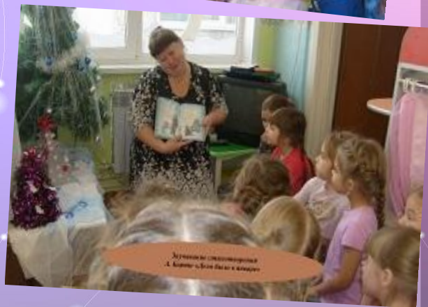
Чтение в группе на тему «Новый год» в МБОУ «Средняя школа №1»