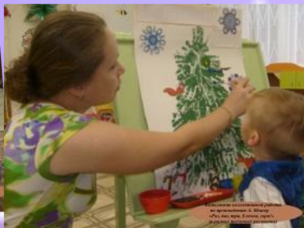
Участники на занятии рисования на тему «Новый год» в МБОУ «Средняя школа №1»