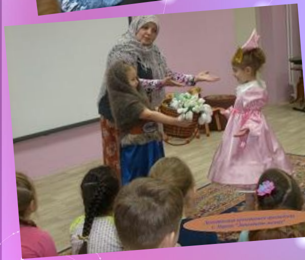
Участники представления «Снежинки» в МБОУ «Средняя школа №1»