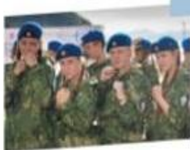
Курсанты военно-патриотического центра «Вымпел»