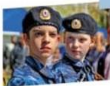
Юные друзья полиции