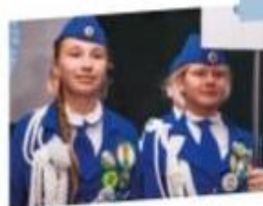
Юные инспектора движения