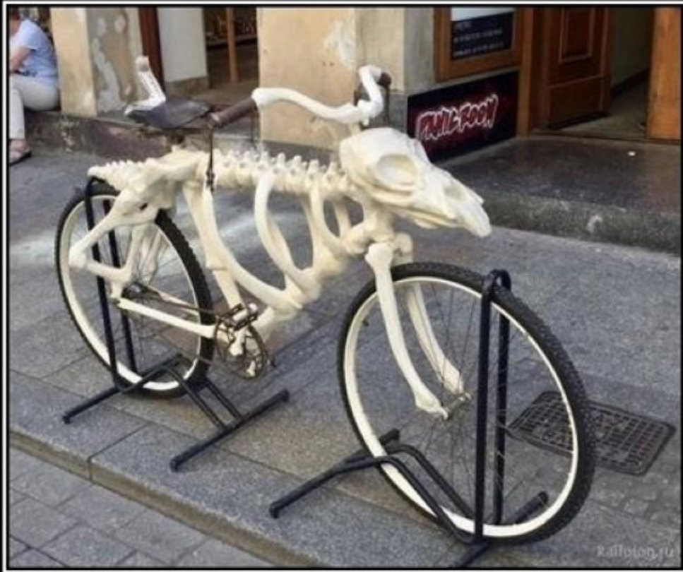
Победитель велогонки на 1000 км