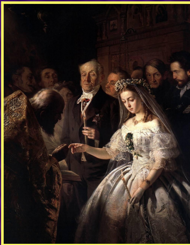
"Неравный брак" Пукирев