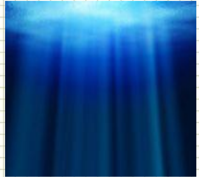
Филиппинская впадина – в Тихом океане. Максимальная глубина 10 540 м.