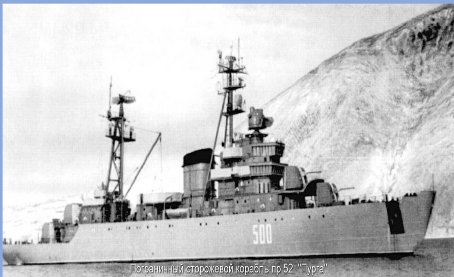
Пограничный сторожевой корабль пр 52. "Пурга"