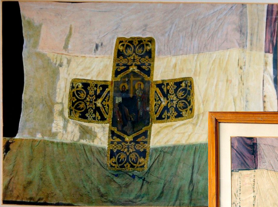
Силарско знаме Гориста, Силара, 1927 г.