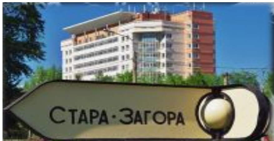
Г. Самара улица Стара-Загора