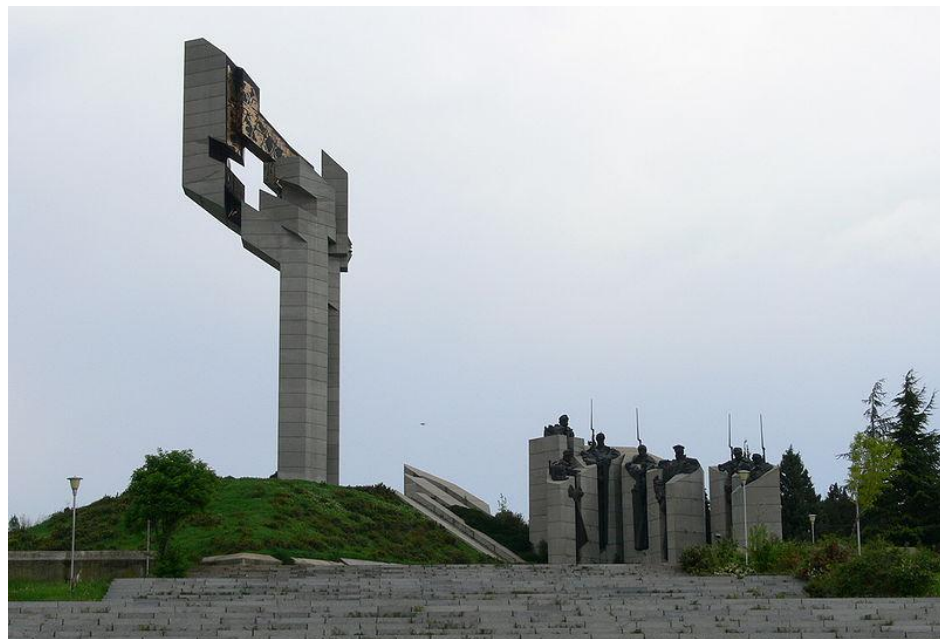
Мемориал Самарского знамени в г. Стара-Загоре