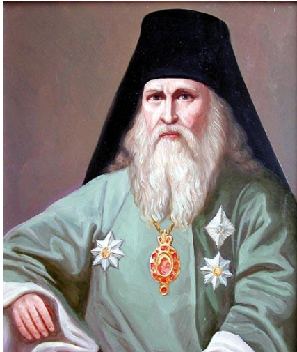
Епископ Герасим (Добросердов)