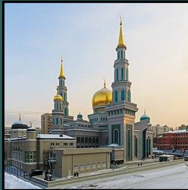
Московская соборная мечеть