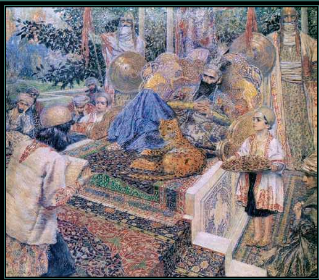
Фирдоуси читает «Шахнамэ» султану Махмуду. Художник В. Суреньяни

Особых успехов достигла поэзия в Иране и Средней Азии; здесь поэты писали произведения обычно на таджикско-персидском языке — фарси .