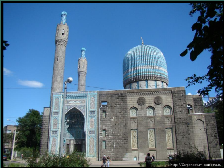
Соборная мечеть. г. Санкт - Петербург