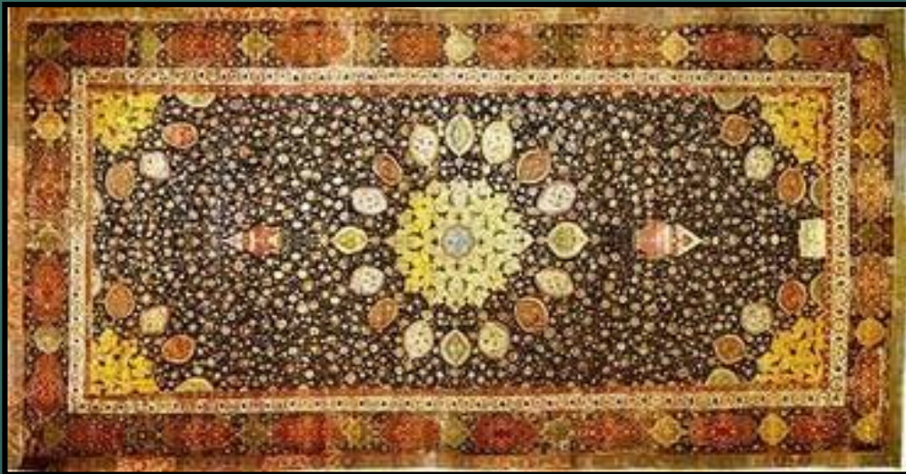
Ковёр «Шейх - Сафи» XVI век

В искусстве орнамента мусульманские народы достигли больших высот.