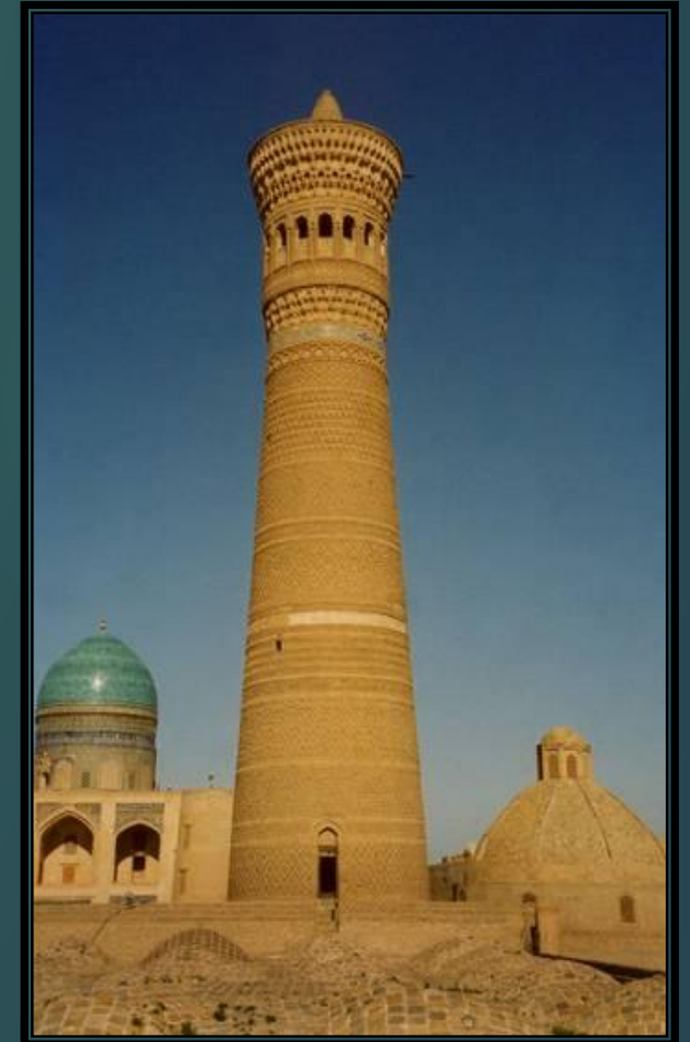
Вид минарета с крыши мечети Пой-Калян.

Здание мечети всегда можно узнать издалека по возвышающимся башням — минаретам. Слово «минарет» в переводе с арабского означает «маяк». Верхняя часть минарета действительно очень похожа на фонарь маяка. Предание рассказывает, что Мухаммад предписал специальным глашатаям (муэдзинам) с минарета призывать верующих к молитве. Для такой работы отбирались люди, верные исламу и имеющие громкий красивый голос. В настоящее время муэдзин уже не поднимается на минарет, его голос транслируется через динамики. Купол мечети обычно сине-голубого цвета и сияет, словно яркое небо, даже в пасмурную погоду.