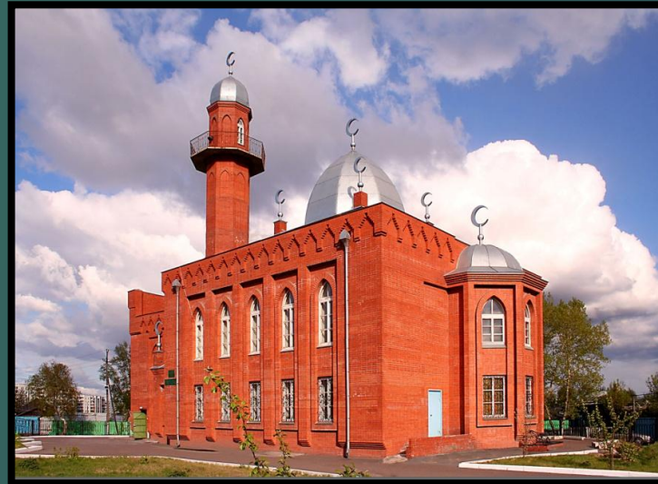
Соборная мечеть г. Красноярск