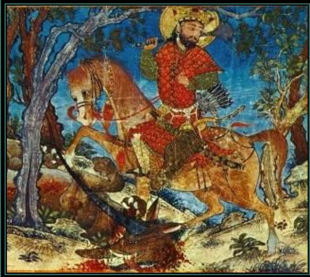
Миниатюра из «Шахнаме»