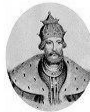
Дмитрий Переяславский (1276-1281)