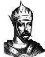
Юрий Долгорукий (1155-1157)