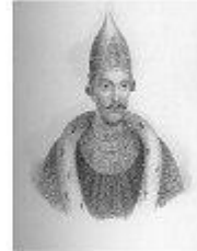
Дмитрий Грозные Очи (1322-1326)