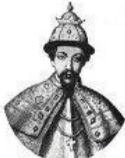
Симеон Гордый (1340-1353)