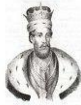
Василий Костромской (1272-1276)