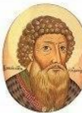
Иван Калита (1328-1340)