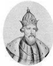
Ярослав Тверской (1263-1272)