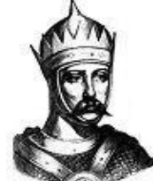
Юрий Долгорукий (1149-1151)