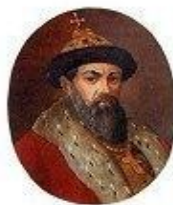
Владимир Мономах (1113-1125)