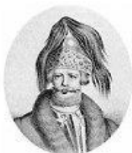
Мстислав Великий (1125-1132)