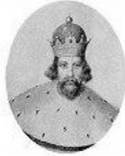
Андрей Городецкий (1294-1304)

* 1281-1294 – междоусобная война в Северо-восточной Руси