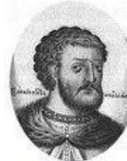
Иван Красный (1353-1359)