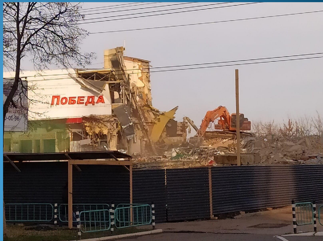
СНОС КИНОТЕАТРА «КИНОМАКС-ПОБЕДА». 2020 г.