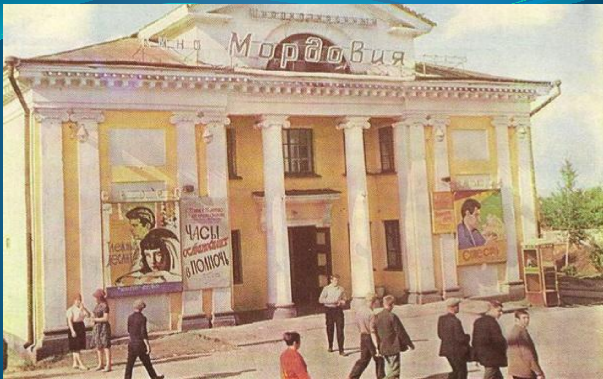
КИНОТЕАТР «МОРДОВИЯ». ОТКРЫТ В 1959 ГОДУ.