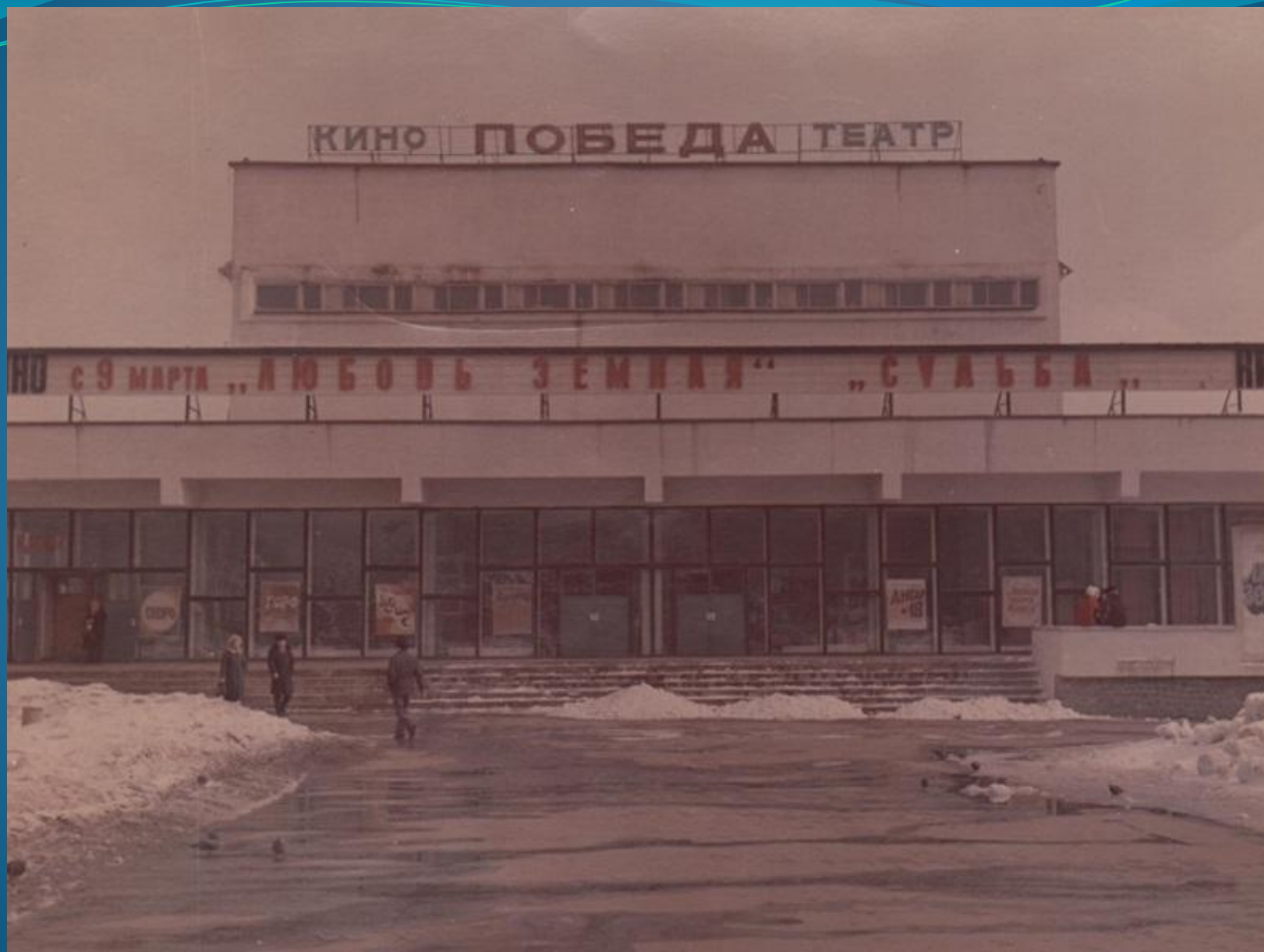
КИНОТЕАТР «ПОБЕДА». ОТКРЫТ В 1975 году.