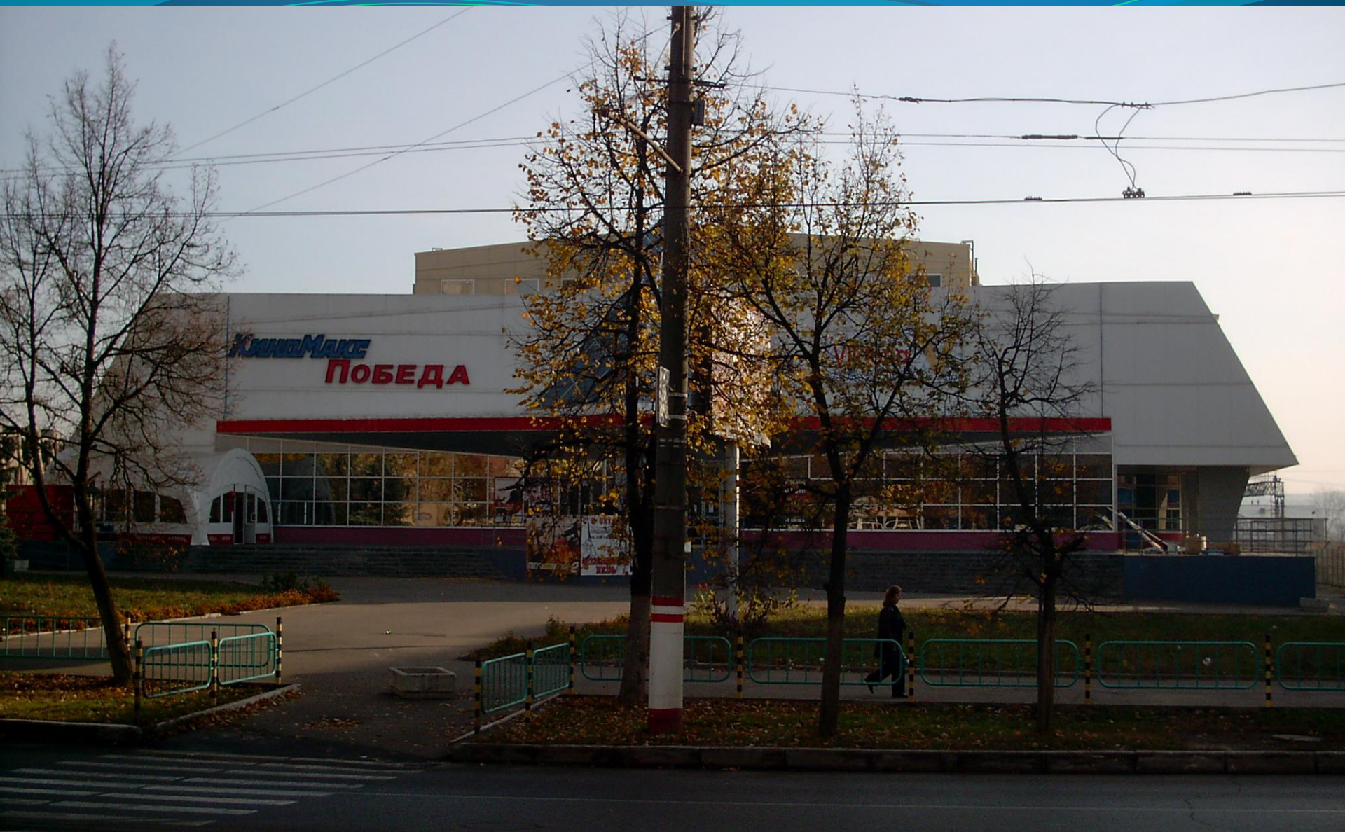
КИНОТЕАТР «КИНОМАКС-ПОБЕДА». ОТКРЫТ 9 декабря 2004 года.