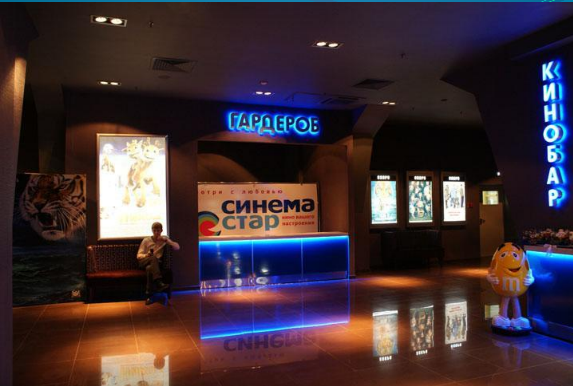
КИНОТЕАТР «СИНЕМА СТАР»