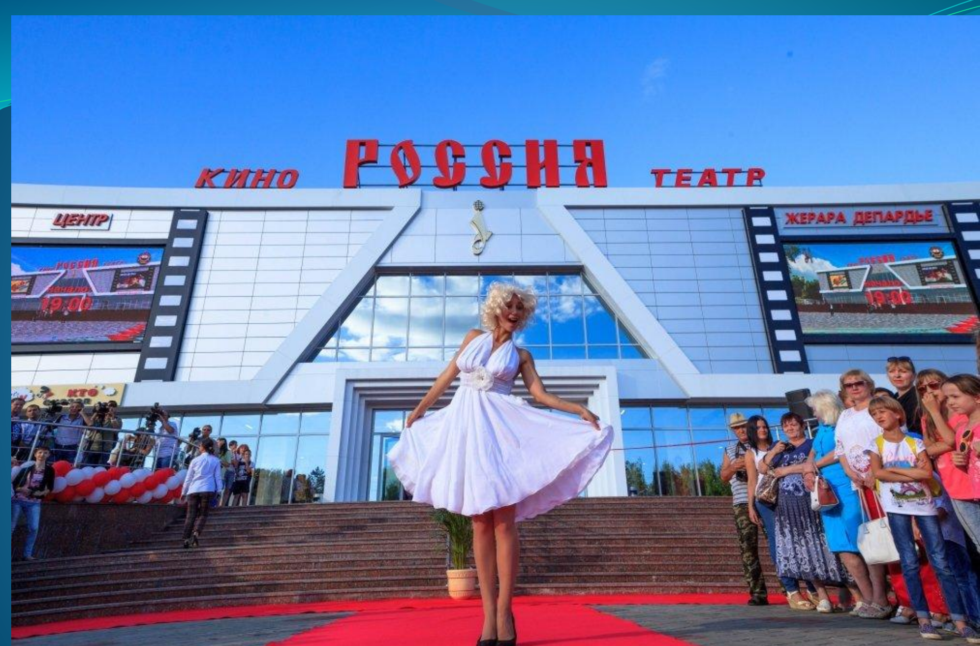
ОТКРЫТИЕ КУЛЬТУРНОГО ЦЕНТРА ЖЕРАРА ДЕПАРДЬЕ. 27 августа 2016 г.