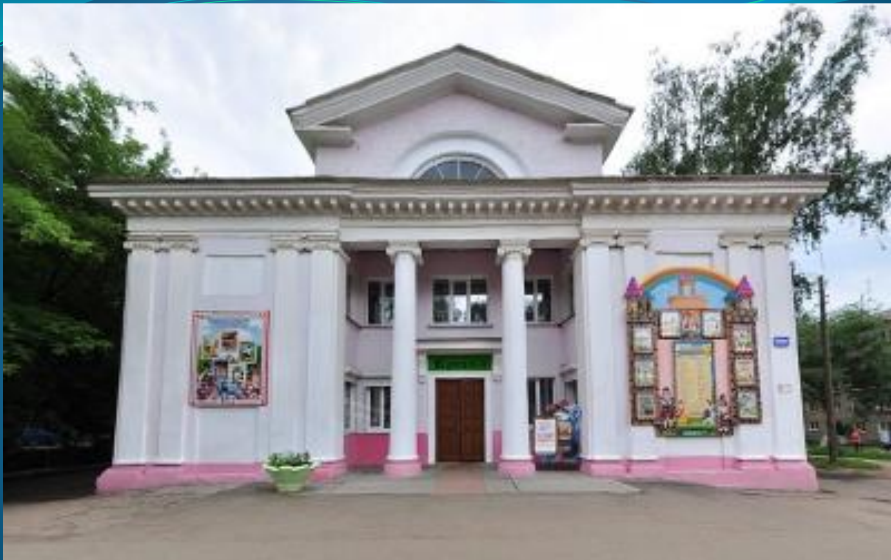
ГОРОДСКОЙ ДЕТСКИЙ ЦЕНТР ТЕАТРА И КИНО «КРОШКА»