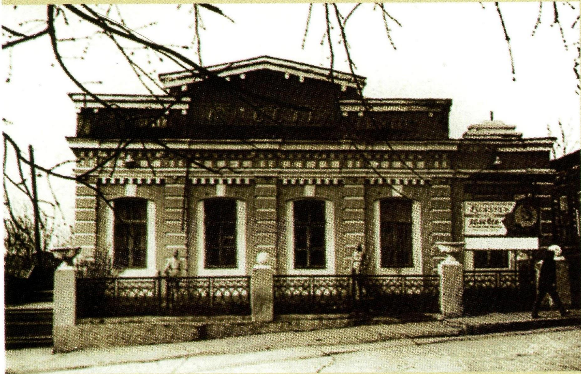
КИНОТЕАТР «ЮНОСТЬ». ОТКРЫТ В 1920 ГОДУ.