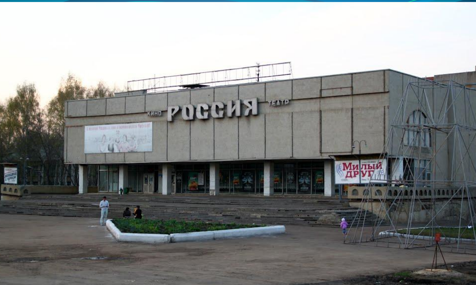
КИНОТЕАТР «РОССИЯ». ОТКРЫТ 14 февраля 1989 года.