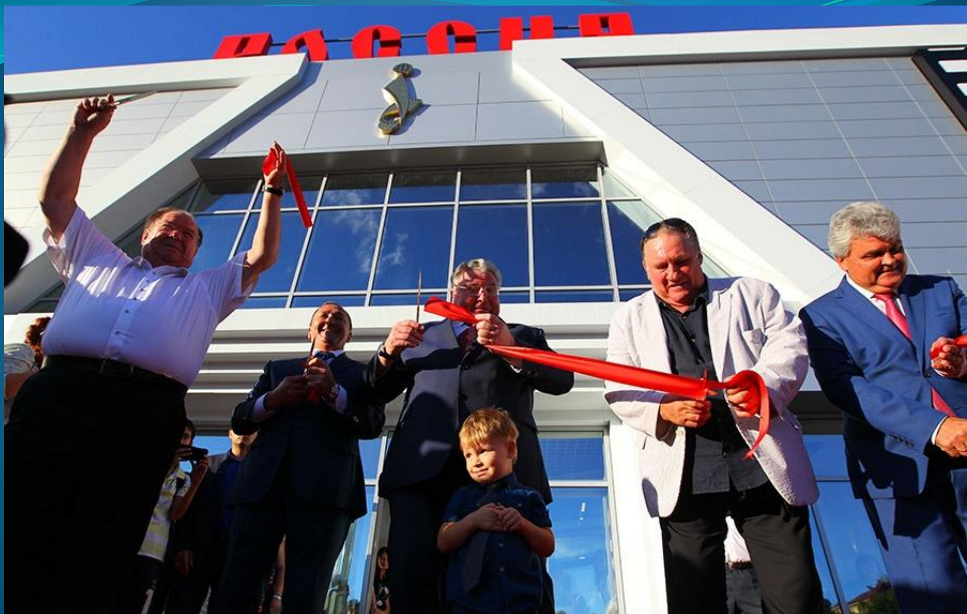
ТОРЖЕСТВЕННОЕ ОТКРЫТИЕ КУЛЬТУРНОГО ЦЕНТРА ЖЕРАРА ДЕПАРДЬЕ