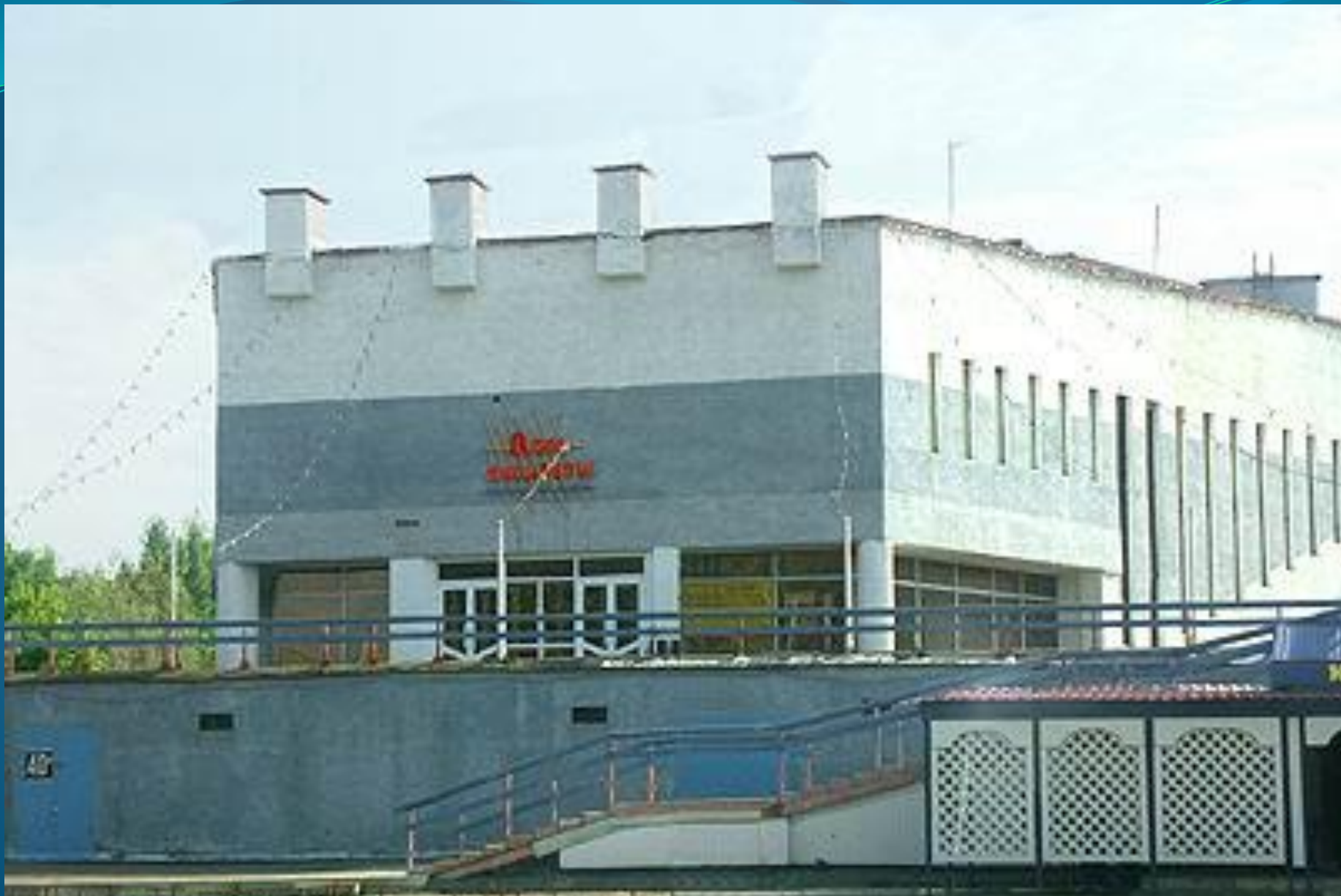
КИНОТЕАТР «ЛУЧ». ОТКРЫТ В 1982 году.