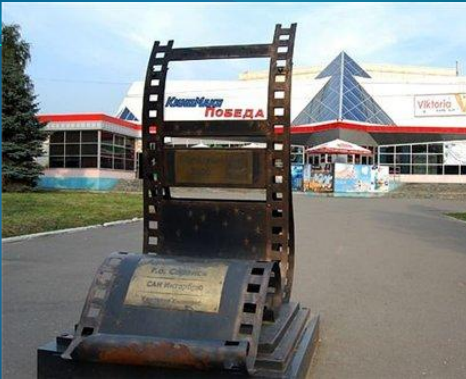
ДЕКОРАТИВНАЯ КОМПОЗИЦИЯ «КИНОКАДР». ОТКРЫТА 22 декабря 2006 года.