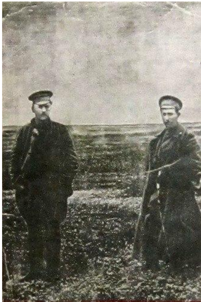
Подтелков и Кривошлыков перед казнью