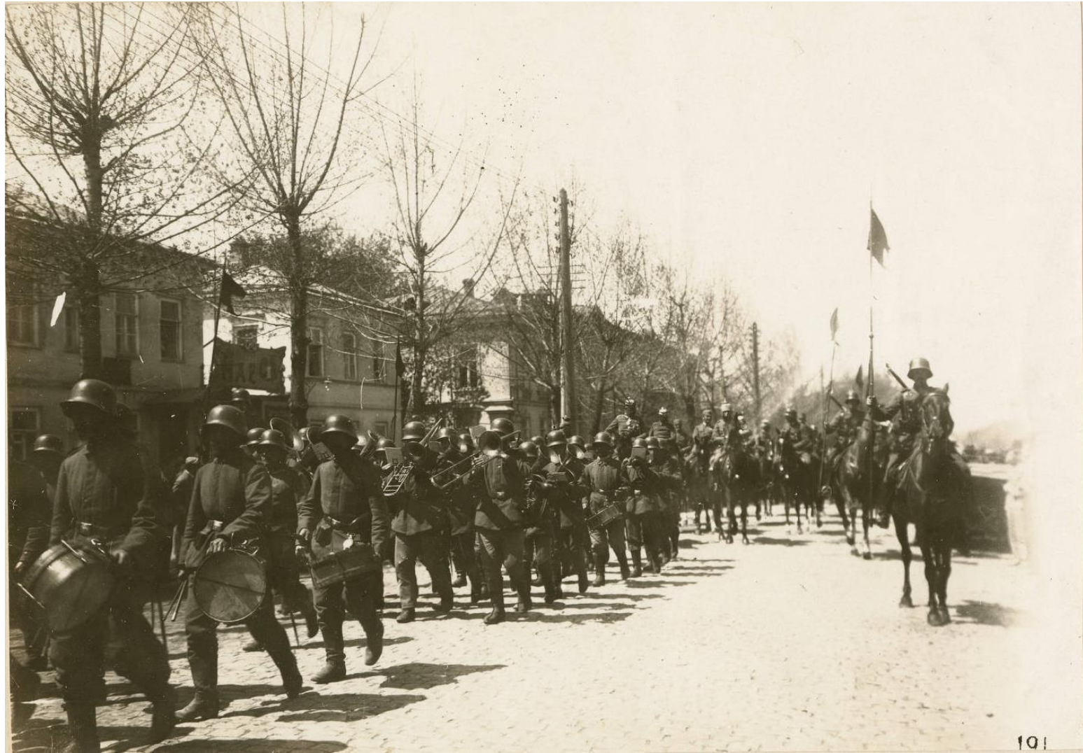
Немецкие войска в Таганроге