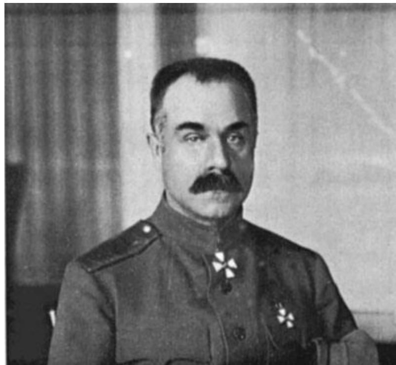
Донской войсковой атаман Алексей Максимович Каледин