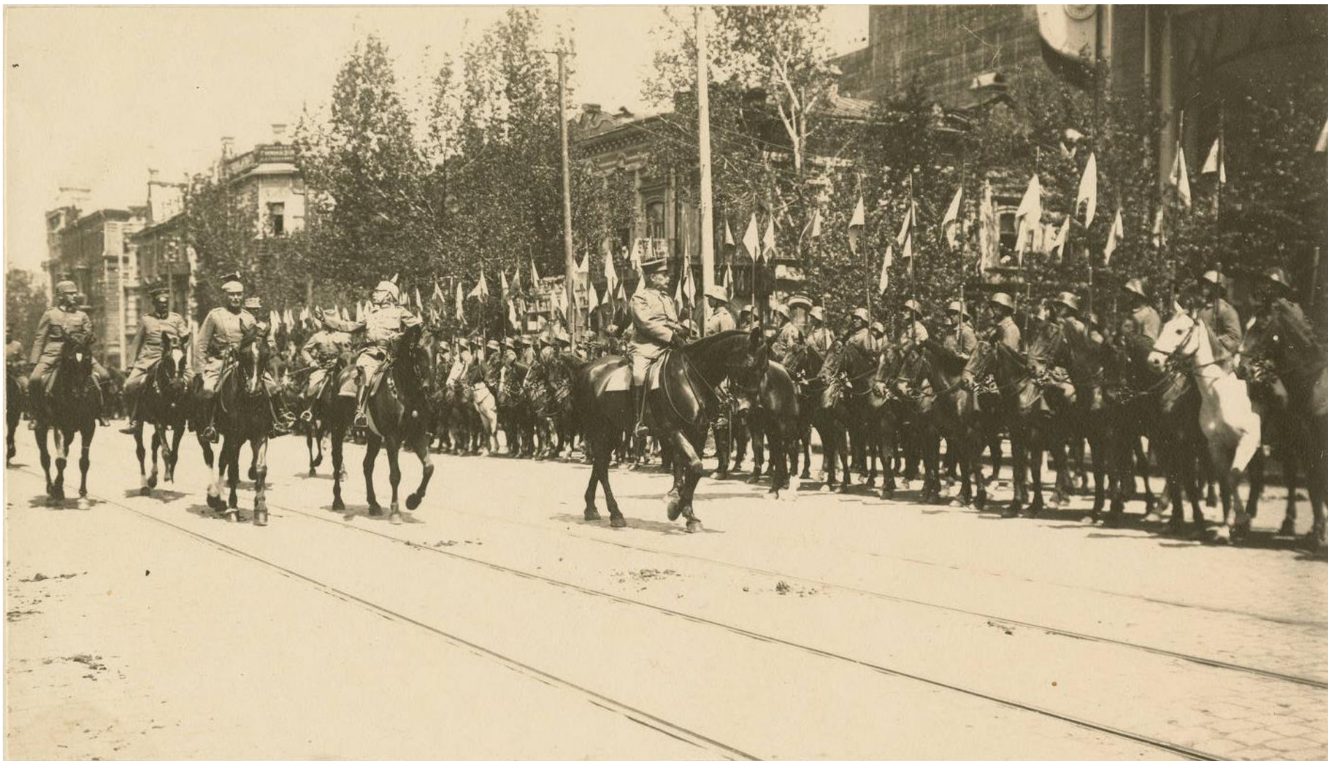
Фельдмаршал Герман фон Эйхгорн принимает немецкий парад в Ростове