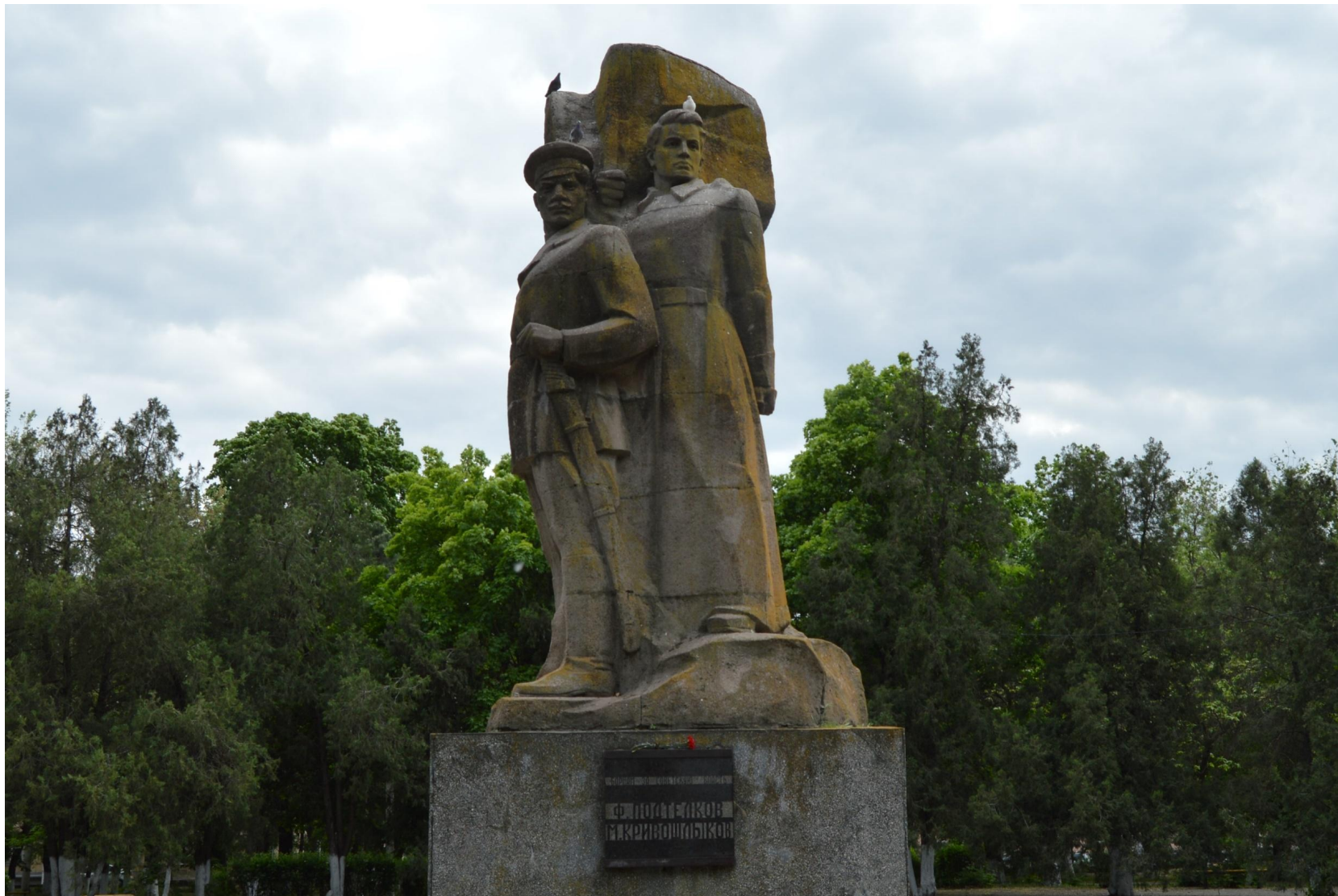
Памятник Подтелкову и Кривошлыкову