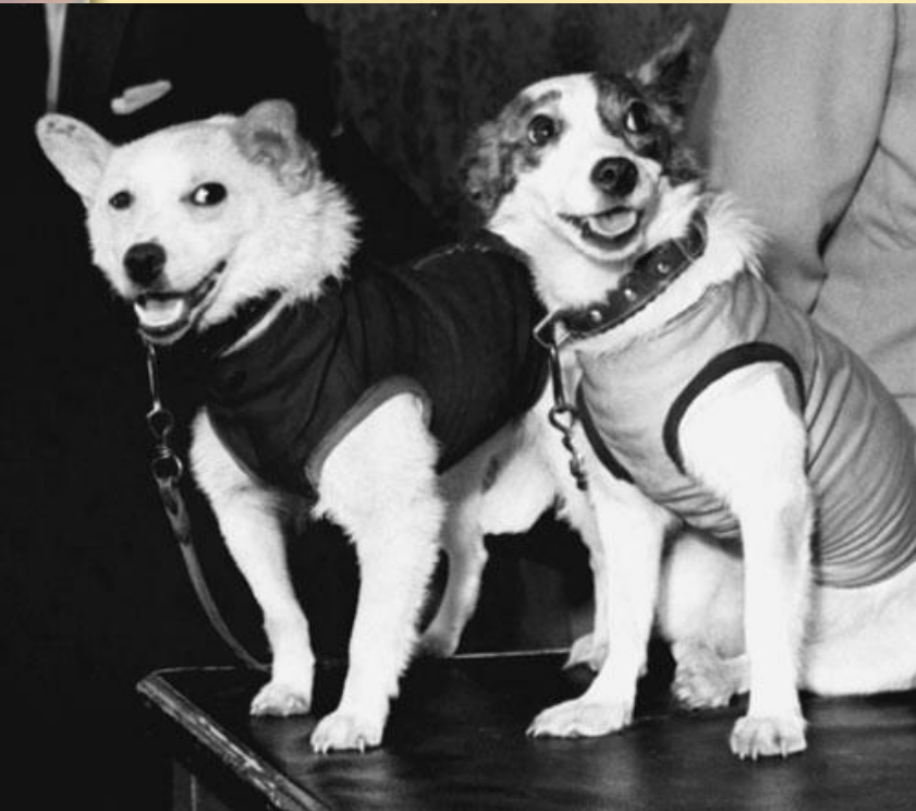
Белка и Стрелка