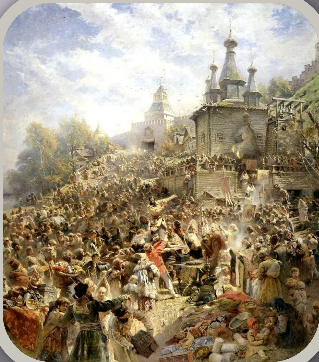
К.Е. Маковский «Воззвание Минина на площади Нижнего Новгорода»