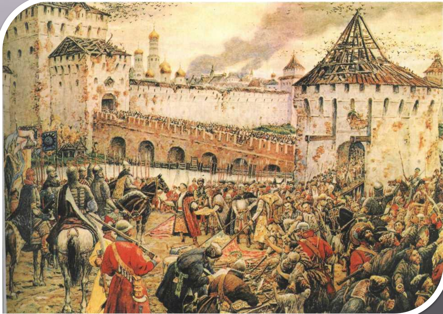
Изгнание польских интервентов из Московского Кремля. Художник Э. Лисснер. 19 в.