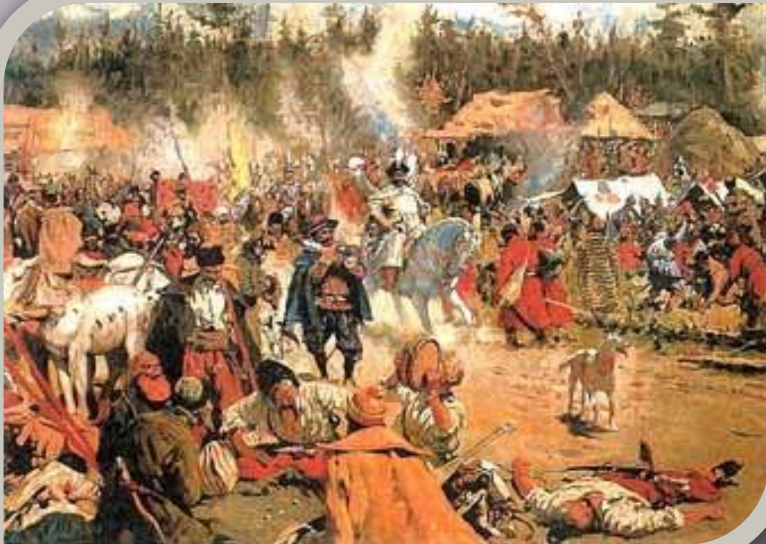
С.В. Иванов. «В смутное время».