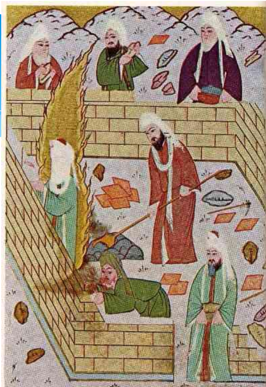
Muhammad's stay with Abu Ayyub was only temporary; soon after arriving he and his followers built a structure that would serve both as his house and as the chief mosque of the city. The Prophet himself helped his followers clear the ground and lay the bricks. As the devout laborers worked they chanted songs in praise of God.