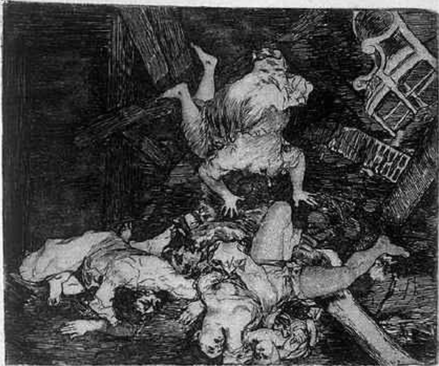
L'assaut de la guerre.