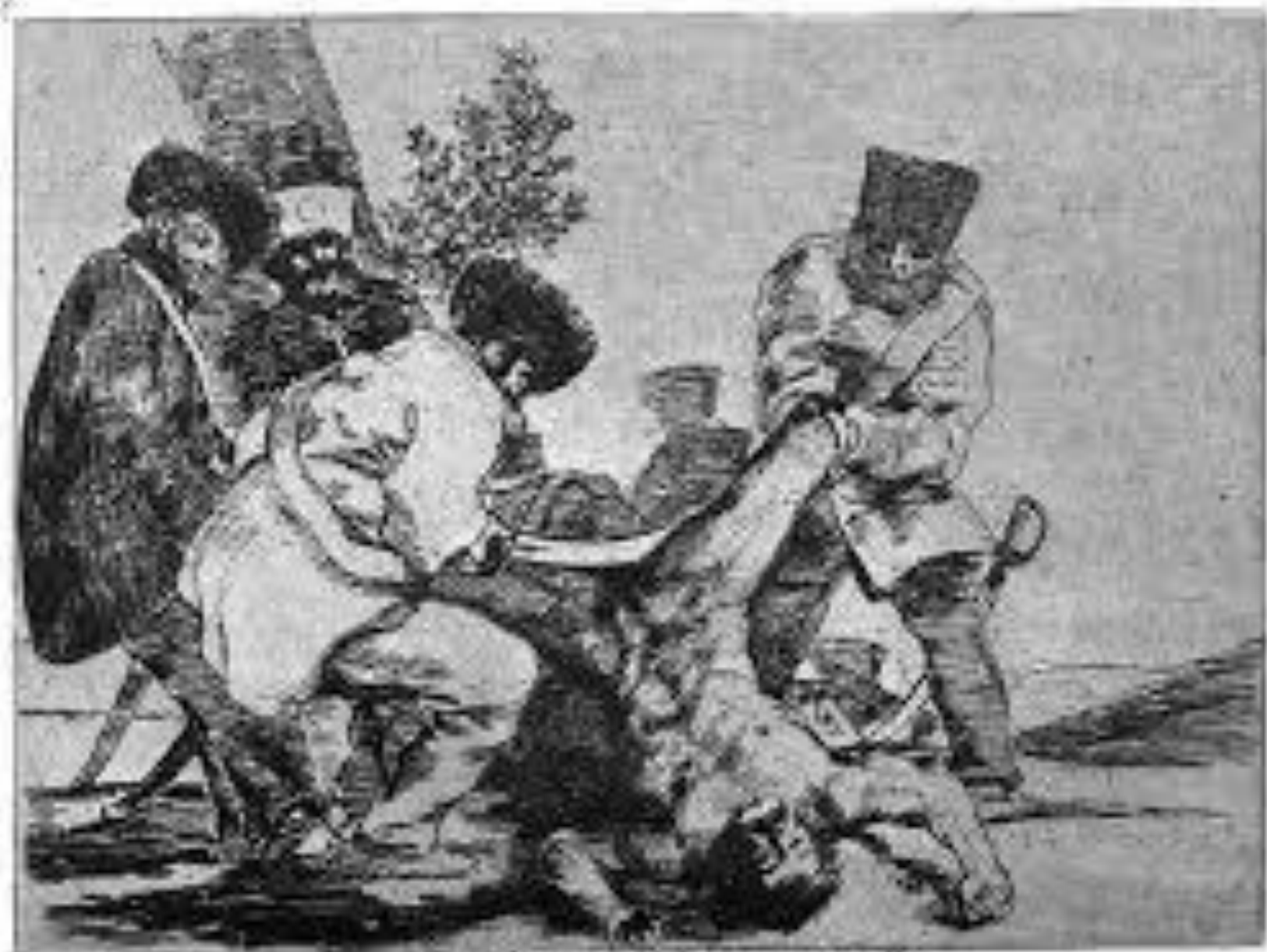
¿Por qué nos matan?