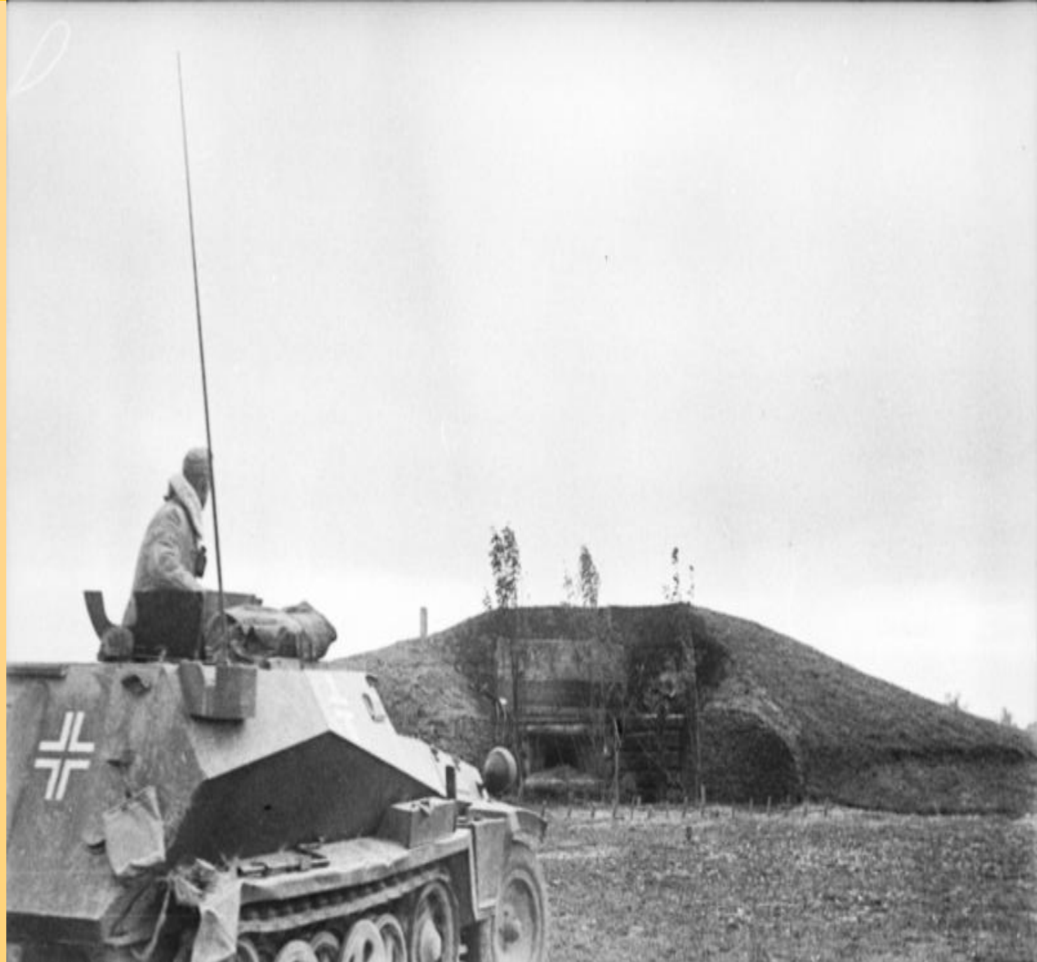
Oktober 1941

Термин был широко распространен во время советско-финской войны 1939—1940 гг. и Великой Отечественной войны 1941—1945 гг. для названия лёгких замаскированных огневых сооружений. Основными преимуществами дзота являются внезапность при открытии огня, а также возможность быстрого его возведения при ограниченных ресурсах.