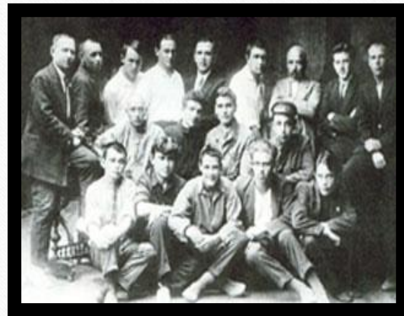
Муфтий и выдающийся ученый Риза Фахрутдинов. Снимок сделан в 1926 г. во время его участия во Всемирном мусульманском конгрессе и совершении Хаджа