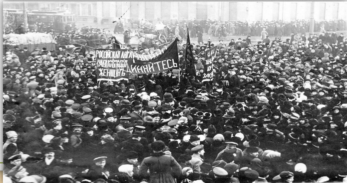
Первомайская демонстрация в Казани, 1917 г.

Свержение самодержавия и переход России на демократический путь развития не решили многих злободневных вопросов, волновавших общество. Самым главным из них было прекращение войны, а затем переход земли и промышленных предприятий и банков в руки народа, решение национального вопроса. Демократические силы во главе с Временным правительством проявляли нерешительность и стремление идти по пути медленных реформ на основе законов, которые должно было принять Учредительное собрание. Большая часть общества требовала немедленного решения всех наболевших проблем. Поэтому лозунги большевиков и ставших на время их союзниками левых эсеров, обещавших дать все это немедленно, охотно поддерживались населением. Октябрьский переворот, приведший большевиков к власти, был сравнительно легок и успешен почти на всей территории России. В Казани, начиная с 23 октября, шли вяло–текущие бои революционно настроенных солдат и красногвардейцев с правительственными войсками. Ни та, ни другая сторона не проявляли особенного ожесточения и стремления уничтожить противника. Когда в Казань пришло сообщение о падении Временного правительства в столице, бои практически уже кончились победой восставших. Была установлена советская власть, в структуру которой входили различные Советы, представлявшие наиболее крупные группы населения: крестьян, рабочих, солдат. В числе наиболее авторитетных лидеров большевиков, возглавивших новую власть, были М.Вахитов, Г. Олькеницкий, К.Грасис, Н.Ершов, Я.Чанышев и др.