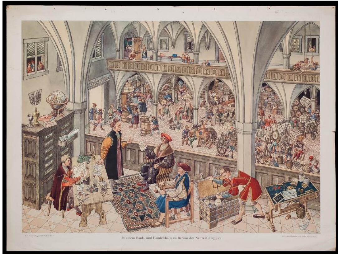
In einem Bank- und Handelshaus zu Beginn der Neuzeit (Fugger).

В XIV в. Фуггеры стали известны как банкиры, дававшие в долг деньги не только князьям, но и императором. Император Карл V возвел представителей этой семьи в графское достоинство. Так же семья имела денежные дела с папой римским, часто собирали для него десятину и принимали участие в торговле индульгенциями.