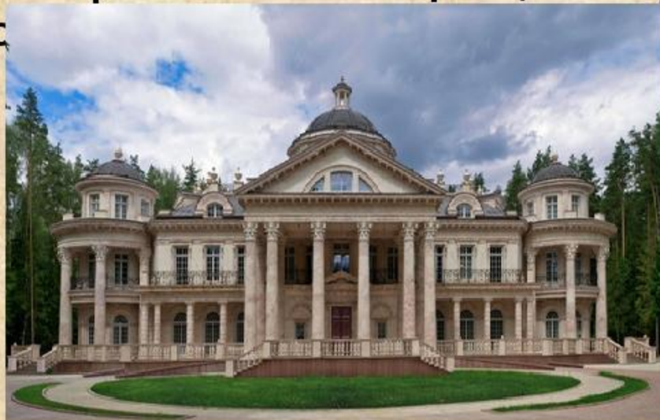
Екатерининский строгий классицизм