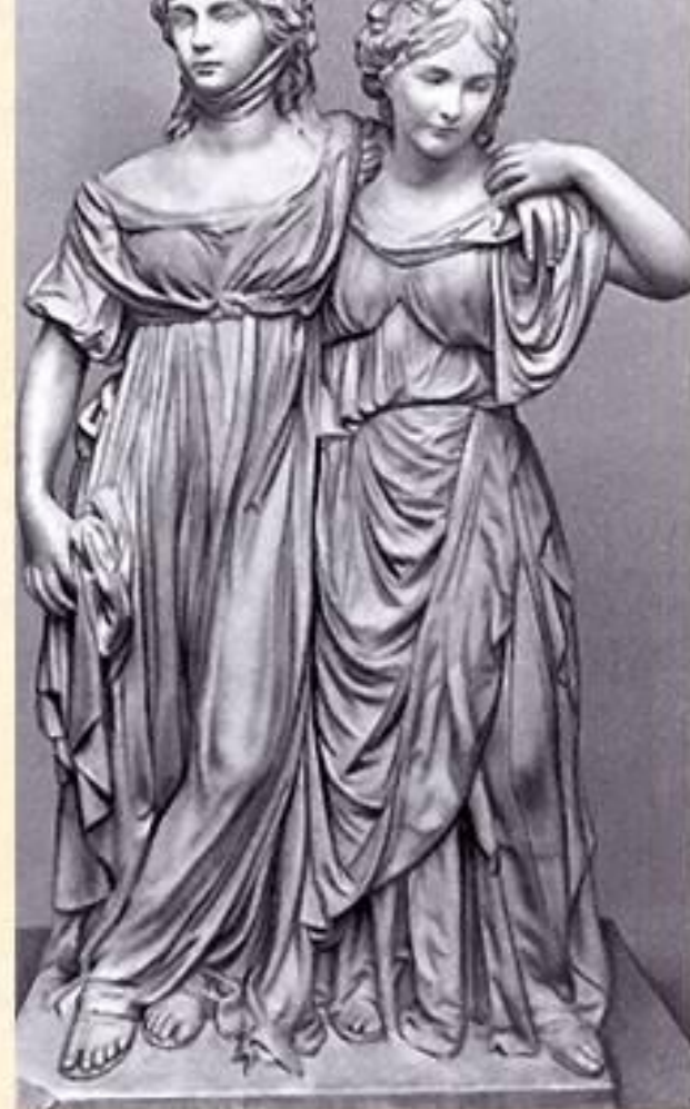
Кронпринцесса Луиза и принцесса Фредерика, 1795-1797 (Шадов И.Г., Германия)