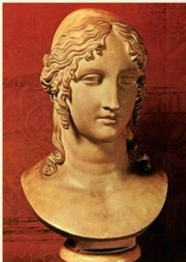
Голова Елены Прекрасной