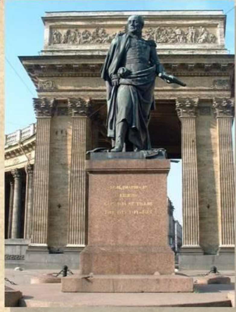
Памятник М.Б. Барклаю де Толли