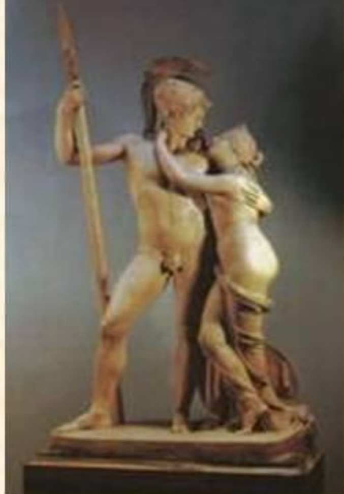
Венера и Марс (Канова Антонио, Франция), 1793

Классицизм отличается простотой и цельностью композиции, изяществом деталей,