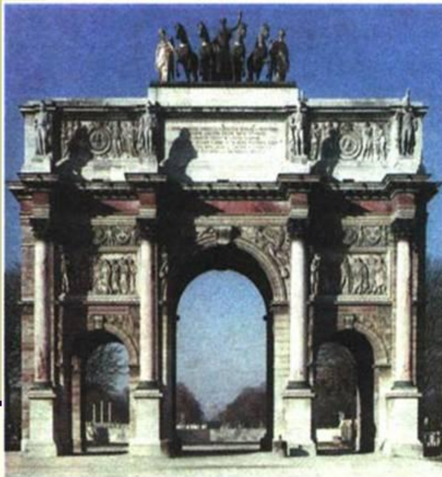
Ш. Персье, П.Ф.Л. Фонтен. Триумфальная арка на площади Каррусель в Париже. 1806 г. (стиль - ампир)

Каждому из видов искусства были присущи свои особенные черты: