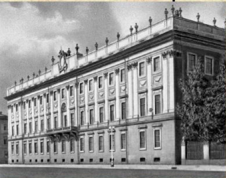
Екатерининский ранний классицизм

Различают екатерининский ранний классицизм, екатерининский строгий