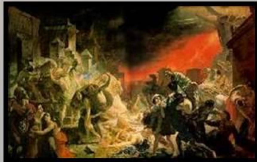
Последний день Помпеи