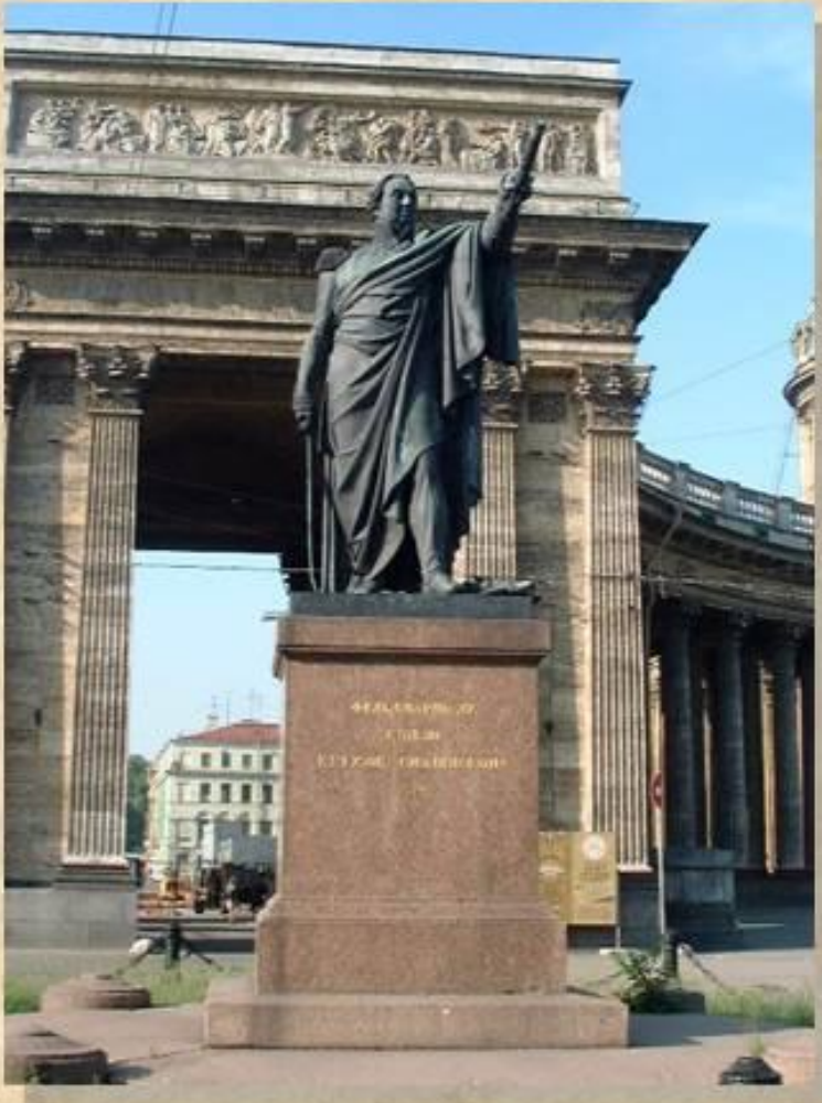
Памятник М.И. Кутузову