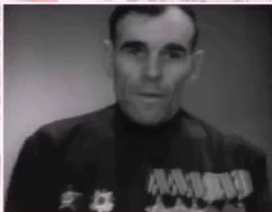
НИКОЛАЙ ЗАЛЁТОВ ПОЛНЫЙ КАВАЛЕР ОРДЕНА СЛАВЫ, УЧАСТНИК ВЕЛИКОЙ ОТЕЧЕСТВЕННОЙ ВОЙНЫ, ПОЧЁТНЫЙ ГРАЖДАНИН ЛЕНИНГРАДА