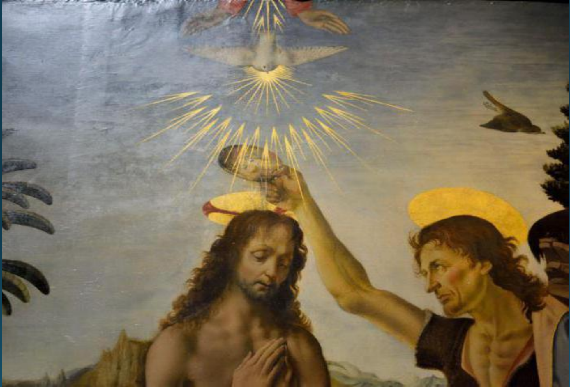
Крещение Христа. Андреа дель Вероккьо, Леонардо да Винчи. 1470 – 1478 гг. Галерея Уффици. Флоренция.