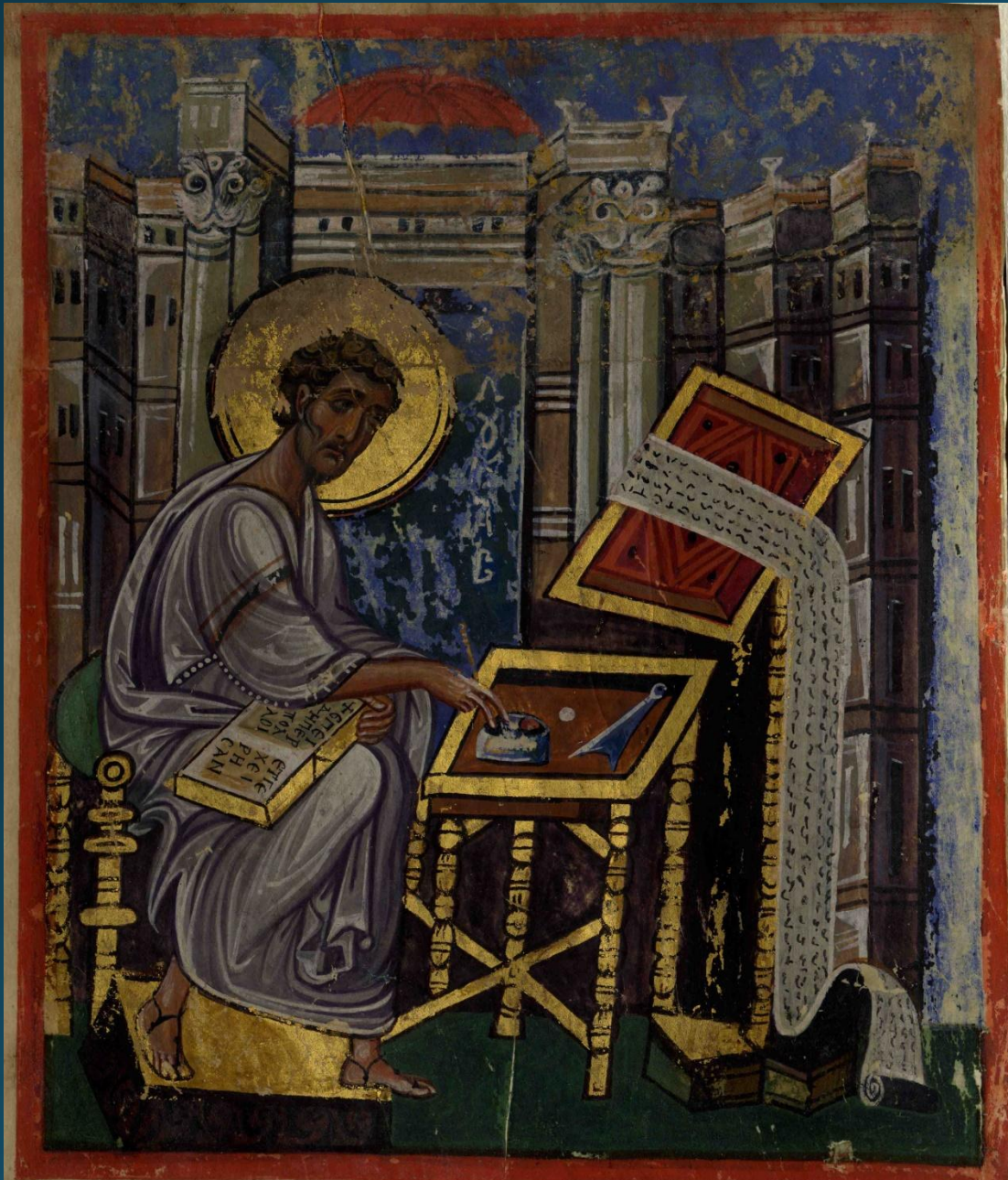
Евангелист Лука. Миниатюра Довольского Евангелия. Белград. Национальная библиотека Сербии, рс. 638, л 107 об. Кон. X - нач. XI в.