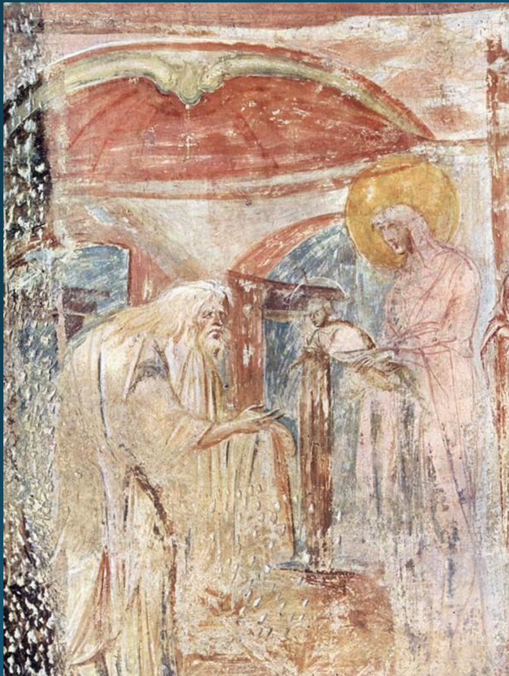
Сретение. Фреска VII в. Кастельсеприо. Италия.