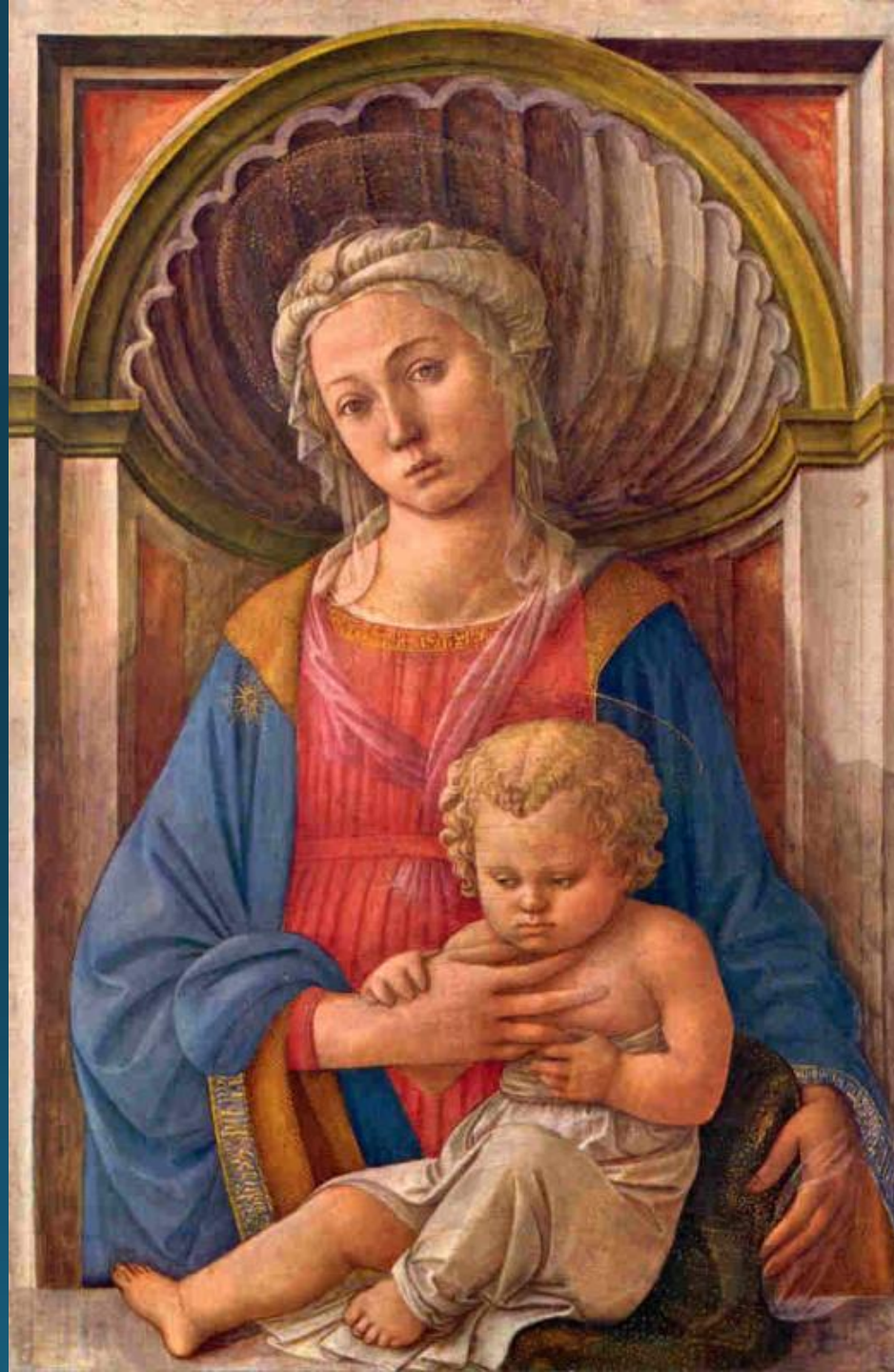
Мадонна с младенцем. Фра Филиппо Липпи. 1440 г. Национальная галерея искусства. Вашингтон.