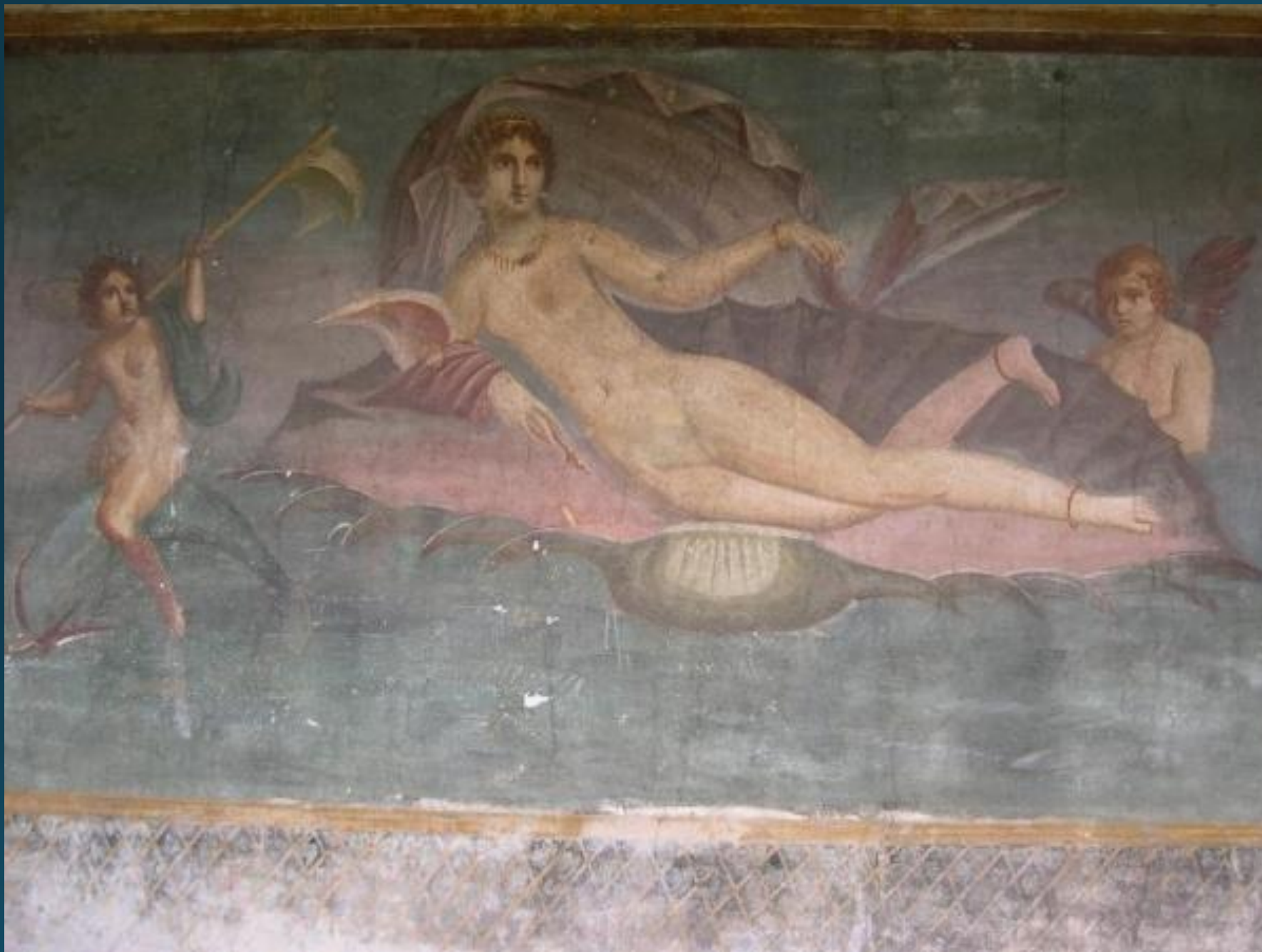
Венера в Раковине. Фреска задней стены перистиля. Дом Венеры в раковине (II з. з). Помпеи.