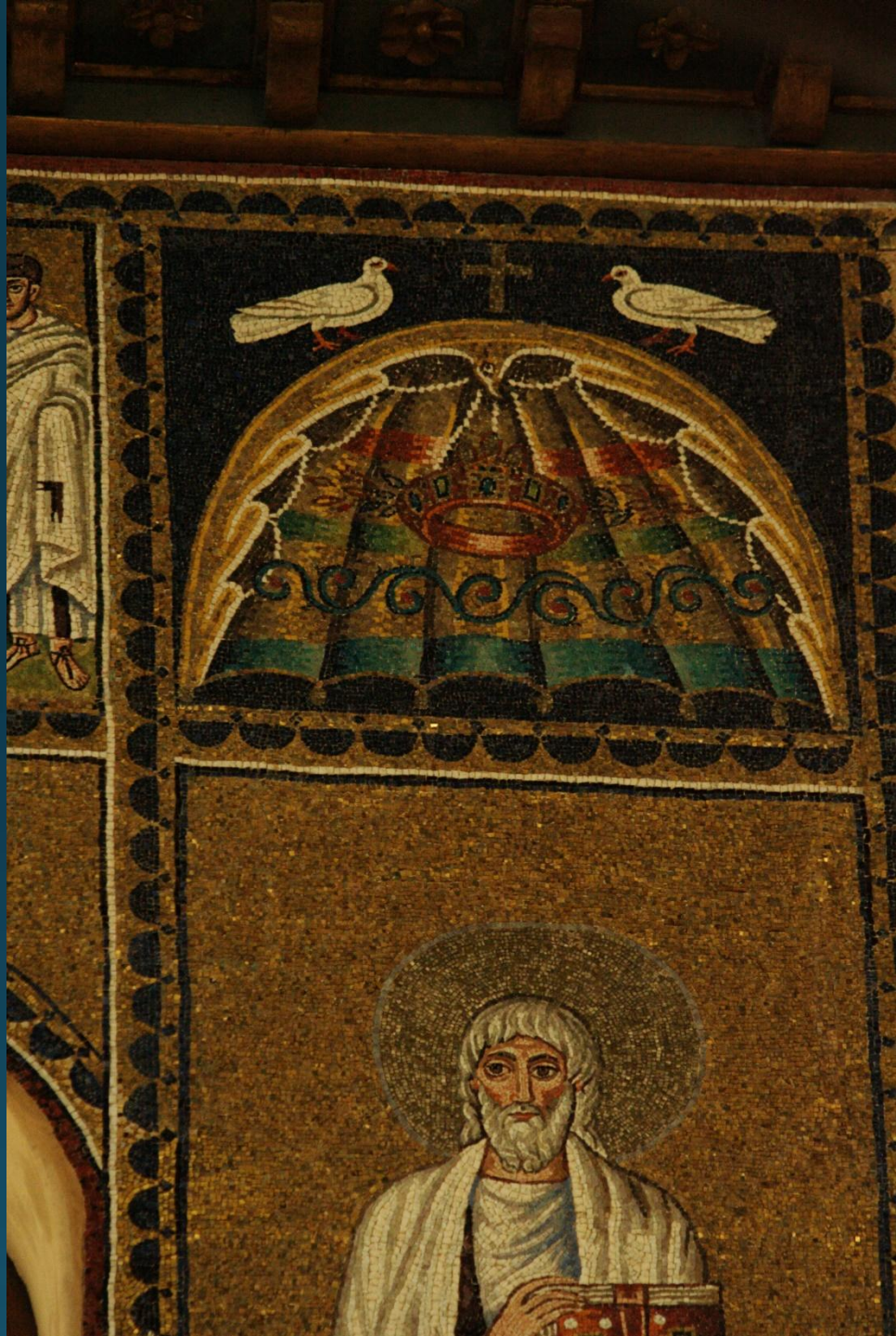
Киворий-купол над святым. Сант-Аполлинаре-Нуово VI в. Равенна.