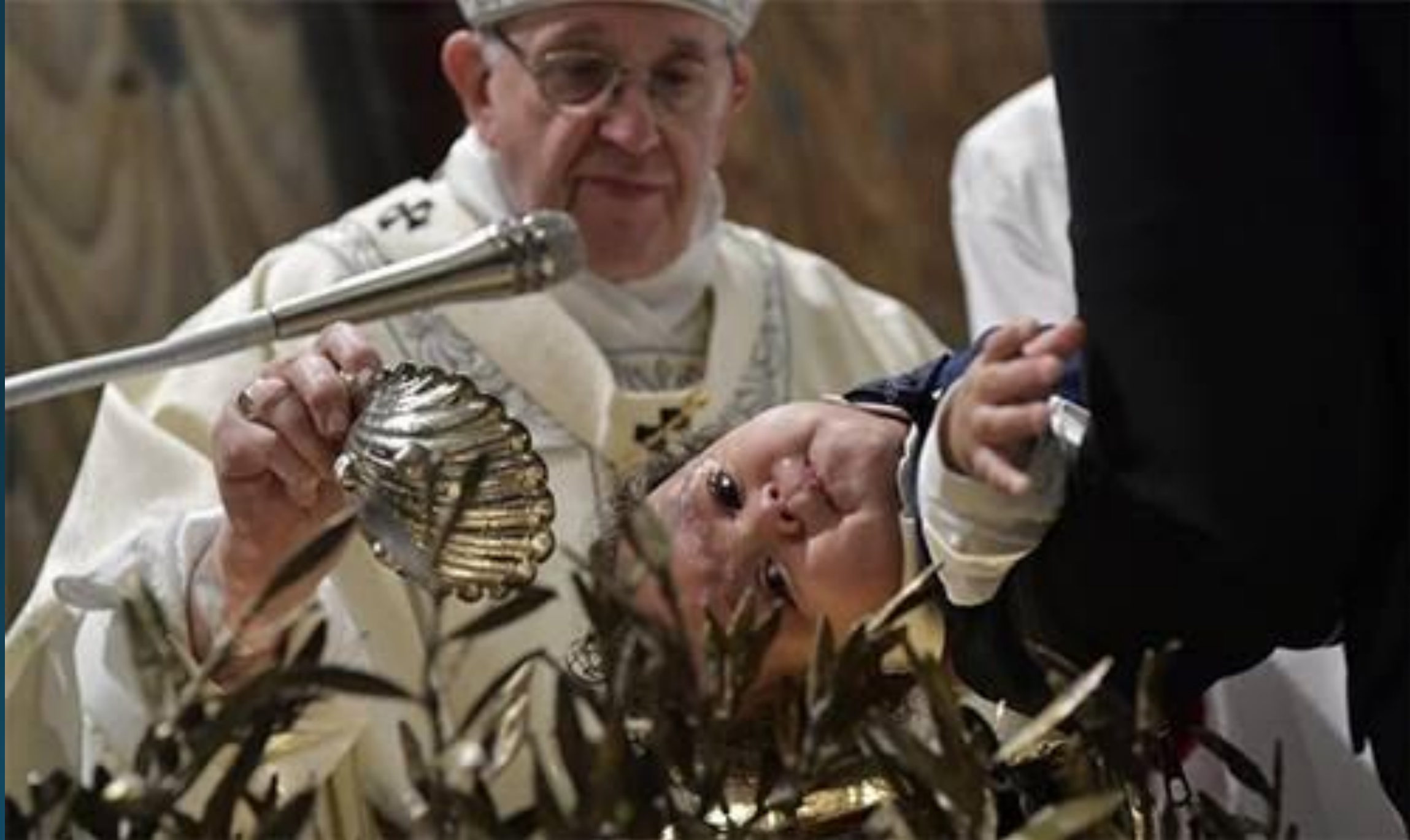
Папа Римский крестит младенца. 14 января 2019 г.