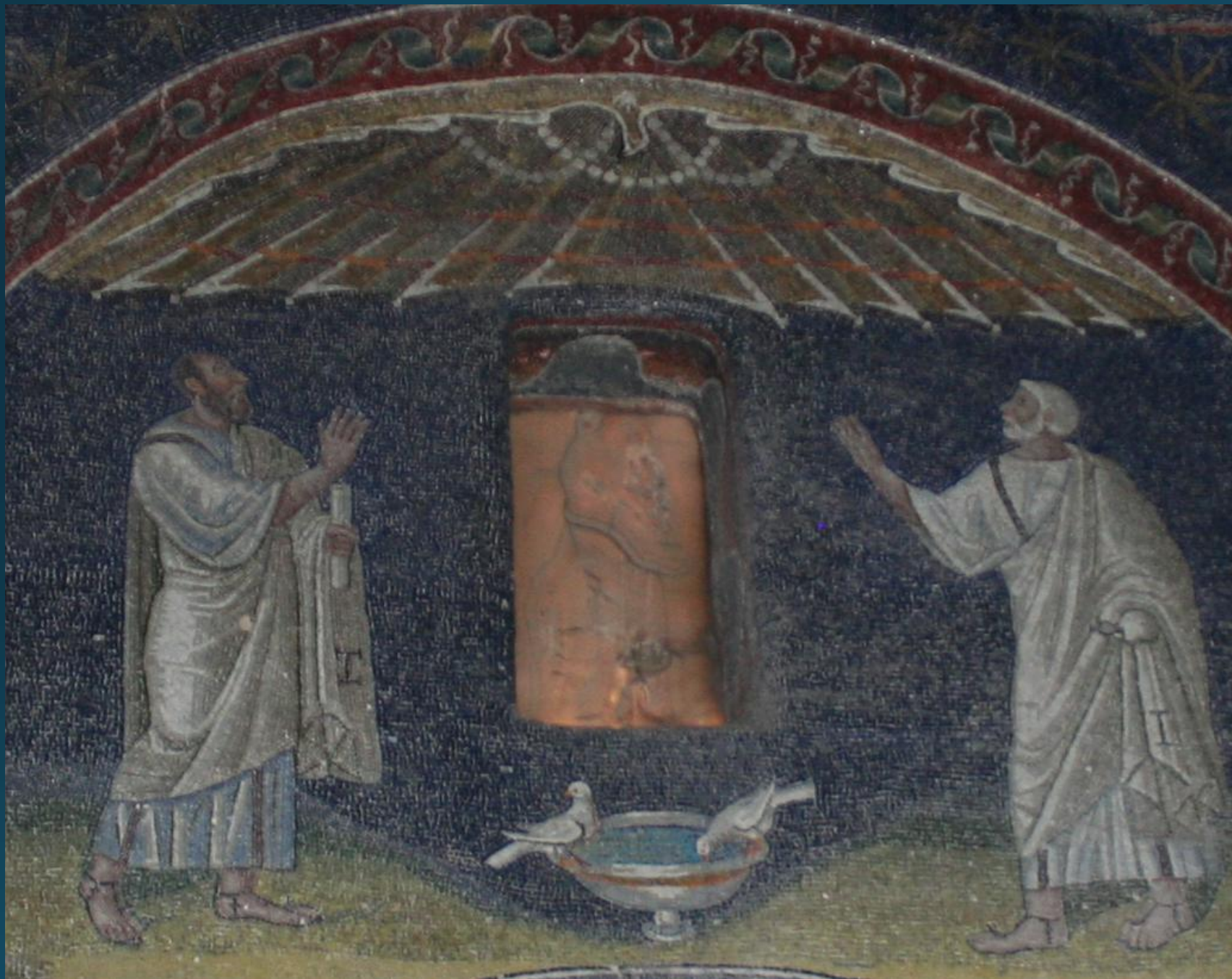
Киворий-купол над апостолами. Мавзолей Галлы Плацидии втор. четв. V в. Равенна.