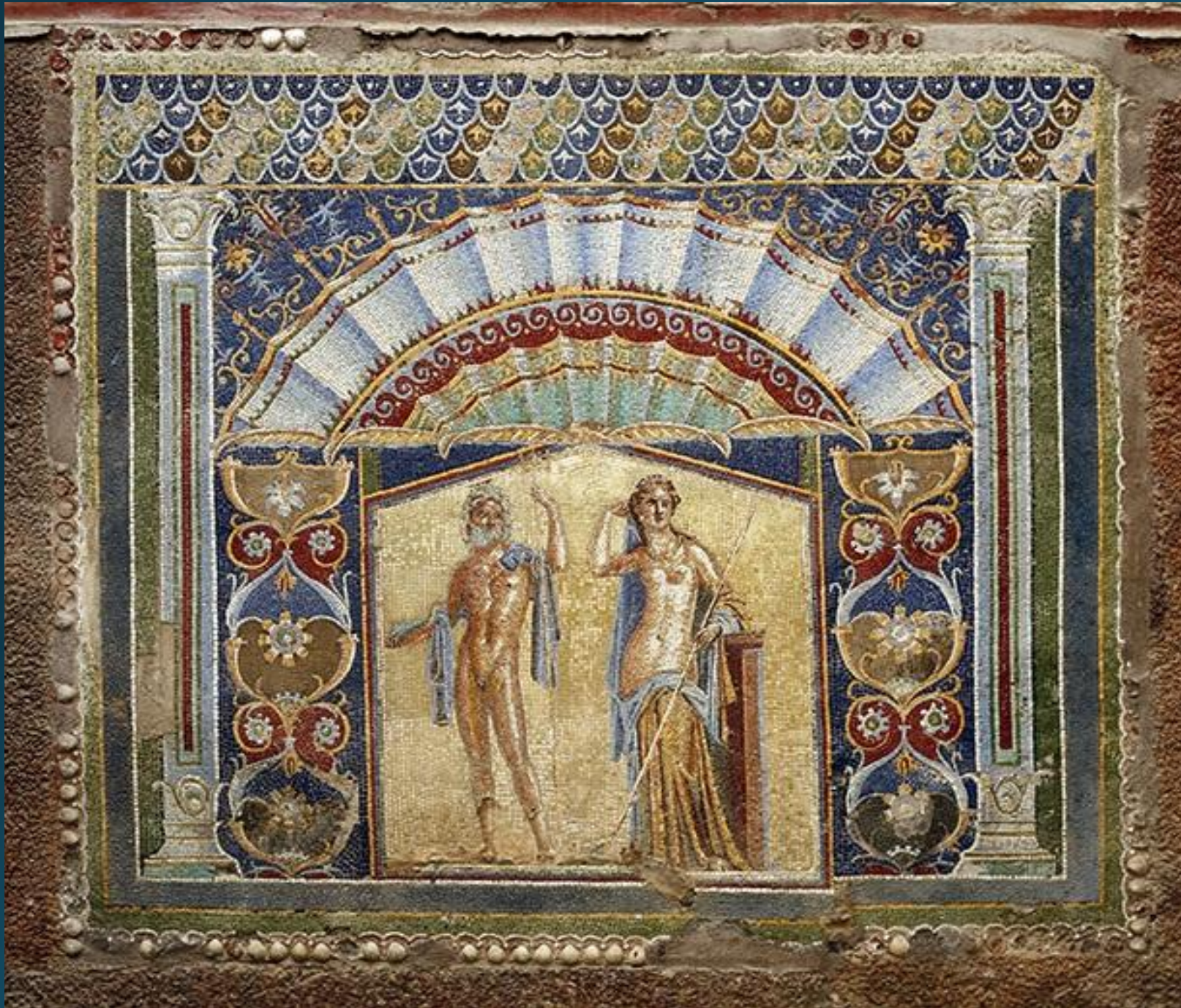
Раковина-ткань над Нептуном и Амфитриной. Геркуланум, дом Нептуна и Амфитрины.