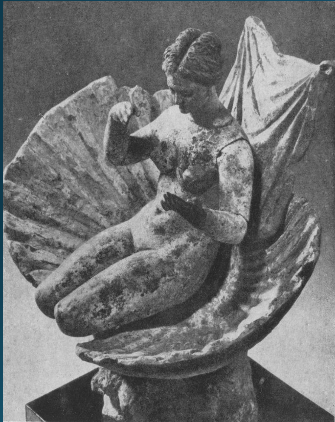
Афродита в раковине. Танагрская статуэтка. Терракота. Конец IV в. до н. э. Париж. Лувр.