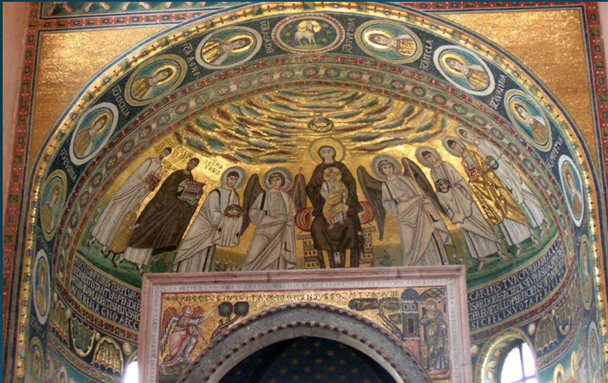
Церковь Пресвятой Богородицы в Порече VI в. Истрия. Хорватия.