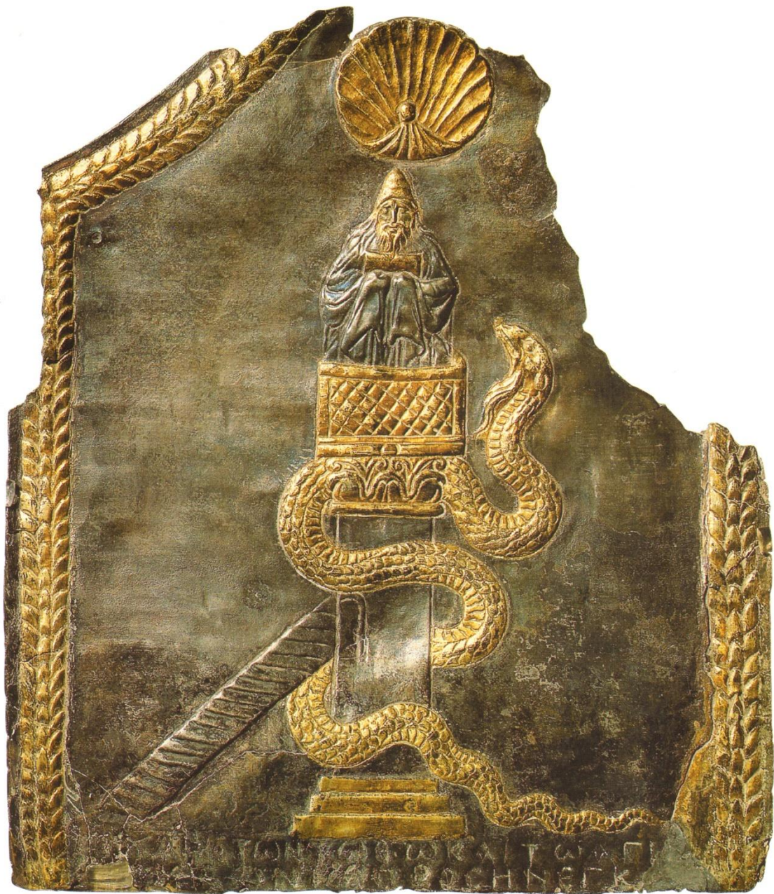
Св. Симеон Столпник. Серебряная пластина с золочением. Кон. VI – нач. VII вв. музей Лувр. Париж. Вj 2180.