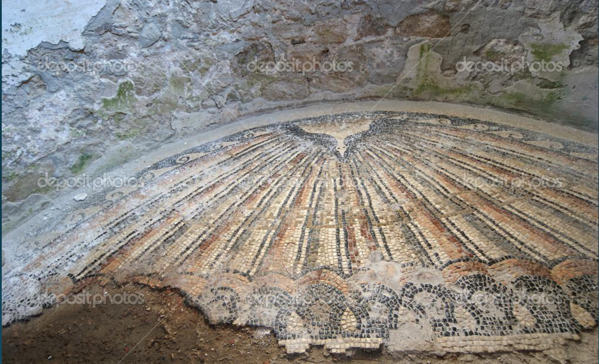
Зонт-раковина. Мозаика на полу в малой апсиде (справа от алтаря) в церкви Пресвятой Богородицы в Порече VI в. Истрия. Хорватия.