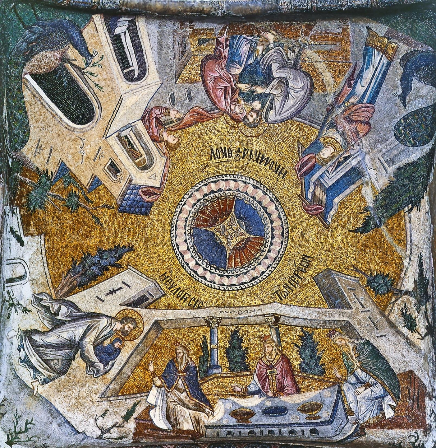
Купол-зонт из ткани. Мозаики цикла «История детства Богоматери», Кахрие Джамии, монастырь Хора, 1316 – 1321 гг. Стамбул (Константинополь) Турция.