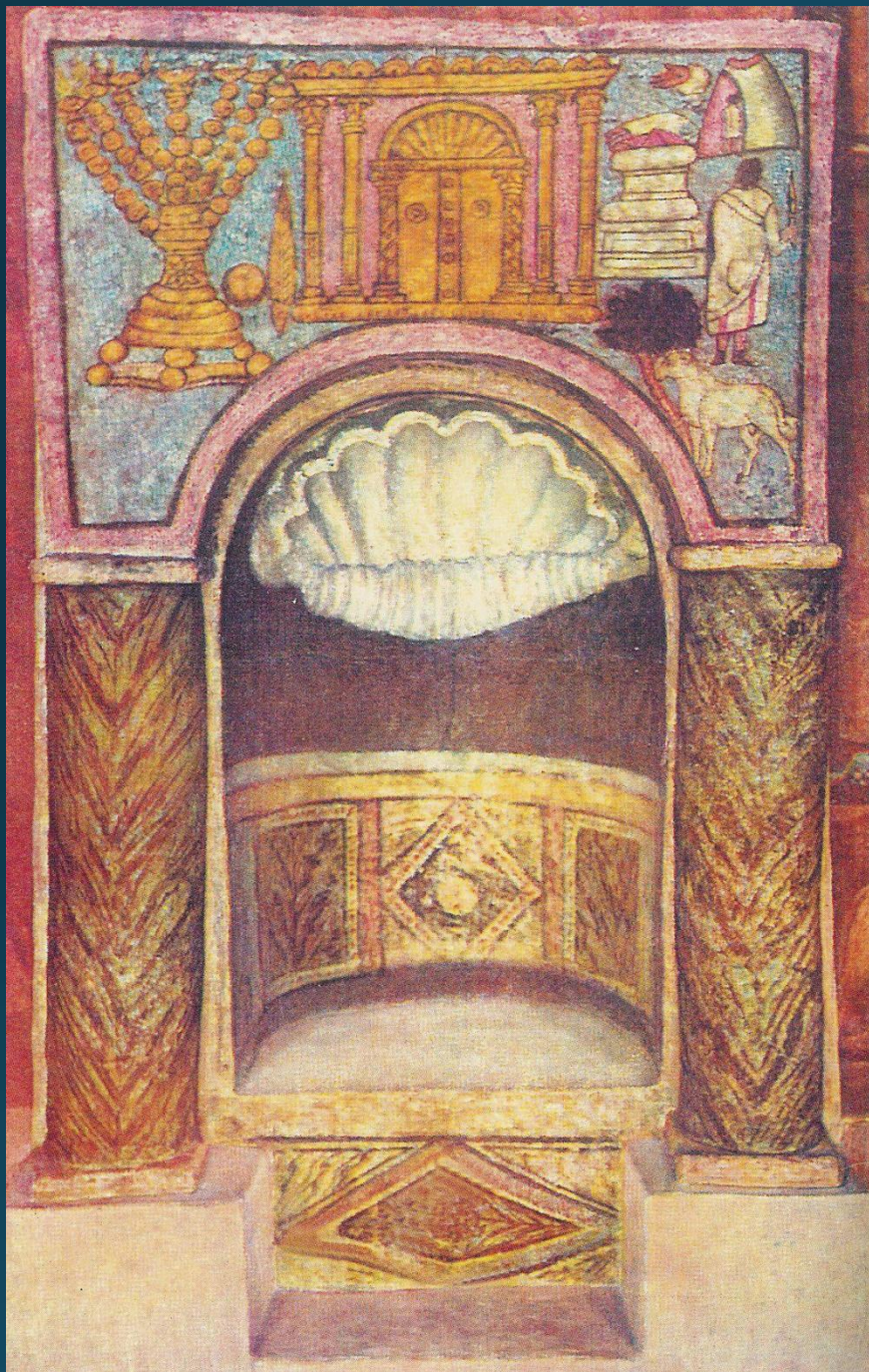
Раковина над нишей для хранения Торы в Дуре-Европос ок. 230 г., (Сев. Сирия, совр. Ирак).