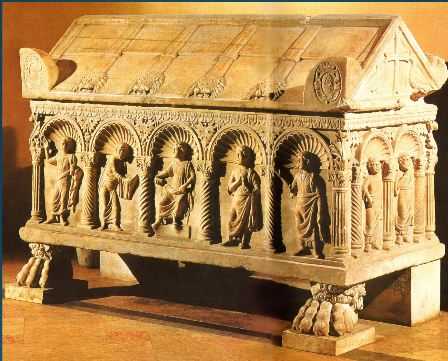
Христос, передающий закон. Мраморный саркофаг IV – V в. Базлика св. Франциска в Равенне.