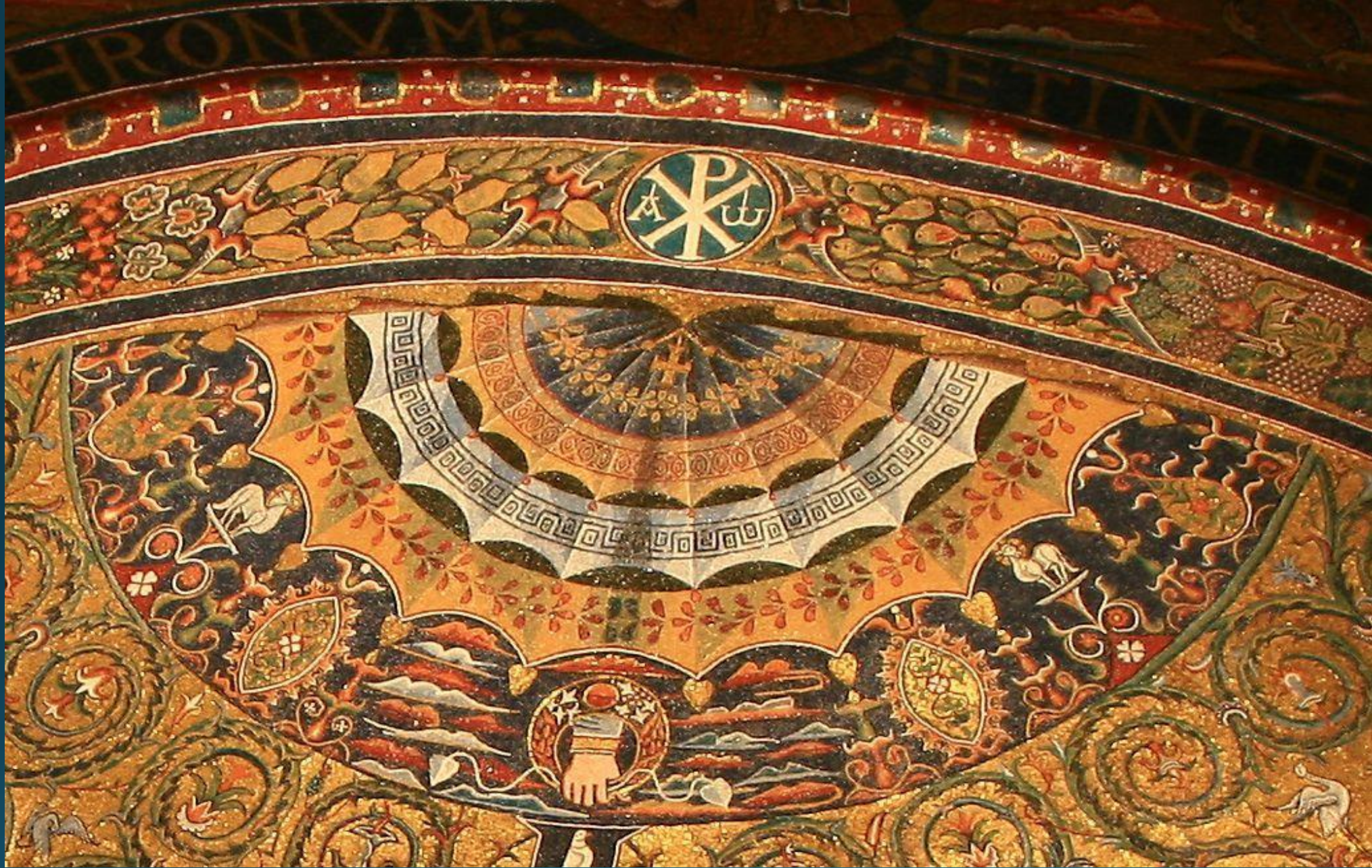
Зонт-купол. Мозаика в апсиде церкви Св. Климента в Риме ок. 1130 гг.