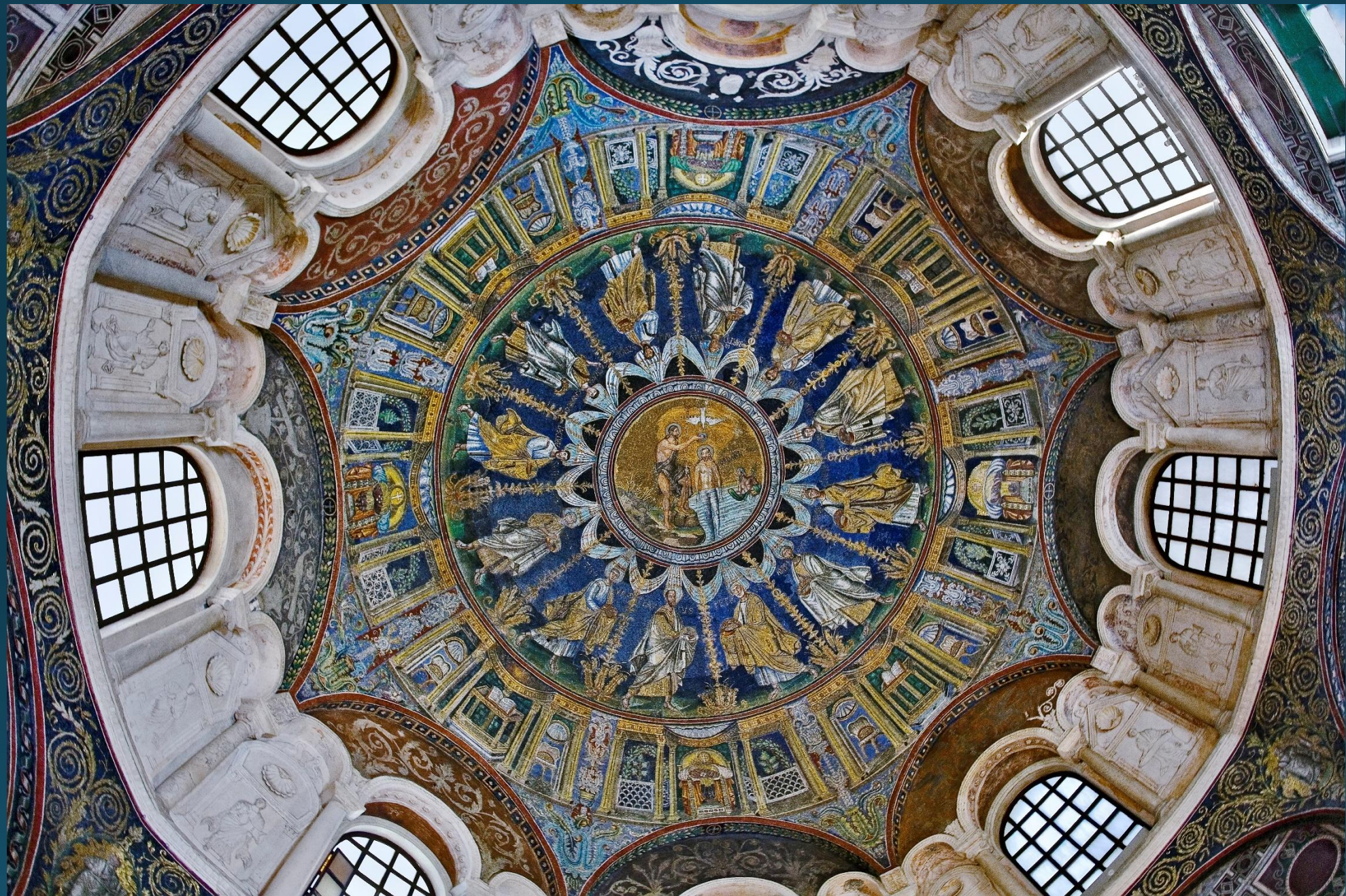
Мозаики в куполе Православного баптистерия, серед. V в. Равенна.