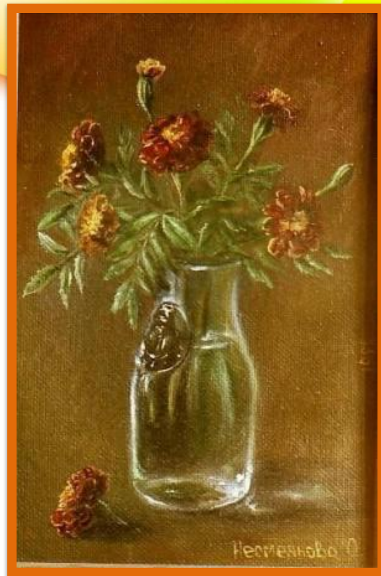
Натюрморт «Бархатцы» Несмеянова О.