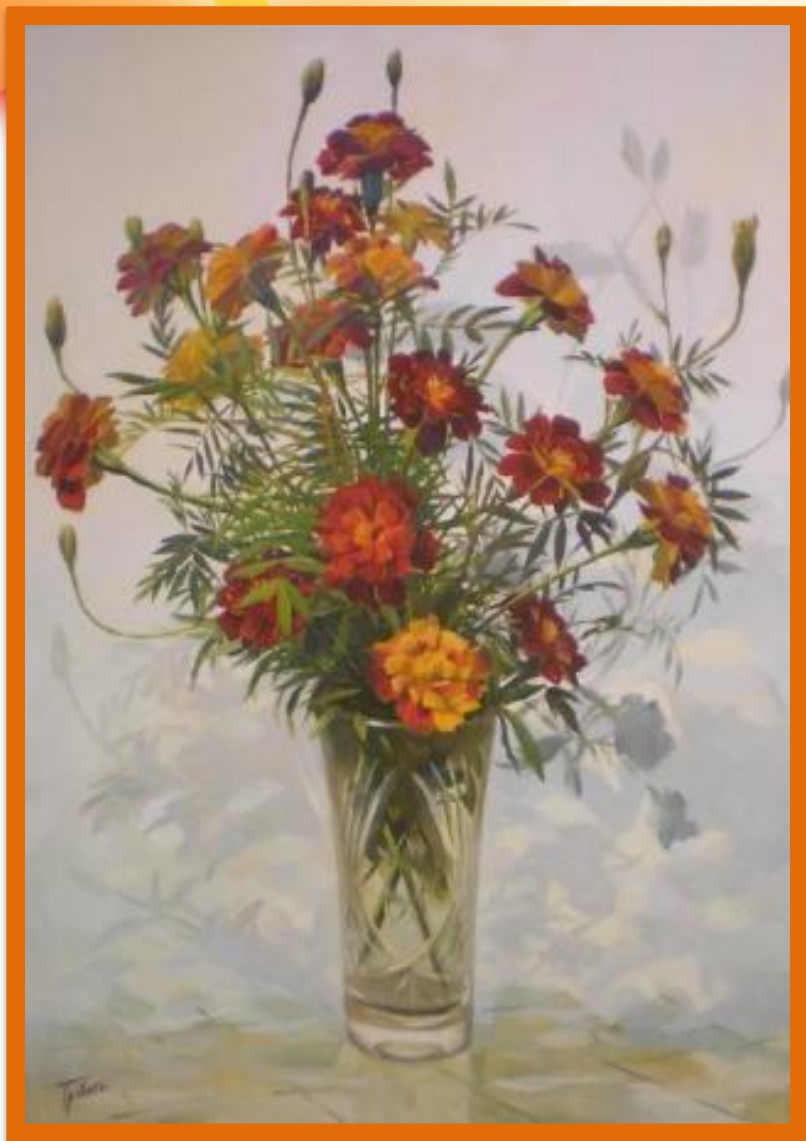
Картина «Бархатцы» Травкин В.А