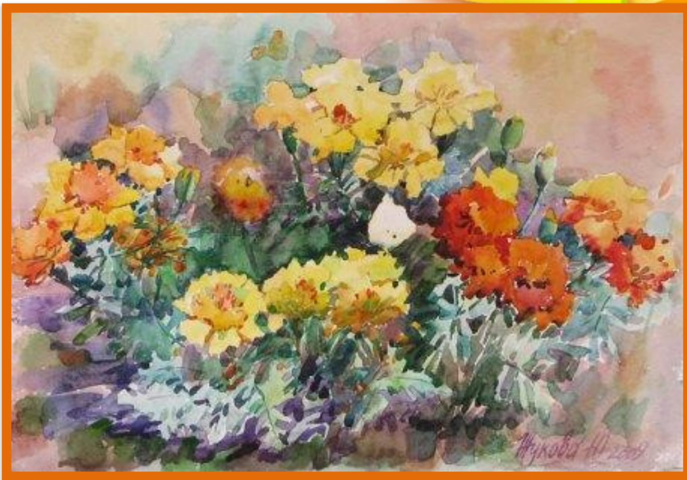
Картина «Бархатцы» Жукова Ю.А