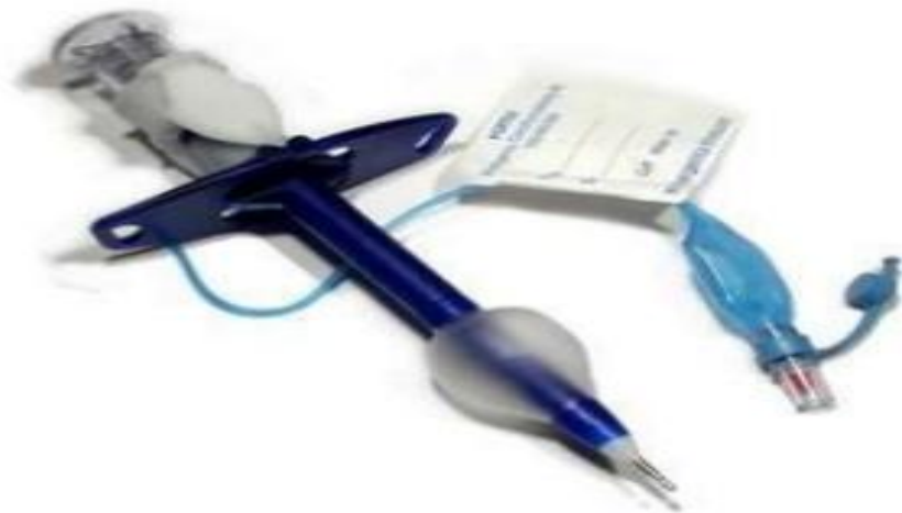
Набор для коникотомии Portex