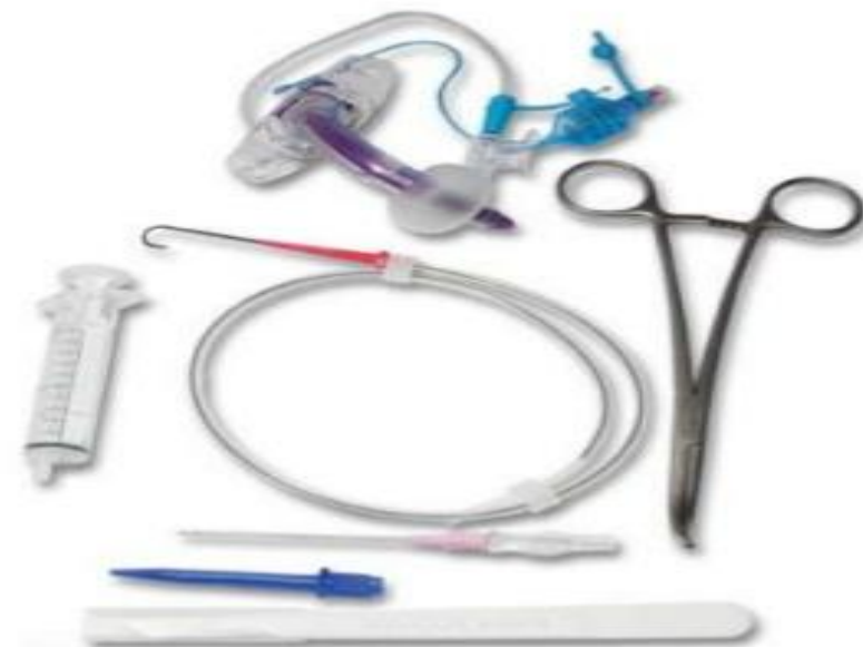
Набор для трахеостомии Portex