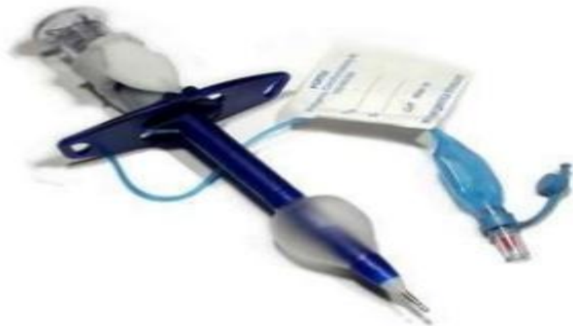
Набор для коникотомии Portex