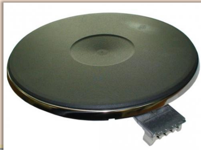
конфорка для электроплиты