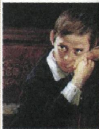
П. И. Чайковский «Нянина сказка»