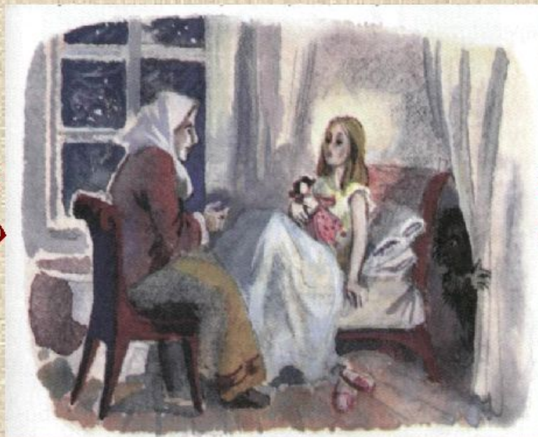
С. С. Прокофьев «Сказочка»