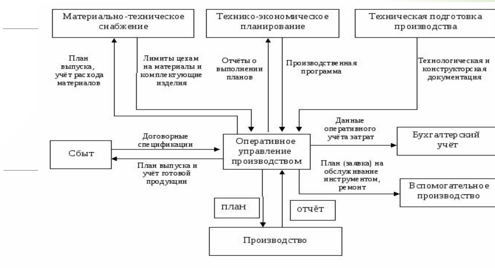
Структура взаимосвязей подразделений, участвующих в производственном процессе