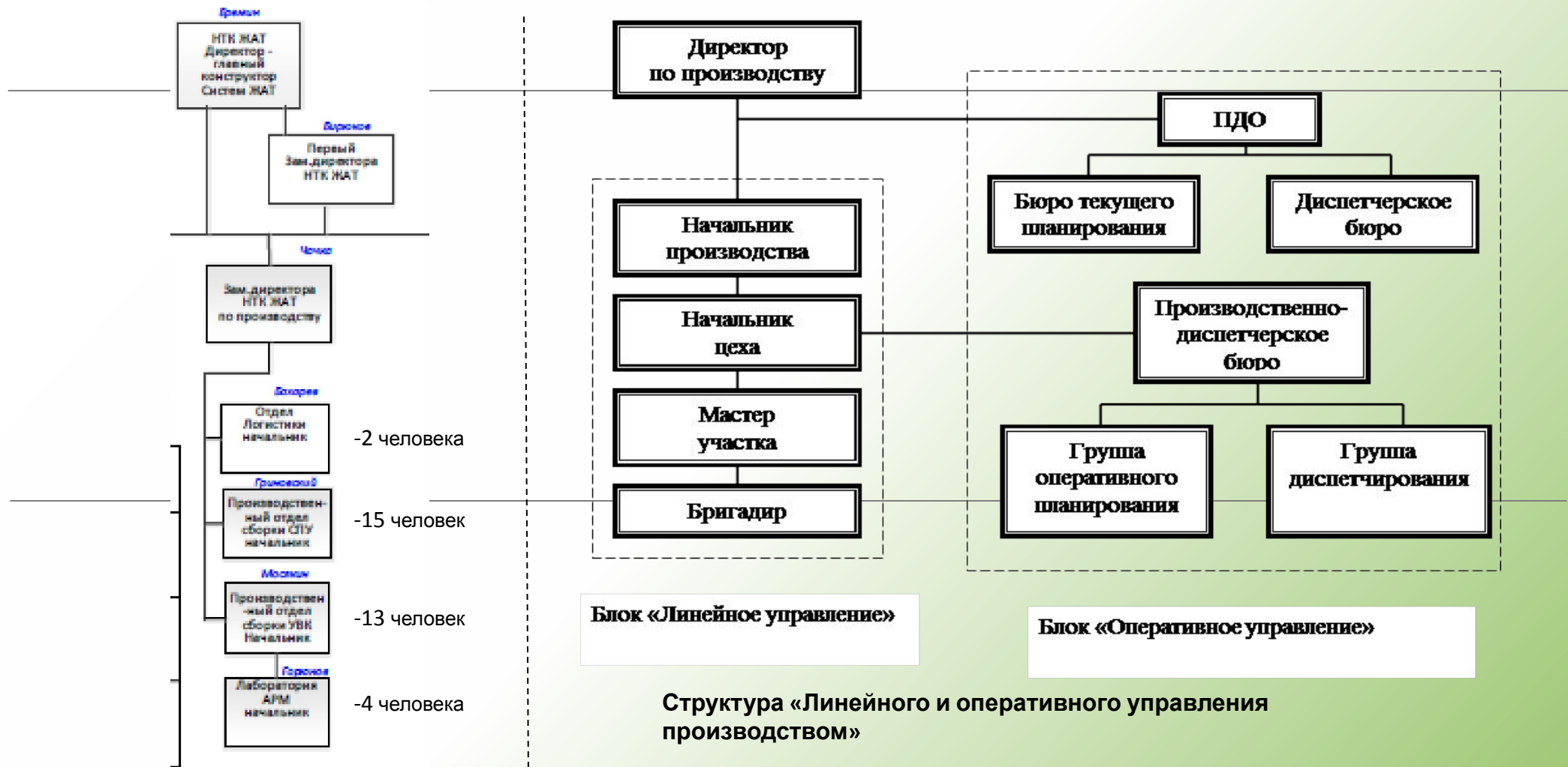
Текущая структура производства НТК ЖАТ