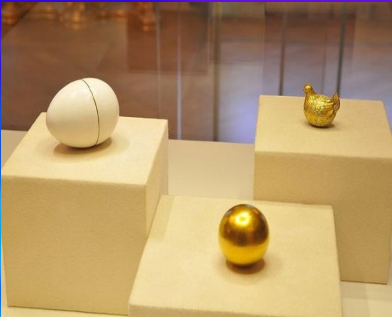
Курочка, яйцо Фаберже, 1885