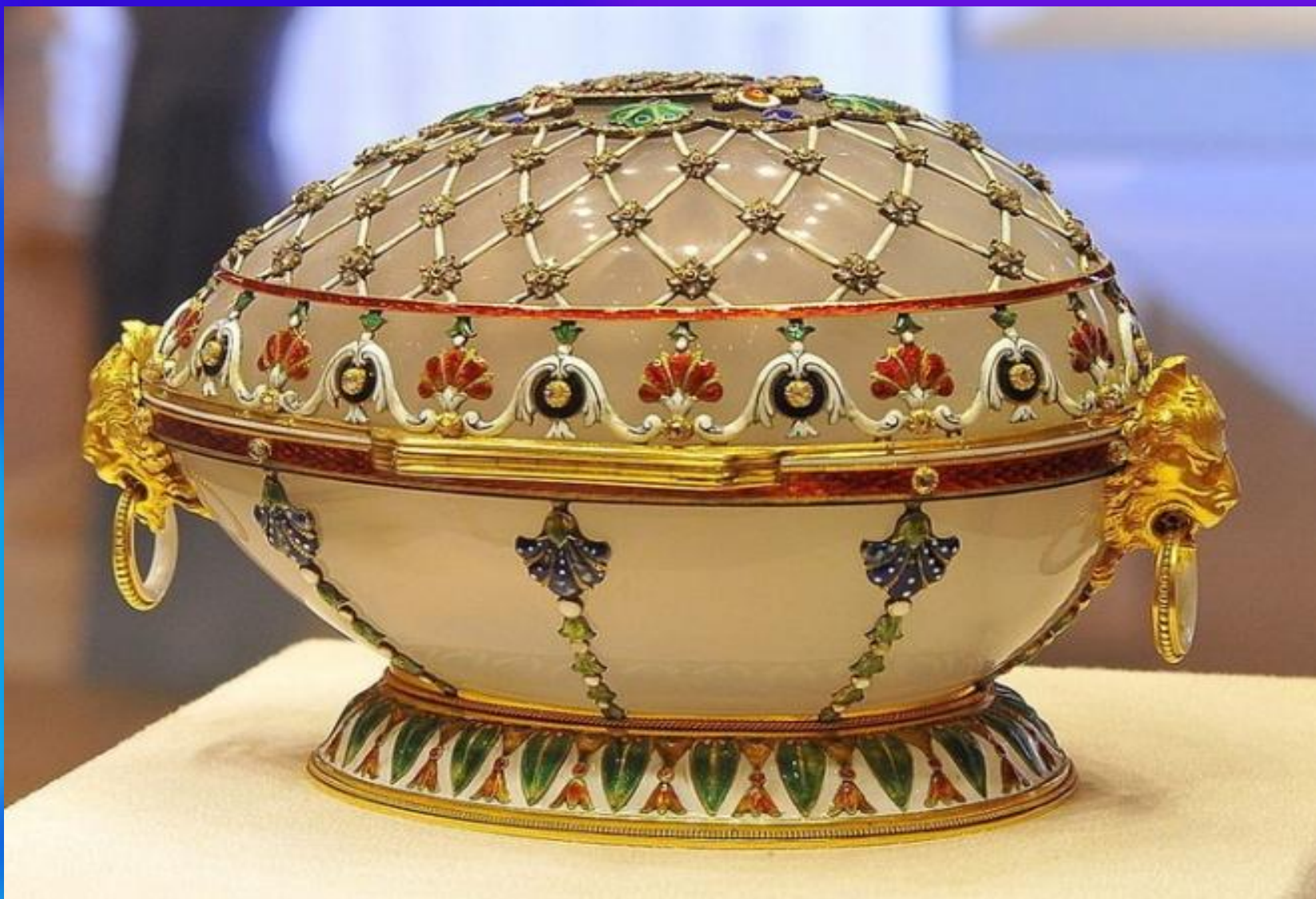
Пятнадцатая годовщина царствования, яйцо Фаберже, 1911