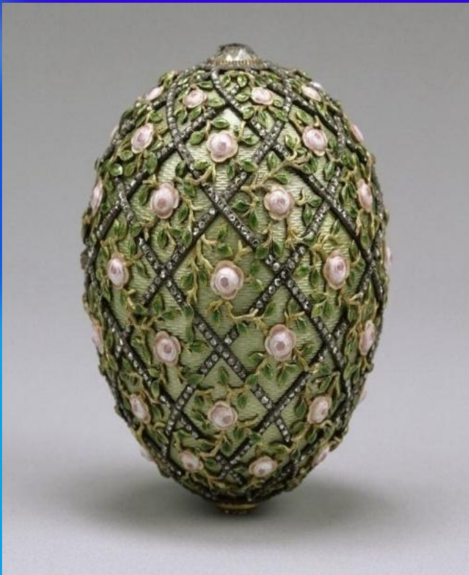
Яйцо с решеткой и розами, Фаберже, 1907

5. Существует нескольких версий о дальнейшей судьбе сокровищ. По одной из них все драгоценности были конфискованы большевиками и позже были проданы за границу, по другой — несколько чемоданов были заблаговременно вывезены в норвежское посольство, но и оттуда они были выкрадены вместе с архивными данными, по третьей версии Карл Фаберже и его сыновья смогли спрятать часть драгоценных изделий в тайниках.