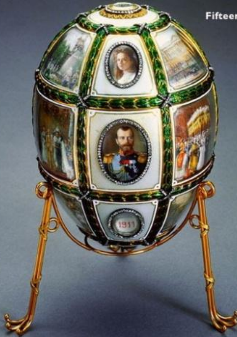
Fifteenth Anniversary Egg, 1911