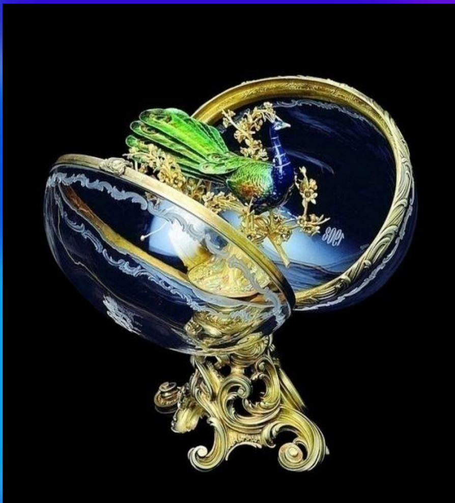
Павлин, яйцо Фаберже, 1908

7. После Октябрьского переворота большевики, пытаясь пополнить казну «первого в мире коммунистического государства», распродавали российские художественные сокровища. Они разграбили церкви, продали полотна старых мастеров из музея «Эрмитаж» и взялись за короны, диадемы, ожерелья и яйца Фаберже, принадлежавшие семье Императора.