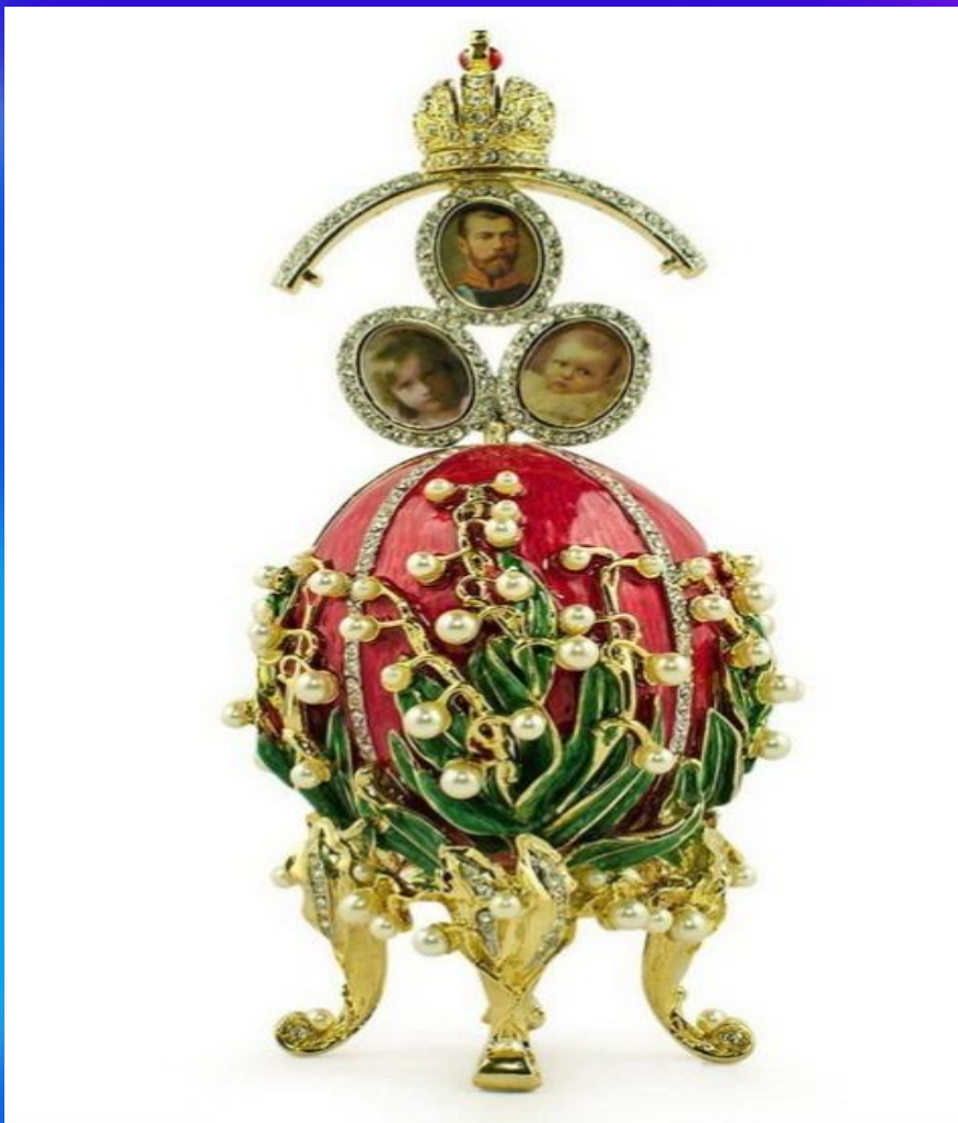
Ландыши, яйцо Фаберже, 1898