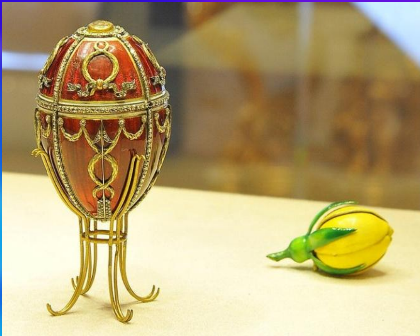
Яйцо с бутоном розы, Фаберже, 1895