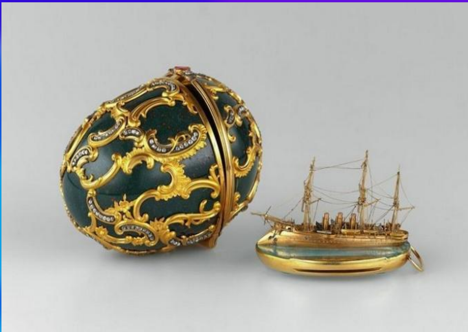
Память Азова, яйцо Фаберже, 1891