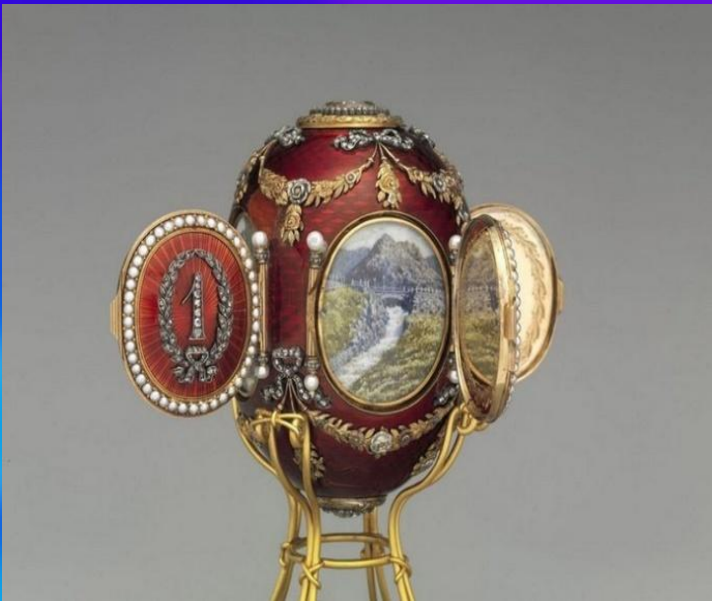
Кавказское, яйцо Фаберже, 1893