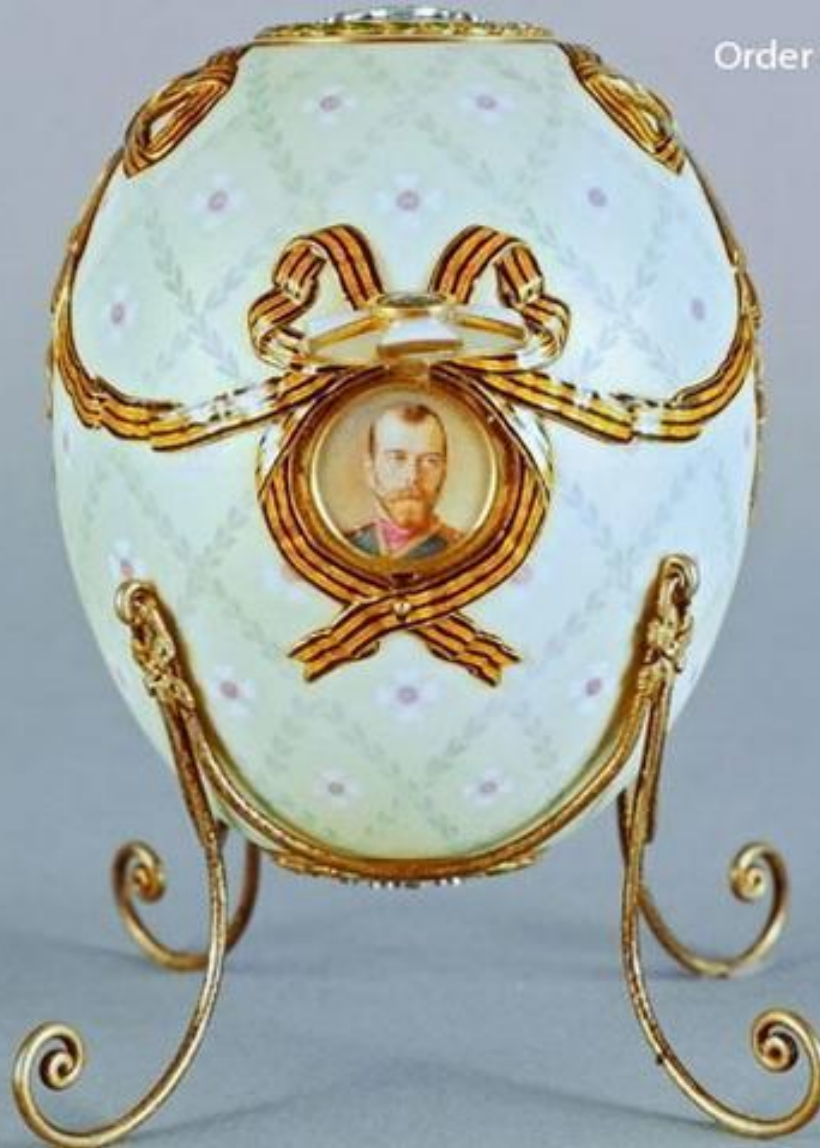
Order of St George Egg 1916