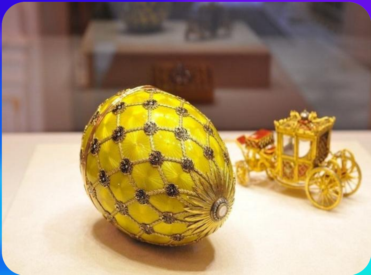
Коронационное, яйцо Фаберже