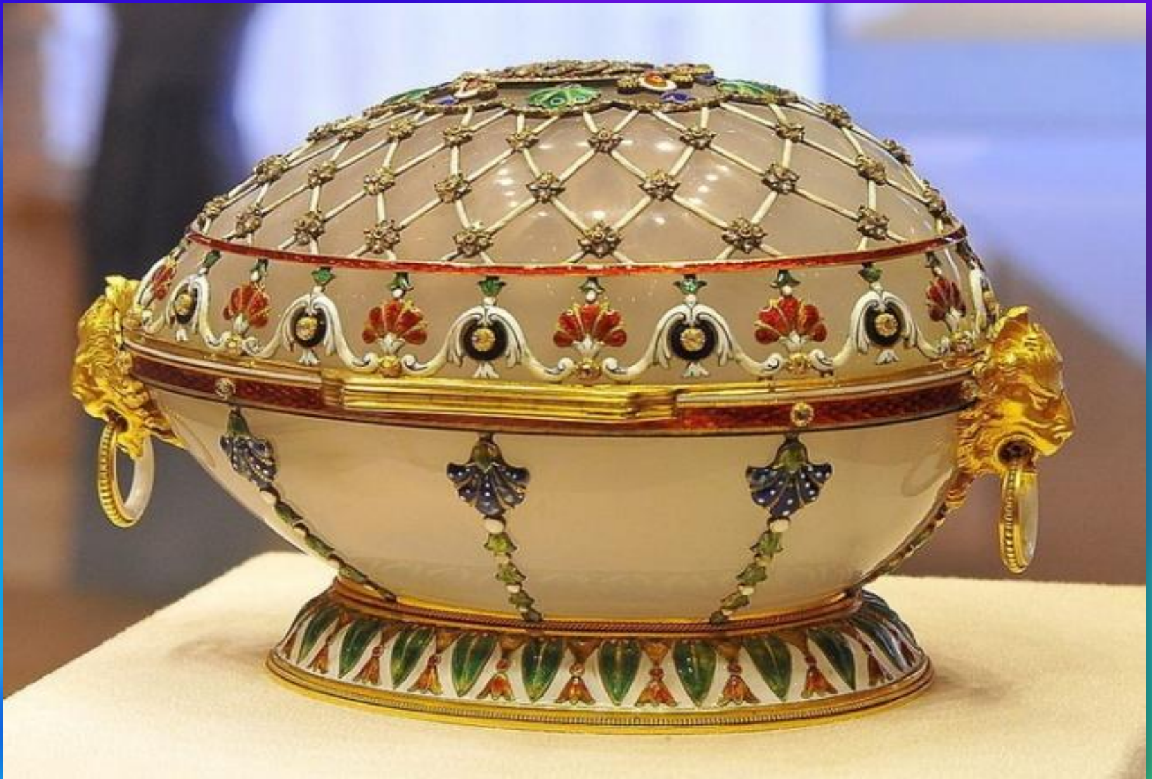
Пятнадцатая годовщина царствования, яйцо Фаберже, 1911