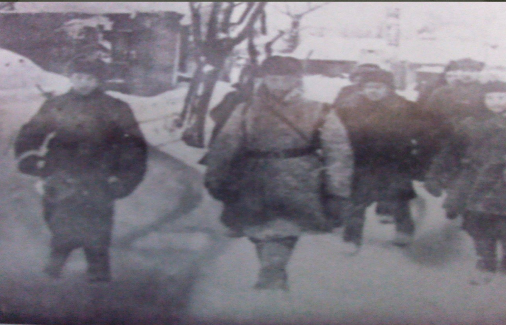
Тучковские партизаны возвращаются в освобожденный поселок