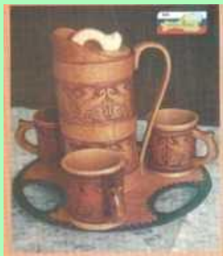
Набор для холодных напитков