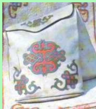
Сумка для перевозки продуктов