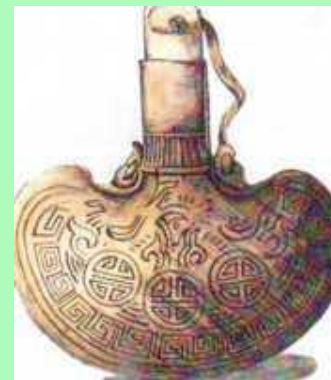
Тувинский национальный сосуд для холодного напитка