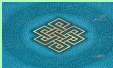
Орнамент «Узел счастья»