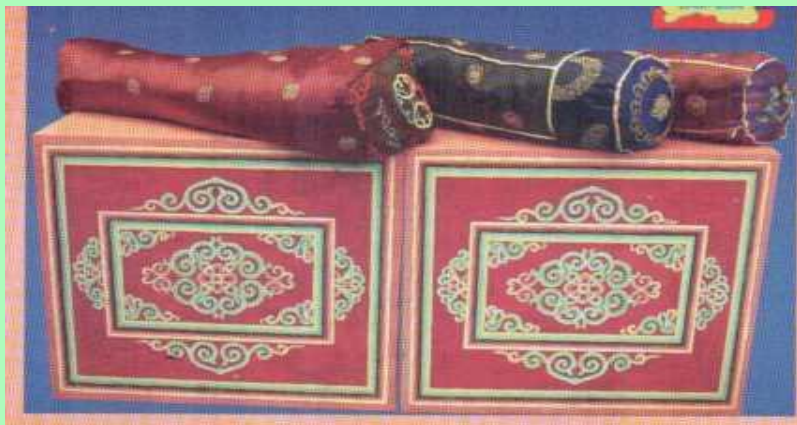
Апара (сундук) и подушки (шитьё, роспись по дереву.)

Примерные ответы (В национальных предметах, в женских украшениях, в быту, на коврах).