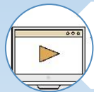
фото-, видео-материалах по проекту

проблемах, выявленных в ходе реализации проекта, и предлагаемых методах их решения