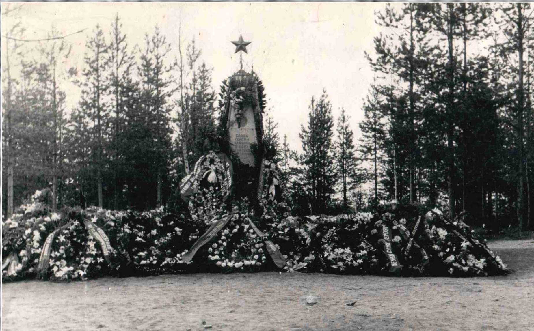
Братская могила 1965 год