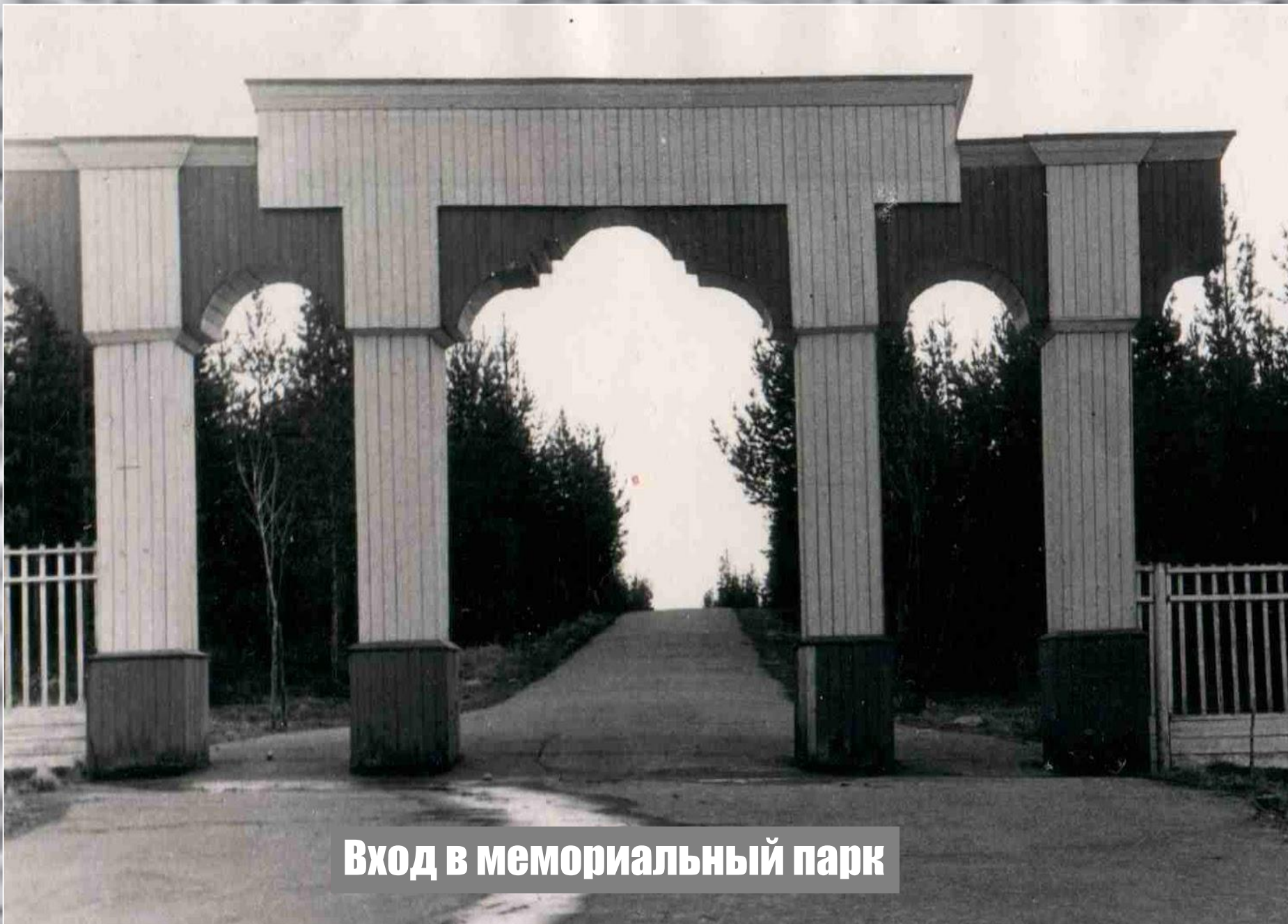
Вход в мемориальный парк