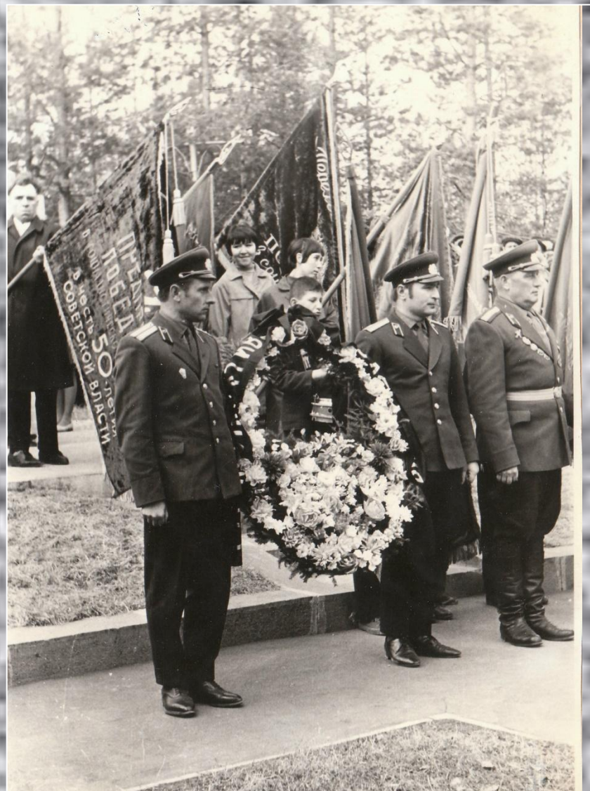
Митинг на братской могиле. 9 мая 1969 года.