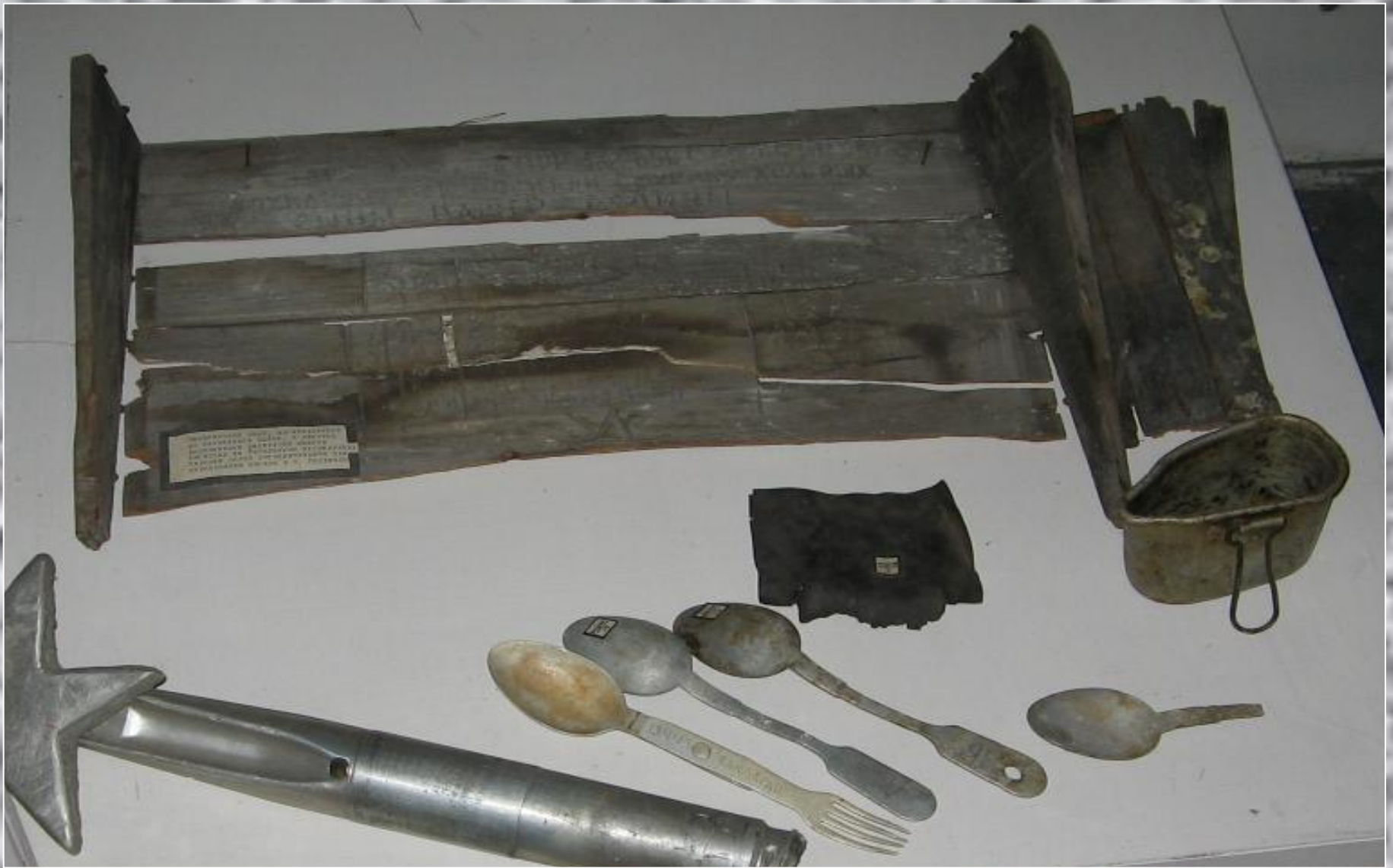
Вещи, найденные при перезахоронении