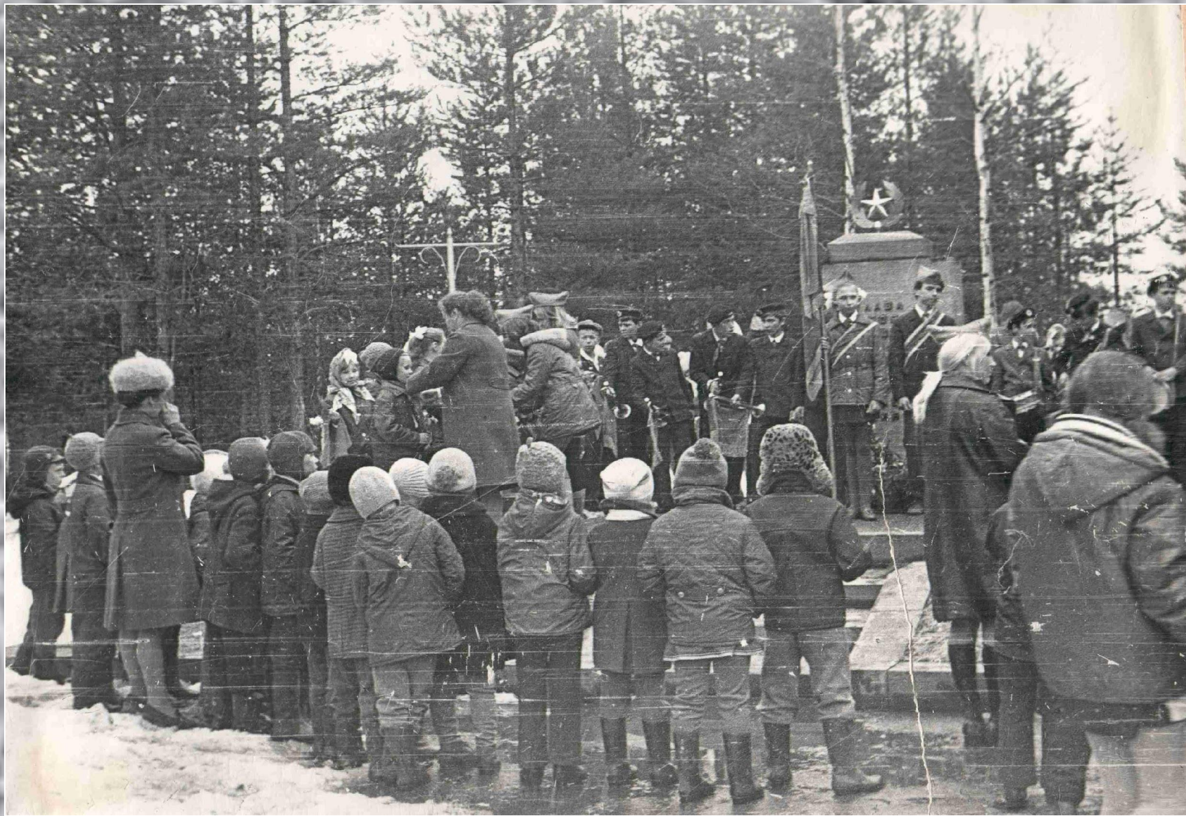
Вахта памяти на братской могиле