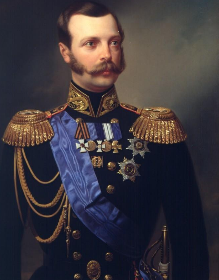
Александр II (1855-1881)