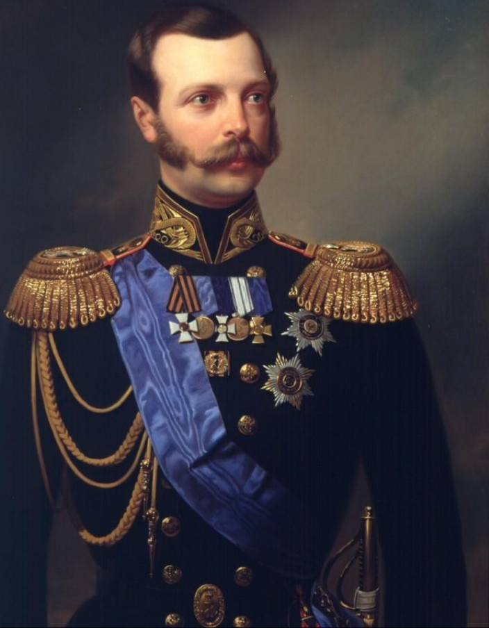
Александр II (1855-1881)