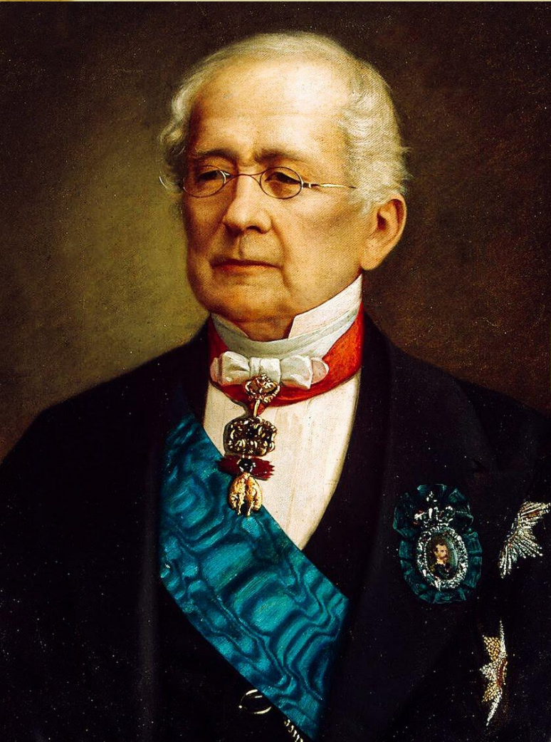
А.М. Горчаков (Министр иностранных дел)