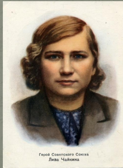
Герой Советского Союза Лиза Чайкина