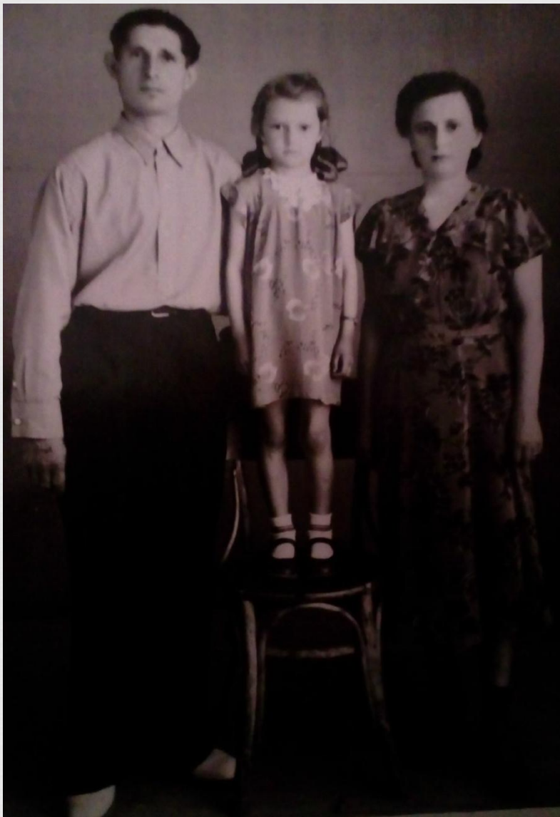
Прадедушка с женой и дочерью