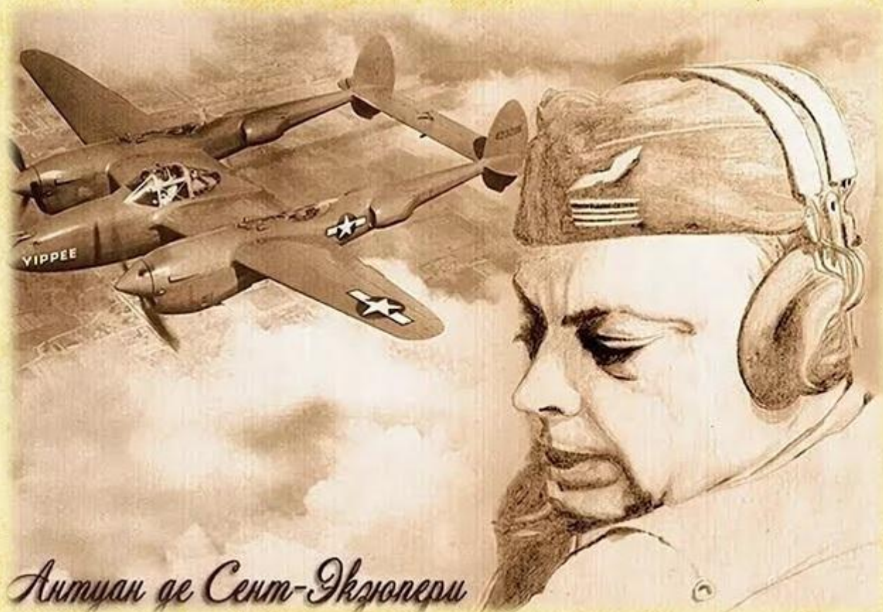
Антуан де Сент-Экзюпери