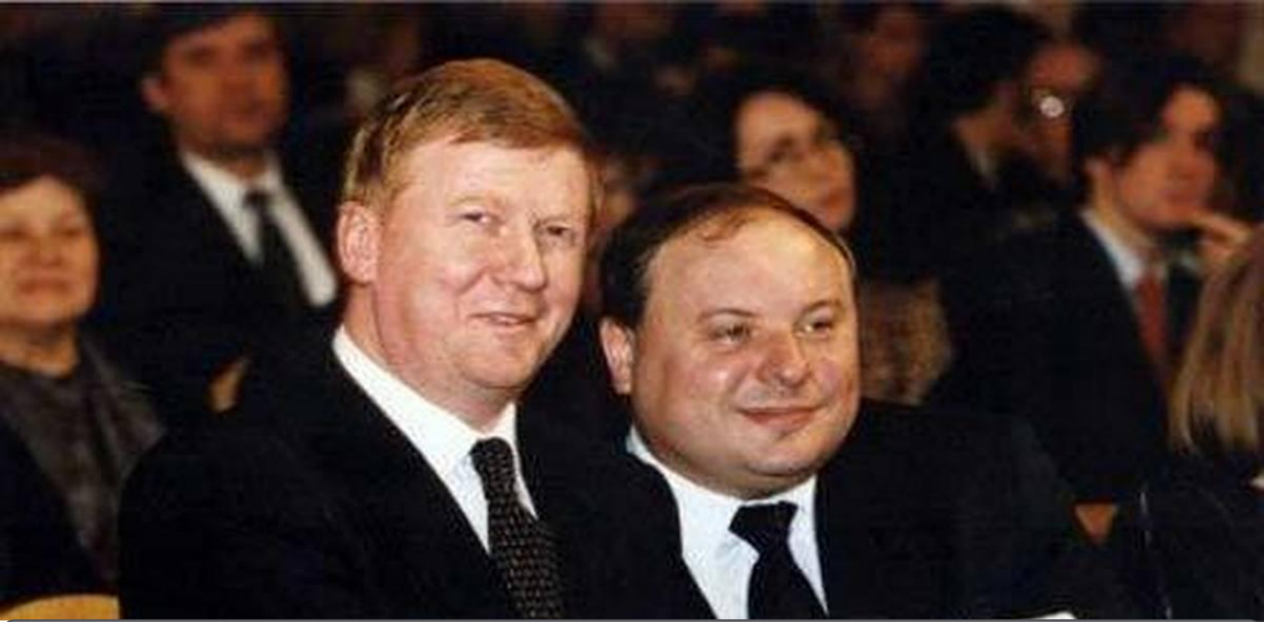
Авторы реформ – Чуйбас Анатолий Борисович и Гайдар Егор Тимурович