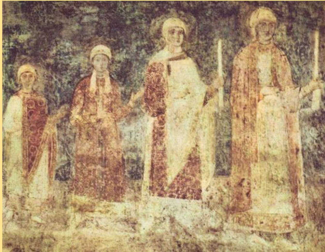
Фреска «Семья Ярослава Мудрого», XI век, Софийский собор

Фреска - живопись по сырой штукатурке, одна из техник стенных росписей